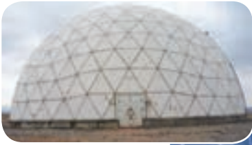
● رصدخانه مراغه