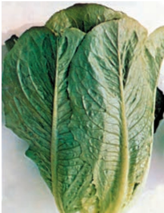
شکل ۶۱-۱- الف

برگها: بدون دمبرگ با قاعده نسبتاً پهن (رگبرگ و سطحی در قاعده بسیار پهن است) بر روی ساقه چسبیده و اغلب بر روی آن تا شده است و گویچه‌ای را به وجود می آورد. برگهای درونی کم رنگ تر، زرد، کرم یا زرد مایل به سبز می باشند. برگهای بیرونی به رنگ سبز تیره یا سبز مایل به خاکستری است. برگها، نرم، آبدار، شیرابه دار، خوشمزه و کمی شیرین می باشند که خوراکی هستند (شکل ۶۱-۱).