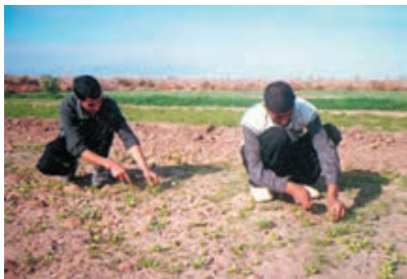
شکل ۶۷- ۱

شد مجموعه‌های کوچک را به تک گیاه تنک کنید تا فقط یک گیاه در هر محل باقی بماند (شکل ۶۷-۱).