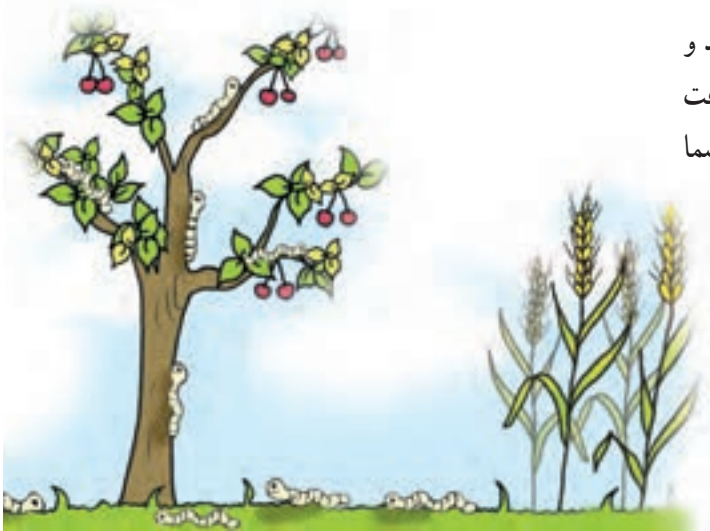
شکل ۳-۴- افزایش آفات و بیماریها

۳- افزایش آفات و بیماریها: کشت ممتد یک گیاه باعث تجمع آفات و بیماریهای بخصوصی با توجه به شرایط مساعد و وجود میزان مناسب در طول سالهای پیایی خواهد شد مثل آفت کرم ساقه خوار برنج یا بوته میری جالیز (حداقل دو مثال نیز شما ارائه نمایید) (شکل ۳-۴).