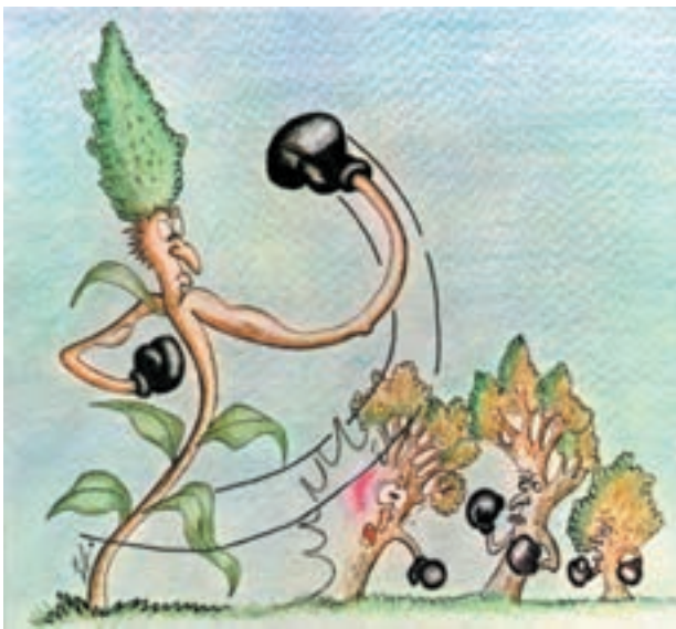
شکل ۴-۴- غلبه علف هرز بر بعضی از گیاهان

۴- افزایش علفهای هرز: در اثر کشت تک محصولی، علفهای هرز گیاهان میزبان به نحو مؤثری افزایش می یابد. در حالی که با تغییر گیاه میزبان شرایط مناسب رشد علفهای هرز نیز از بین خواهد رفت مثلاً رشد و توسعه یولاف در کشت ممتد گندم (مثال دیگری را شما ارائه نمایید) (شکل ۴-۴).