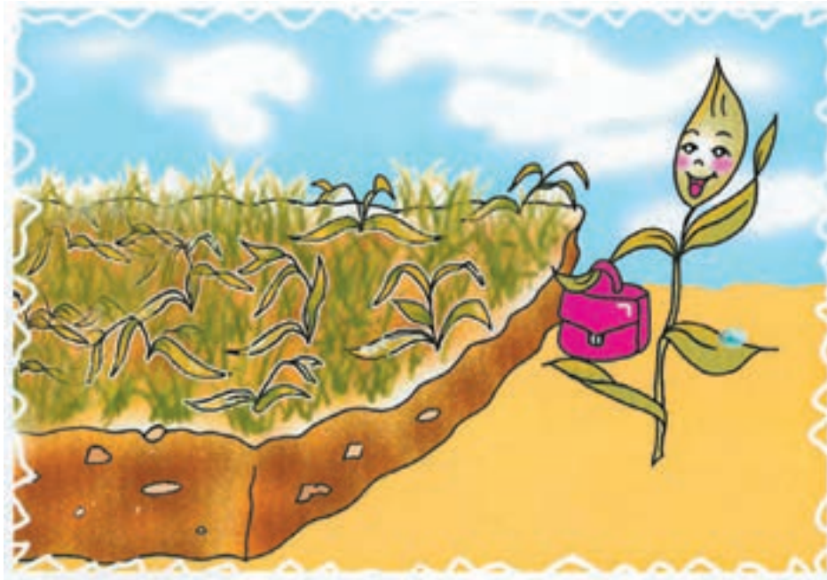
شکل ۲-۴- استقبال زمین از گیاه جدید

در گذشته و در زراعت سنتی، کشت گیاهان در یک زمین زراعی به صورت پیاپی و ممتد انجام می شد مثلاً اگر برای مدت طولانی فقط کشت گندم یا در بعضی مناطق فقط کشت برنج و ... بر روی یک زمین صورت گیرد. این استفاده از یک نوع محصول، «زراعت یکطرفه» یا «تک محصولی» و یا