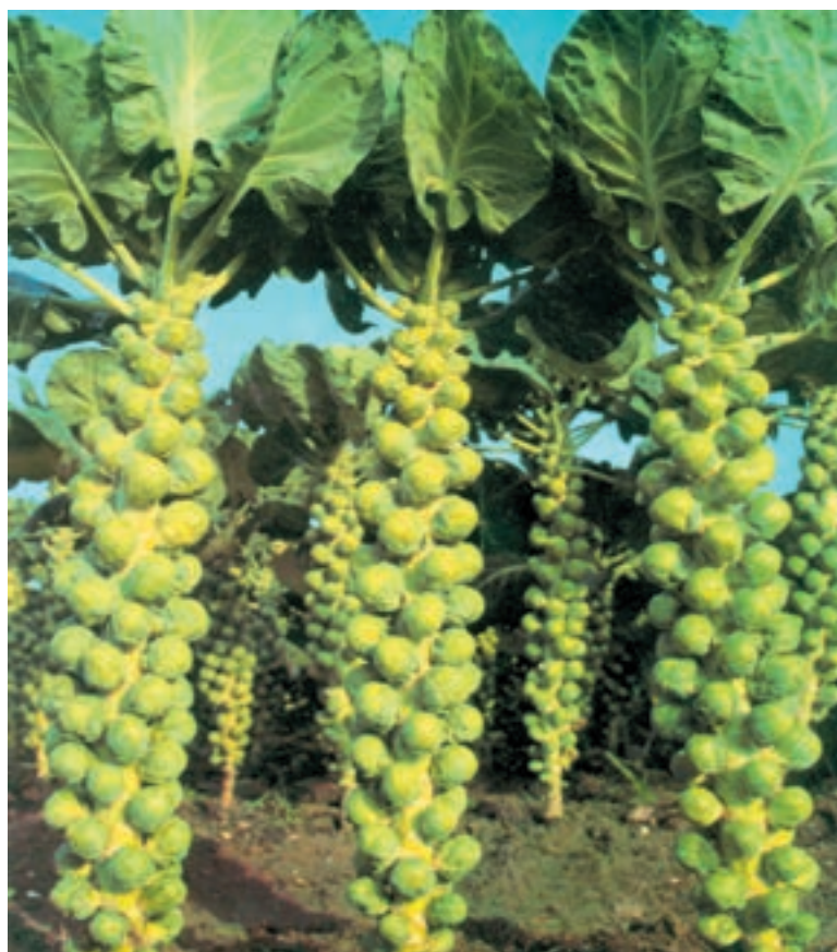
شکل ۸۶-۱- تکمه‌ها را روی گیاه کلم دکمه‌ای نشان می‌دهد.

- گیاهی از خانواده چلیپاییان ۱ و از جنس براسیکا ۲ و گونه براسیکا اولرسه ۳ آ و از واریته ژمنیفر ۴ است (شکلهای ۸۶-۱ و ۸۷-۱).