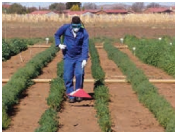
شکل ۲۳-۳- کنترل علف‌های هرز با استفاده از گرما

۴-۸-۳- کنترل فیزیکی علف‌های هرز: برای کنترل فیزیکی علف‌های هرز از گرما و آتش استفاده می‌شود. (شکل ۲۳-۳).