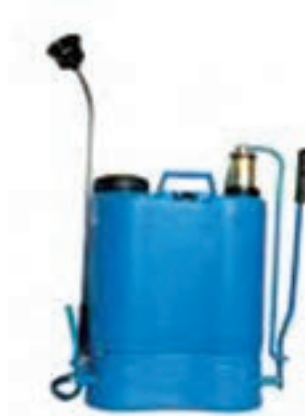
شکل ۲۷-۳- سم پاش کتابی پشتهی /هرمی