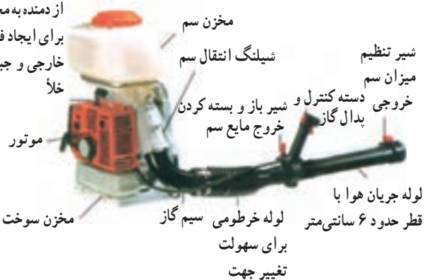
شکل ۲۹-۳- سم‌پاش موتوری پشتی اتومایزر

از دمنده به مخزن برای ایجاد فشار خارجی و جبران خلأ