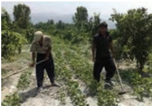
شکل ۲۱-۳- وجین علف‌های هرز با استفاده از وسایل دستی

۴- علف‌های هرز را از محصول اصلی تشخیص دهید و آنها را با استفاده از ابزار، از خاک خارج کنید (شکل ۲۱-۳).