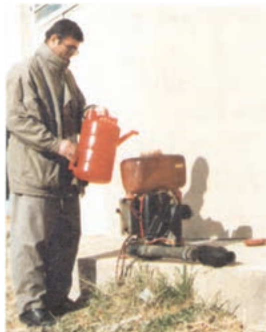
شکل ۲۴-۳- پر کردن مخزن شعله افکن