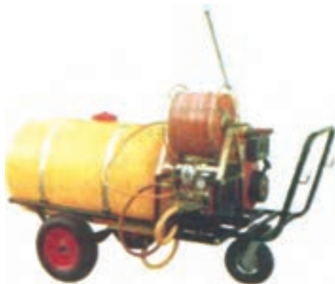
شکل ۳۰-۳- سم‌پاش فرغونی

عدد است و شیلنگ و لانس بر سر آن نصب می‌شود. برای سم‌پاشی علف‌های هرز مزارع، سم‌پاش را در بیرون مزرعه قرار می‌دهند و حدود ۵۰ تا ۱۰۰ متر شیلنگ را به آن اضافه می‌نمایند. سپس به همراه ۲ تا ۳ نفر، این شیلنگ‌ها را به داخل مزرعه برده و سم‌پاشی را انجام دهید (شکل ۳۰-۳).