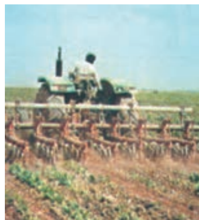
شکل ۲۲-۳- وجین علف‌های هرز با استفاده از ماشین مرکب سله‌شکنی و وجین‌کن

۳- تراکتور را طوری وارد مزرعه کنید که چرخ‌های آن در بین ردیف‌ها قرار گیرد و به گیاه اصلی صدمه وارد نسازد. تراکتور را به طور اصولی و صحیح و با سرعت مناسب، در مزرعه به حرکت درآورید تا عمل سله‌شکنی و وجین انجام شود (شکل ۲۲-۳). گزارش کار این فعالیت‌ها را به مربی خود تحویل دهید.