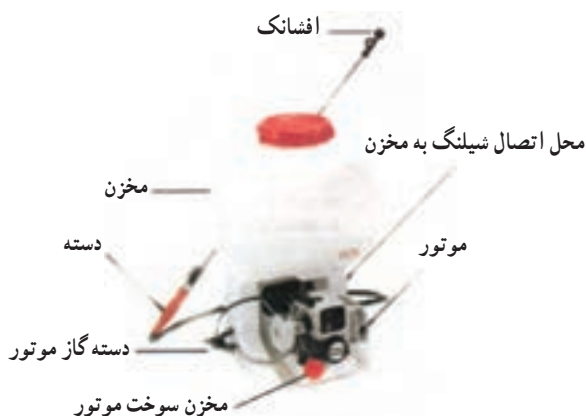
شکل ۲۸-۳- سم‌پاش موتوری پشتی لانس‌دار