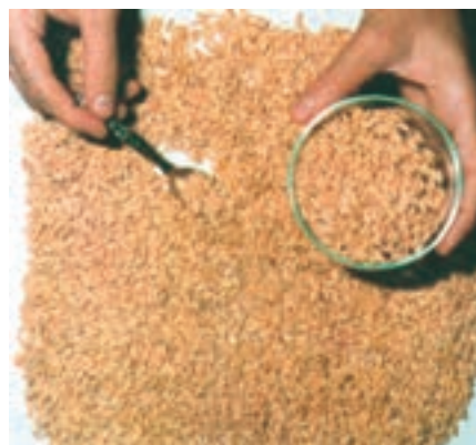
شکل ۲۰-۳- بذور عاری از علف هرز

(الف) استفاده از بذور عاری از بذور علف هرز (شکل ۲۰-۳):