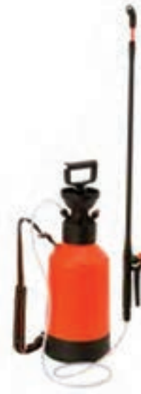
شکل ۲۶-۳- سم پاش استوانه‌ای پشتی ساده

کار، سم پاشی کنید. نکته مهم این است که در جریان سم پاشی با این سم پاش، باید تلمبه زنی را به صورت یک نواخت تکرار کنید تا فشار افت نکند (شکل ۲۷-۳).