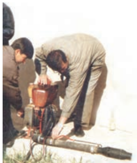
شکل ۲۵-۳- آماده سازی و روشن کردن شعله افکن

۷- گاز دستگاه را به میزان مورد نیاز تنظیم نمایید.