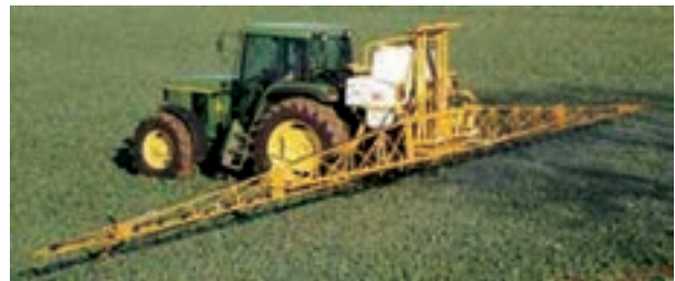
شکل ۳۱-۳- سم‌پاش پشت تراکتوری بوم‌دار

لازم است سالیانه حداقل یک بار سم‌پاش را، چنان‌که توضیح داده شد، برای تنظیم میزان خروجی، کالیبره نمایید. از این نوع سم‌پاش در ایران برای مبارزه با علف‌های هرز مزارع بزرگ استفاده می‌شود (شکل ۳۱-۳).