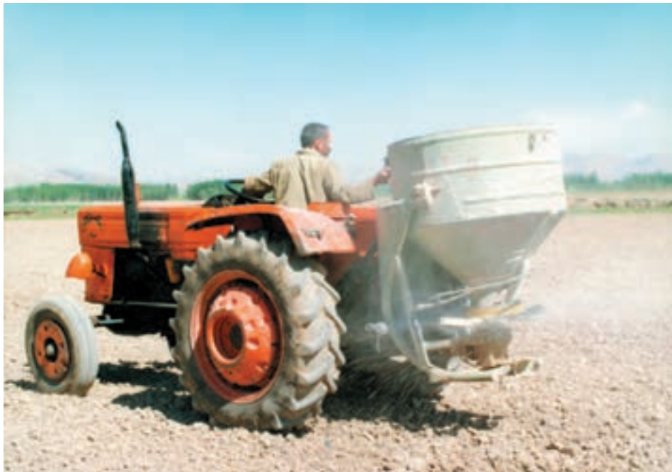
شکل ۸-۴- پخش کود شیمیایی به وسیله کودپاش ساتریفوز

– کودهای ازته را در دو نوبت به زمین بدهید: نوبت اول موقع کاشت و نوبت دوم تا بیست روز بعد از سبز شدن گیاه.