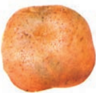
شکل ۴-۶-و- رقم آمبسادور