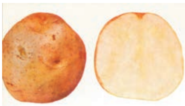
شکل ۶-۴-ج - رقم ماریتا