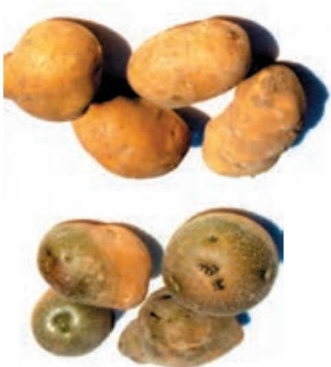
شکل ۱۳-۴- سبز شدن غده سیب‌زمینی بر اثر بیرون ماندن از خاک.

کار عملی ۳: برای جلوگیری از سبز شدن رنگ غده‌هایی که در اطراف طوقه سیب‌زمینی به وجود می‌آیند (شکل ۱۳-۴) و همچنین ازدیاد استعداد تولید غده، باید پای بوته سیب‌زمینی را خاک بدهید.