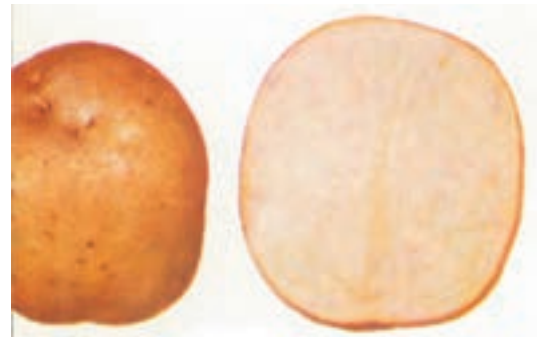
شکل ۴-۶-ز- رقم باریما