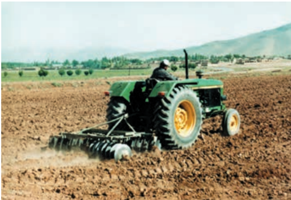
شکل ۴-۷ دیسک‌زدن زمین سیب‌زمینی

- در اوایل بهار بسته به نوع خاک شخم دیگری و یا دیسک بزنید و زمین را با لولر تسطیح نمایید (شکل ۴-۷).