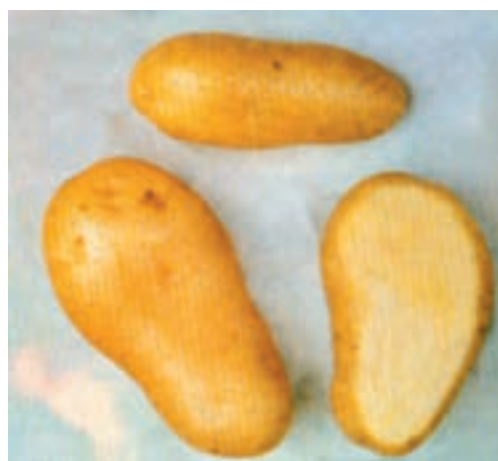
شکل ۶-۴-الف - رقم آلفا