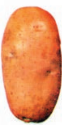
شکل ۴-۶-ح- رقم آزوکا