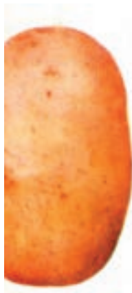
شکل ۴-۶-ط- رقم اونیر