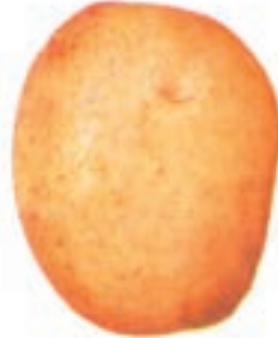
شکل ۴-۶-ه- رقم آری