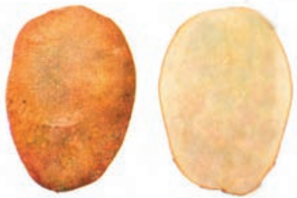
شکل ۶-۴-ب - رقم کلیماکس

درشت و پوستی نازک و گوشت آن زرد کم‌رنگ است.