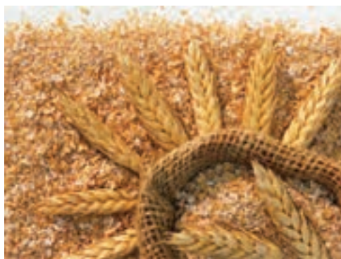
شکل ۷-۲- سبوس گندم

کنجاله سویا : کنجاله سویا منبع پروتئینی استاندارد است که سایر منابع پروتئینی در جهان را با آن مقایسه می‌کنند. این محصول حاوی انرژی و پروتئین بالا و ترکیب اسید آمینه آن برای