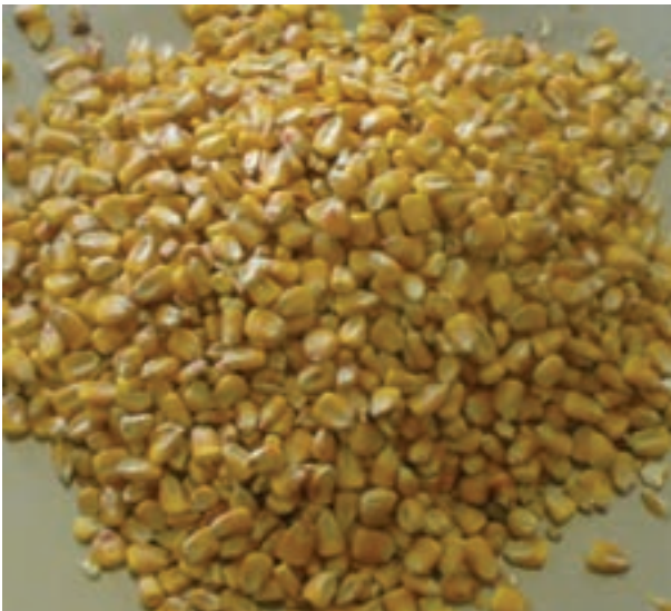
شکل ۱-۲- دانه ذرت

اگر از ذرت به مقدار زیاد و برای مدت طولانی در جیره طیور استفاده شود، به دلیل گزانتوفیل (رنگ‌دانه زرد) موجود در آن، چربی لاشه زرد می‌شود.