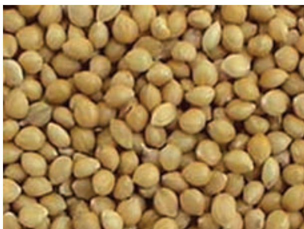
شکل ۲-۶- دانه ارزن

ارزن: میزان انرژی ارزن بالاست، اما قبل از مصرف باید عمل آوری شود. به علت داشتن مقدار بالایی از لیاف غیر قابل هضم، باید از استفاده آن در تغذیه پرندگان جوان اجتناب کرد. مقدار انرژی قابل سوخت و ساز و پروتئین ارزن حدود ۲۷۰۰ تا ۲۹۰۰ کیلوکالری و ۱۱ تا ۱۴ درصد در واریته‌های مختلف است.