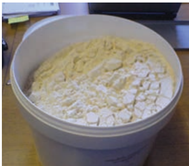
شکل ۱۵-۲- پودر آب پنیر خشک شده

شیر رسوب داده می‌شود و جدا می‌گردد و همراه آن بخش عمده چربی و تقریباً نیمی از کلسیم و فسفر موجود در شیر هم گرفته می‌شود. مایعی که بعد از این مراحل تولید می‌گردد آب پنیر نامیده می‌شود. تنها مقدار کمی از این ماده خوراکی برای مصرف در جیره‌های طیور مناسب است، زیرا نمک در پودر آن به میزان بالایی وجود دارد.