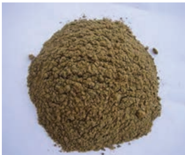
شکل ۱۴-۲- پودر ماهی

کلسیم است، در جیره طیور استفاده می‌شود. این ماده را از معادن سنگ آهک استخراج می‌کنند. پس از آسیاب کردن و به صورت پودر درآمدن از آن می‌توانید استفاده کنید. مقدار کلسیم