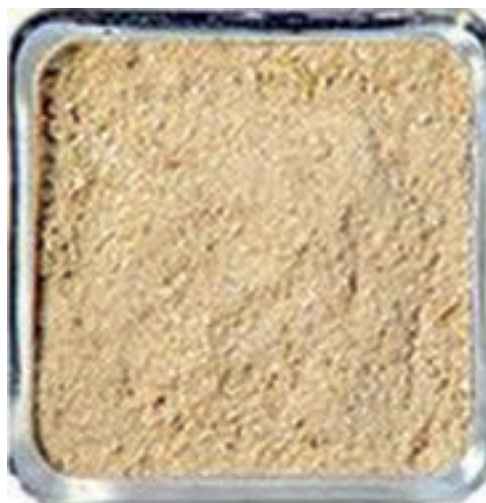
شکل ۸-۲- سبوس برنج

الیاف غیر قابل هضم (فیبر) و متغیر بودن ترکیب این خوراک ممکن است استفاده از آن را در خوراک طیور محدود کند. همچنین به دلیل وجود روغن و آنزیم‌های تجزیه‌کننده چربی، مستعد فساد است و آن را نمی‌توان زیاد نگهداری کرد.