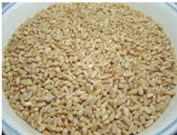
شکل ۲-۴- دانه گندم

فیبر زیاد و ماهیت فیزیکی سبوس گندم استفاده از آن را در جیره طیور محدود می‌کند. جیره‌های حاوی سبوس زیاد به رطوبت فضولات می‌افزاید و هزینه حمل و نقل این جیره‌ها به علت حجیم بودن آنها بیشتر می‌شود.