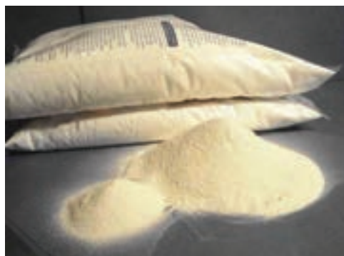
شکل ۱۸-۲- دی کلسیم فسفات

مقدار کلسیم و فسفر دی کلسیم فسفات ۲۲ و ۱۸/۷ درصد است و مقدار کلسیم و فسفر منو کلسیم فسفات ۱۶ و ۲۱ درصد است.