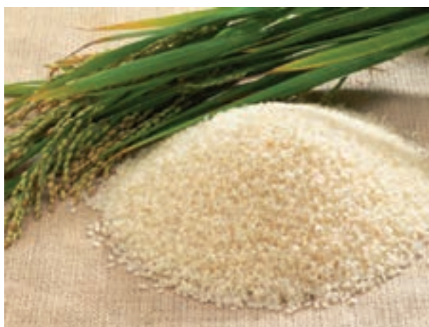
شکل ۲-۵- دانه برنج

برنج دارای مقدار زیادی بازدارنده تریپسین است که با حرارت معمولی از بین می‌رود.