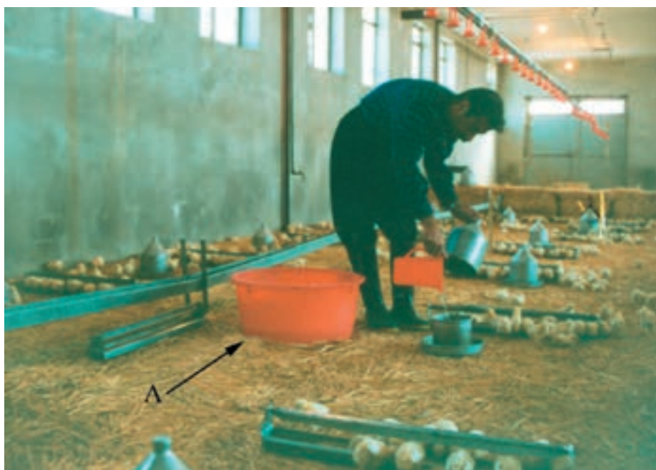
تقسیم واکسن آشامیدنی آماده شده در بین آبخوریهای دستی A: ظرف حاوی محلول واکسن تهیه شده

۱- روش آشامیدنی: این روش یکی از ساده‌ترین شیوه‌های واکسینه کردن است. در این روش باید به مقدار مجاز