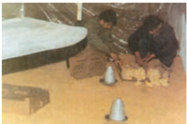
نوعی مادر مصنوعی