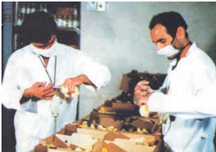
واکسیناسیون جوجه یکروزه در مؤسسات جوجه‌کنشی