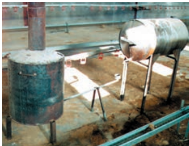
تصویر نوعی بخاری داخل جایگاه که کنترل حرارت به وسیله آن مشکل است و احتمال آتش‌سوزی در آن زیاد است.

۱- مادر مصنوعی آویز: رایج‌ترین نوع مادر مصنوعی است که باید با کابل یا طناب از سقف آویزان شود، بطوری که بتوان آن را با توجه به سن و رشد جوجه بالا و پایین نمود و در صورت عدم استفاده تا حد امکان آن را بالا کشید تا در دوره‌های بعد از آن استفاده شود.