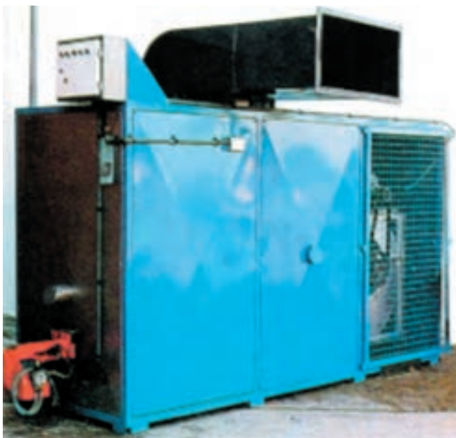
نمونه یک نوع هیتر

۲- مادر مصنوعی زمینی: مادرهای مصنوعی در این نوع، برعکس مادرهای آویز که حرارت از بالای سر جوجه توزیع می‌شود، منبع حرارتی در زمین قرار دارد و جوجه را گرم می‌کند. بدین ترتیب که از منبع حرارتی، گرما به وسیله آب گرم و یا هوای گرم، به کمک لوله‌هایی به داخل جایگاه فرستاده می‌شود. هیتر: امروزه در بسیاری از مرغداریها برای گرم کردن جایگاه از هیتر استفاده می‌شود. در این روش دستگاه تولیدکننده گرما در خارج از جایگاه قرار دارد و هوای گرم به واسطه کانال به داخل جایگاه فرستاده می‌شود و درجه حرارت داخل جایگاه با ترموستاتی کنترل می‌گردد.