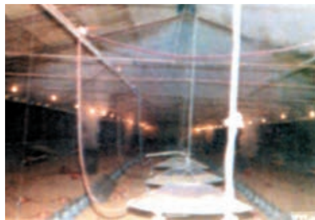
مادرهای گازی آویز