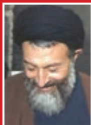
شهید دکتر بهشتی