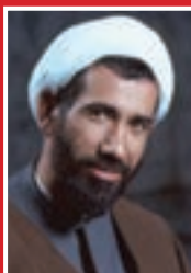
شهید دکتر باهنر