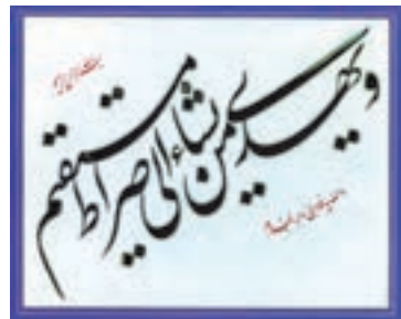
سوره یونس آیه ۲۵