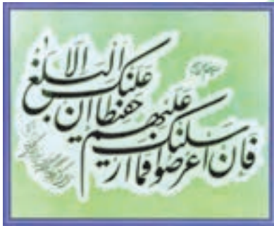
سوره شوری آیه ۴۸

پس از پیروزی انقلاب اسلامی، به دلیل درخواست‌های مکرر قرآن دوستان و قرآن پژوهان، رسانه‌های متنوع قرآنی در کشور ایجاد شده و رشد خوبی داشته است. برای آشنایی و استفاده شما دانش‌آموزان عزیز برخی از این رسانه‌ها معرفی می‌شود.