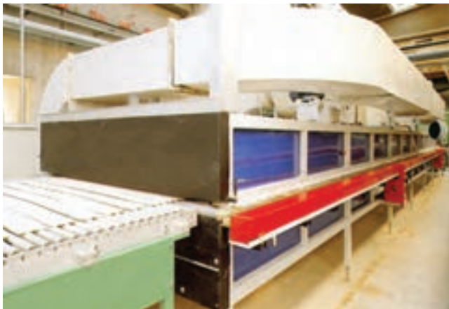
شکل ۲-۵- خشک‌کن مداوم صنعت کاشی

در کارخانجات انرژی گرمایی مورد نیاز این نوع خشک‌کن‌ها، انرژی گرمایی هم از انرژی مازاد کوره‌های پخت سرامیک و هم از منبع جدا و اختصاصی، تأمین می‌گردد (شکل‌های ۲-۵ و ۳-۵).