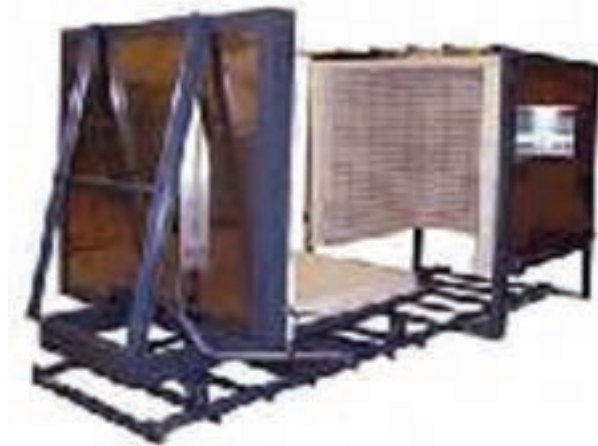
شکل ۱-۵- خشک کن متناوب

از خشک کن های متناوب، اغلب در جاهایی استفاده می شود که ظرفیت تولید پایین می باشد. انرژی گرمایی مورد نیاز این نوع خشک کن ها معمولاً از انرژی گرمایی مازاد کوره های پخت سرامیک تأمین می گردد. نیاز به تعداد بیشتر نیروی انسانی در چیدمان و راه اندازی خشک کن های متناوب و مصرف انرژی گرمایی زیاد در مقایسه با خشک کن های مداوم، از نقاط ضعف عمده ی آنها محسوب می شود (شکل ۱-۵).