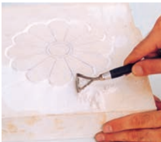
تصویر ۴-د - تراش زمینه برای برجسته شدن طرح