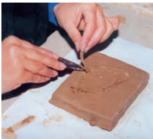
تصویر ۱- و - برداشتن قسمتهای اضافی اطراف طرح