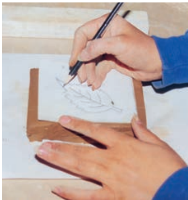
تصویر ۱- ج - انتقال طرح روی لوح