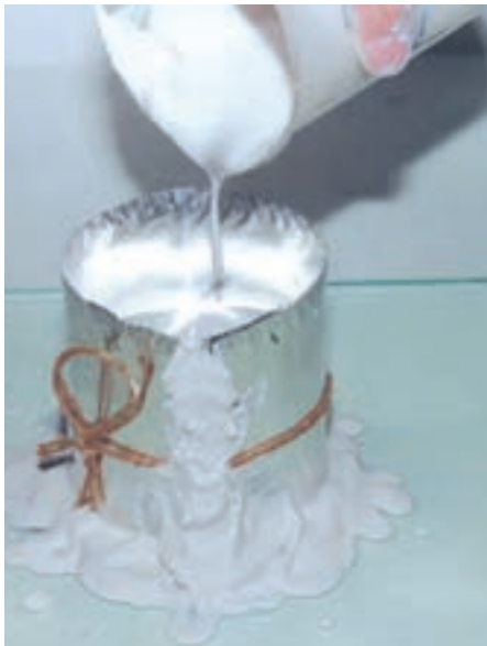
تصویر ۵- ب- ریختن دوغاب گچ آماده شده در قالب