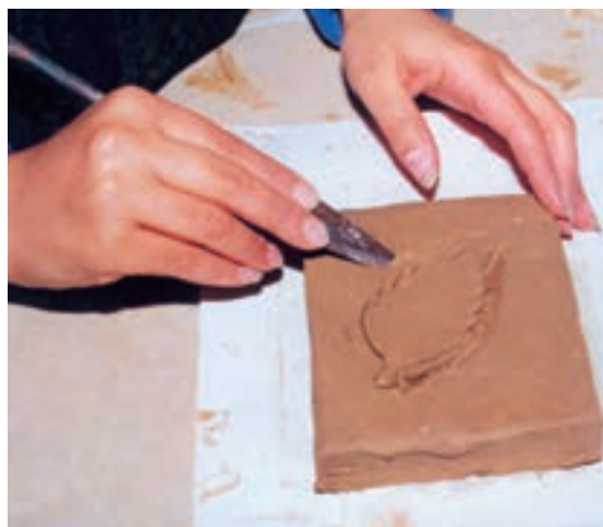
تصویر ۱- ه - کندن اطراف طرح با زاویه ۴۵°