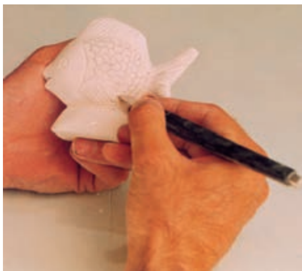
تصویر ۶-د - ایجاد ظرافت و ریزه‌کاریها