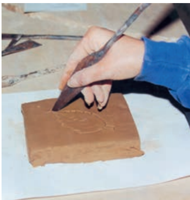
تصویر ۱- د - برش محیط طرح