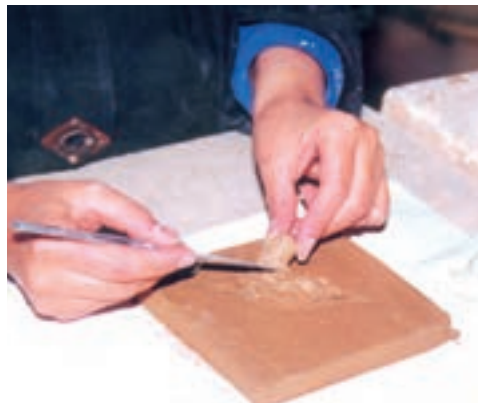
تصویر ۳- الف- افزودن خمیر گل بر سطح طرح

۲-۱- ساخت نقش برجسته گلی به روش افزودن: در این روش با افزودن گل بر روی سطح، برجستگی به وجود می‌آید. لوح گلی مناسب برای این کار بهتر است ضخامتی در حدود یک تا دو سانتی متر داشته باشد. طرح را روی لوح گلی انتقال می‌دهیم و بر روی سطح طرح شیارهایی ایجاد نموده، با کمی دوغاب ۱ از