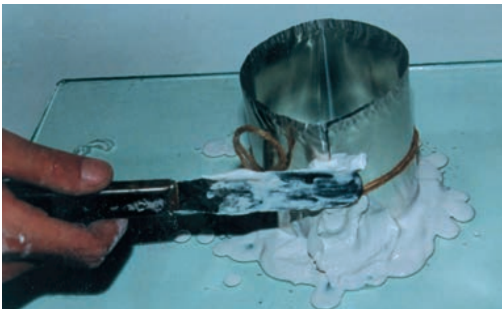
تصویر ۳- ساخت قالب کلی به شکل استوانه و بستن درزهای آن با خمیر گچ

گچ به دیواره جلوگیری و پس از گیرش به راحتی از قالب جدا شود (تصویر ۴).