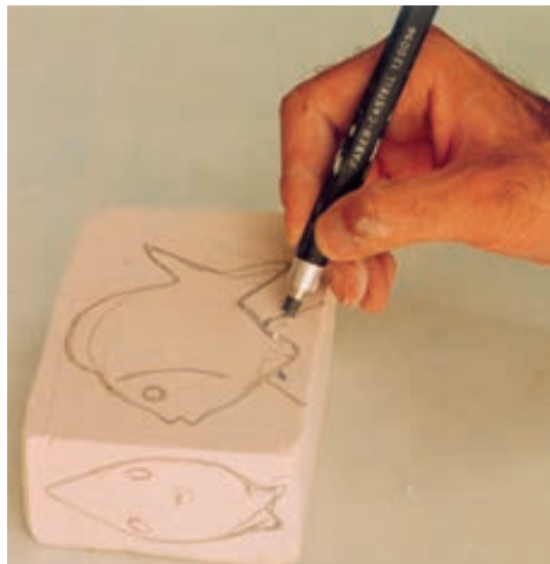
تصویر ۶-الف - انتقال طرح روی سطح گچ