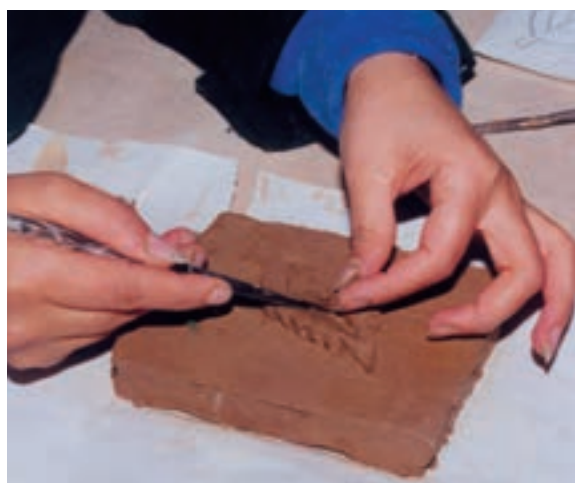
تصویر ۱- ح - ساخت و ساز و ایجاد ظرایف طرح