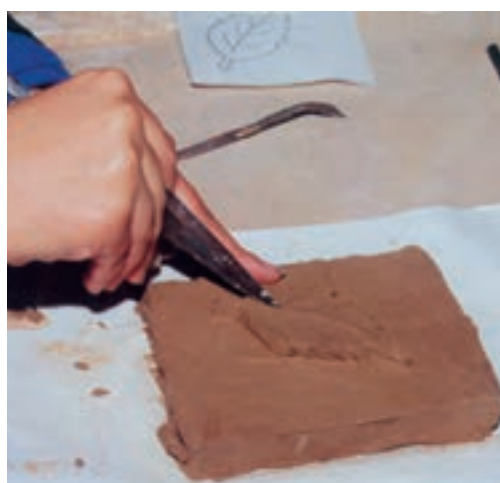
تصویر ۱- ز - ساخت و ساز و ایجاد ظرایف طرح

می‌کنیم. این مرحله باید به تدریج انجام شود تا لوح تاب و ترک بر ندارد. بهتر است لوح را روی صفحه توری یا زیر پوشش نایلونی منفذدار، به دور از جریان مستقیم هوا، خشک کنیم (تصویر ۲).