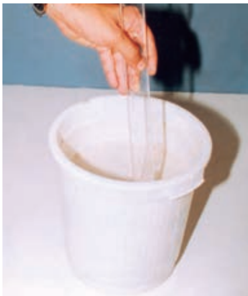
تصویر ۱- ب - مخلوط کردن دوغاب گچی با همزن دستی

در طول این مدت گچ کاملاً مخلوط شود. در غیر این صورت دوغابی ناهمگن به دست خواهد آمد که برای ساختن حجم مناسب نیست (تصویر ۱- الف و ب).