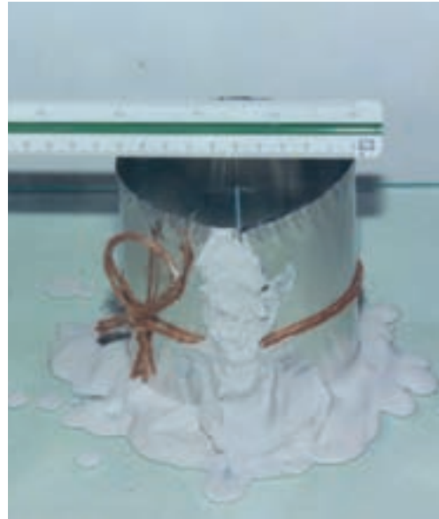
تصویر ۵- الف- اندازه گیری قطر برای محاسبه حجم قالب