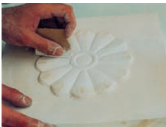
تصویر ۴-ح - پرداختکاری نقش برجسته با سمباده