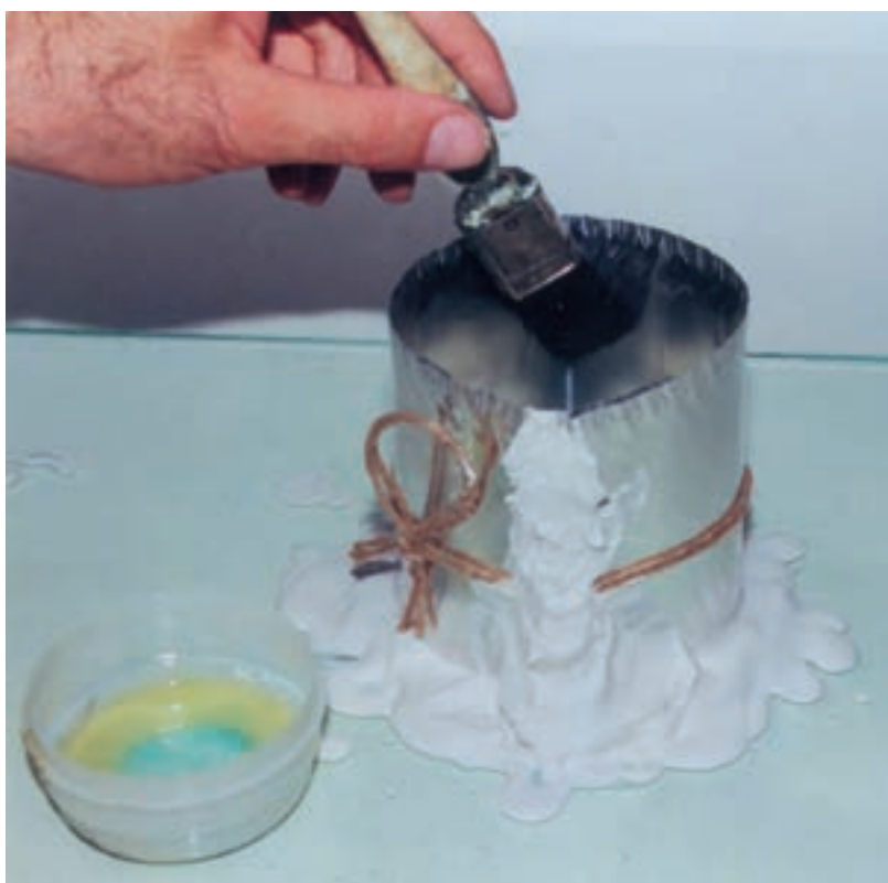
تصویر ۴- چرب کردن دیواره‌های داخل قالب با قلم مو

پس از حصول اطمینان از صحت این مراحل، سطوح داخلی قالب را با قلم مو چرب می‌کنیم تا از جذب آب و چسبیدن