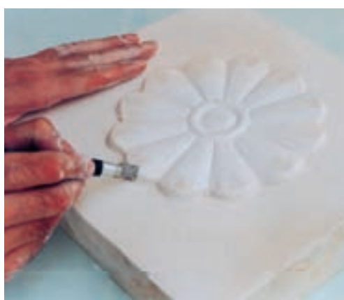
تصویر ۴-و - ایجاد ظریف کاریها روی نقش برجسته