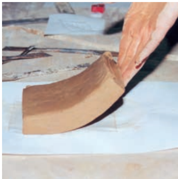
تصویر ۱- الف - مقدار رطوبت لوح زیاد است و هنگام بلند کردن خم می‌شود.

پس از آن که لوح گلی آماده کار شد یعنی رطوبت آن به اندازه‌ای رسید که به هنگام بلند کردن خم نشود، طرح مورد نظر را با ابزار نوک تیزی مانند مداد بر روی آن منتقل نموده و با ابزارهای برش‌دهنده عمق لازم را در خطوط محیطی طرح ایجاد