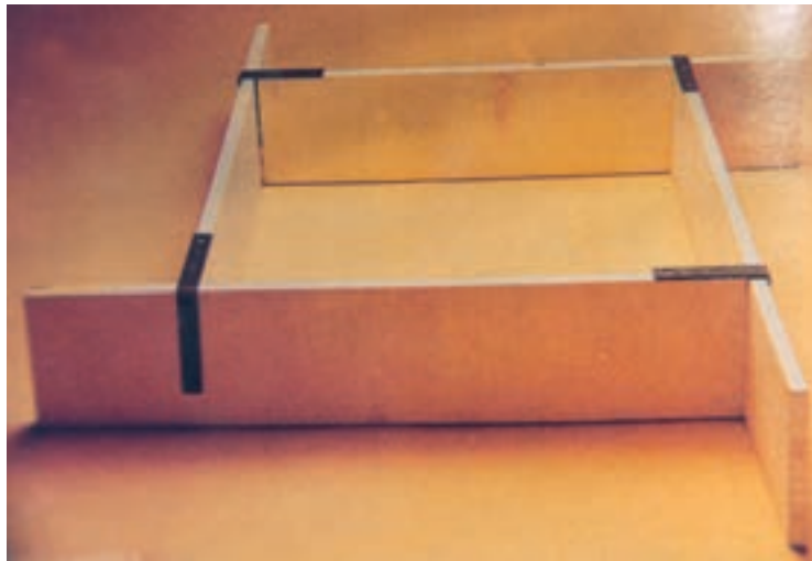
تصویر ۲- الف - ساخت قالب کلی به شکل مکعب

اگر قالب کلی به شکل مکعب باشد، از قرار دادن صفحه‌های شیشه‌ای، چوبی، سنگی و مانند آن قالب کلی را ساخته، با خمیر گچ یا خمیر گل درزهای آن را می‌بندیم (تصویر ۲- الف و ب).