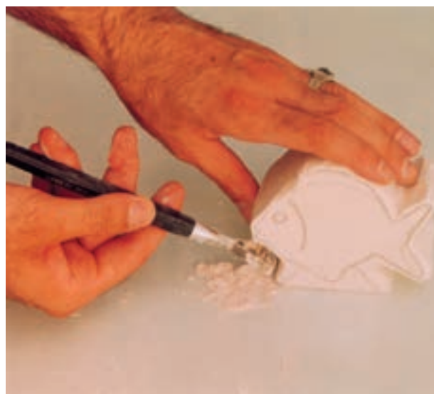
تصویر ۶-ج - تراشیدن قسمت‌های اضافی