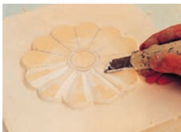
تصویر ۴-ه - ایجاد حجمهای داخل طرح