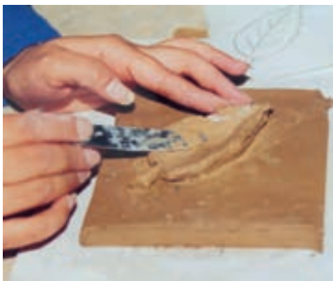
تصویر ۳- ب- شکل دادن حجم گلی

همان گل مرطوب می‌کنیم تا خمیر گل بهتر روی لوح گلی متصل شود. پس از آن لایه خمیر گل بر روی سطح طرح اضافه می‌کنیم تا نقش برجسته به وجود آید. بعد از این که شکل کلی نقش برجسته کامل شد، آن را تا حد چرمینگی خشک کرده و سپس به ایجاد ظرایف و ریزه کاریها می‌پردازیم (تصویر ۳- الف و ب).