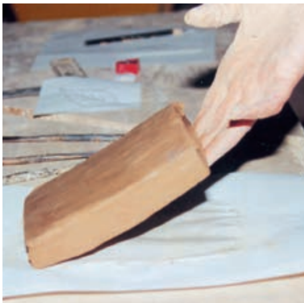
تصویر ۱- ب - مقدار رطوبت لوح برای شروع به کار مناسب است.

می‌کنیم. سپس قسمتهای اضافی زمینه را با ابزارهای کاهنده و تراش، برمی‌داریم. به این ترتیب نقش کلی به‌وجود می‌آید. آن‌گاه با استفاده از ابزارهای مختلف به ساخت و ساز و ایجاد ظرایف نقش می‌پردازیم (تصویر ۱- الف تا ح).