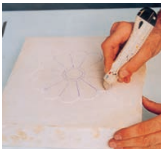
تصویر ۴- ب- برش محیط طرح

به وجود آید. آن‌گاه نقش را شکل داده به ایجاد ظرایف و ساخت و ساز آن می‌پردازیم. در پایان پرداخت نهایی و صیقلی کردن سطح نقش برجسته را با کاغذ سمباده انجام می‌دهیم (تصویر ۴- الف تا ح). در صورتی که لوح گچی کاملاً خشک باشد، برای سهولت تراش، محل مورد نظر را مرطوب می‌کنیم.