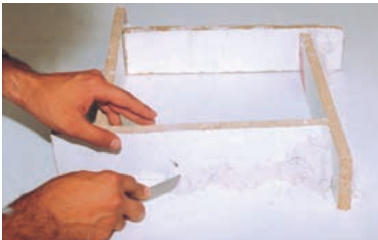
تصویر ۲- ب - بستن درزهای قالب با خمیر گچ

شکل خود را حفظ کند. سپس درزهای آن را با خمیر گل یا گچ مسدود می‌کنیم (تصویر ۳).