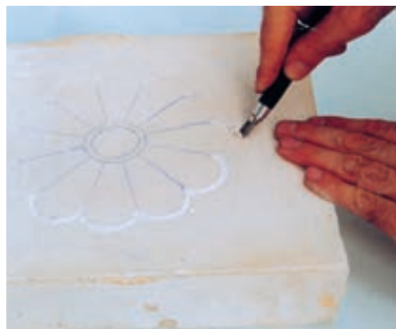
تصویر ۴-ج - جدا کردن طرح از زمینه