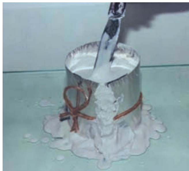
تصویر ۵- ج- خارج ساختن حبابهای هوا از دوغاب گچ