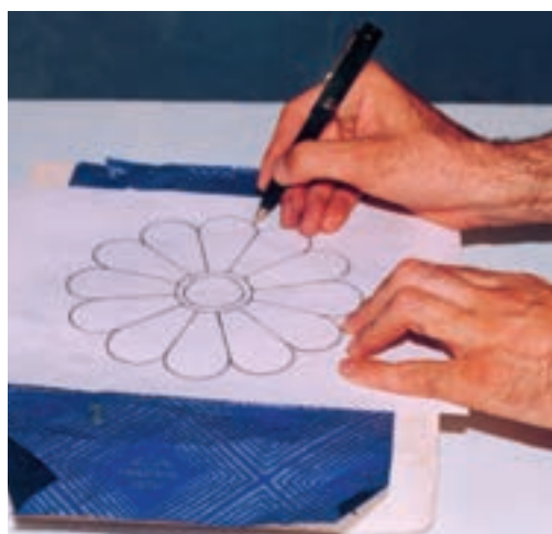
تصویر ۴- الف- انتقال طرح روی لوح گچی

بهترین روش ساخت نقش برجسته با گچ، «تراشیدن» است که طی آن با تراش و برداشتن زمینه، طرح اصلی برجسته می‌شود. برای این کار ابتدا لوح گچی به اندازه مناسب و با حداکثر ضخامت مورد نیاز ساخته، طرح را روی آن منتقل می‌کنیم. سپس زمینه را تا عمق مورد نظر می‌تراشیم تا حجم کلی