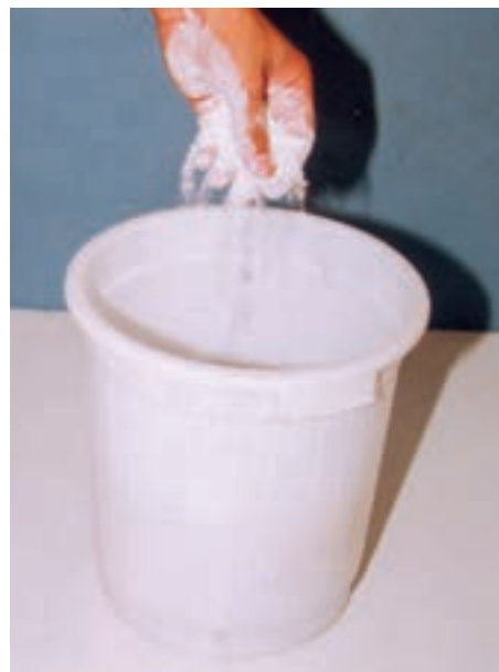
تصویر ۱- الف - ریختن پودر گچ در آب

کرده، خیس شود. پس از این مرحله با استفاده از همزن دستی یا برقی به مدت ۱/۵ دقیقه مخلوط را به هم می‌زنیم تا گچ کاملاً در آب مخلوط شود. سرعت همزن باید به اندازه‌ای باشد که