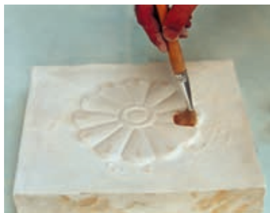
تصویر ۴-ز - تمیز کردن نقش برجسته با قلم مو