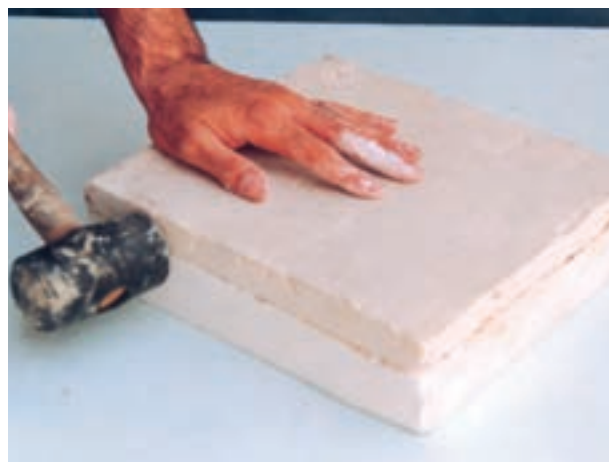
تصویر ۳-الف- جدا کردن نمونه و قالب با ضربه‌های ملایم چکش پلاستیکی