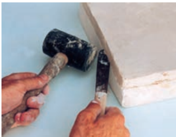
تصویر ۳-ب- جدا کردن نمونه و قالب با کاردک و چکش پلاستیکی