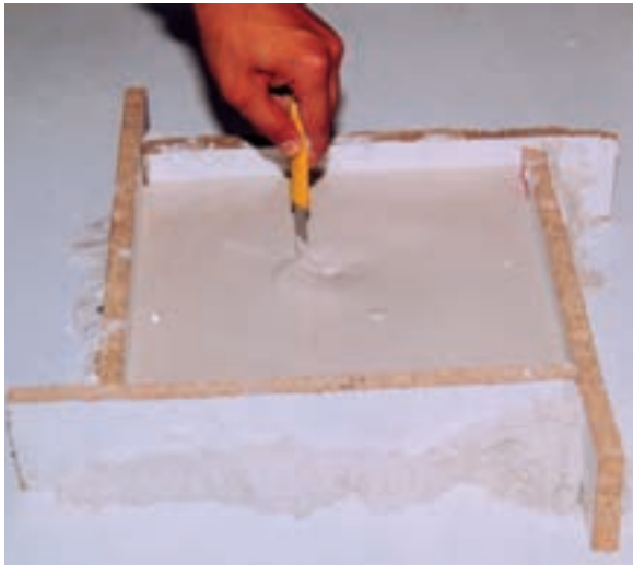
تصویر ۲- د- خارج کردن هوا از دوغاب گچی