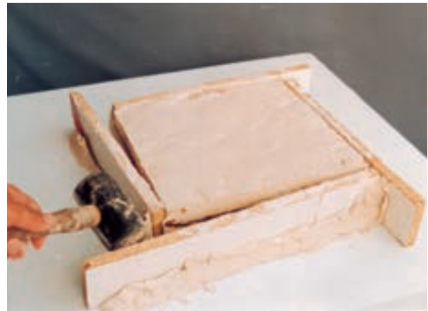
تصویر ۲- ه- جدا کردن دیواره‌ها

کنیم. باید توجه داشت که ضربه باعث پریدن لبه‌های دو قطعه نشود. سپس سطوح بیرونی قالب را پرداخت کرده با آب و قطعه‌ای ابر شستشو می‌دهیم تا کاملاً تمیز شود. به این ترتیب قالب برای تکثیر، آماده می‌شود (تصویر ۳- الف تا د).