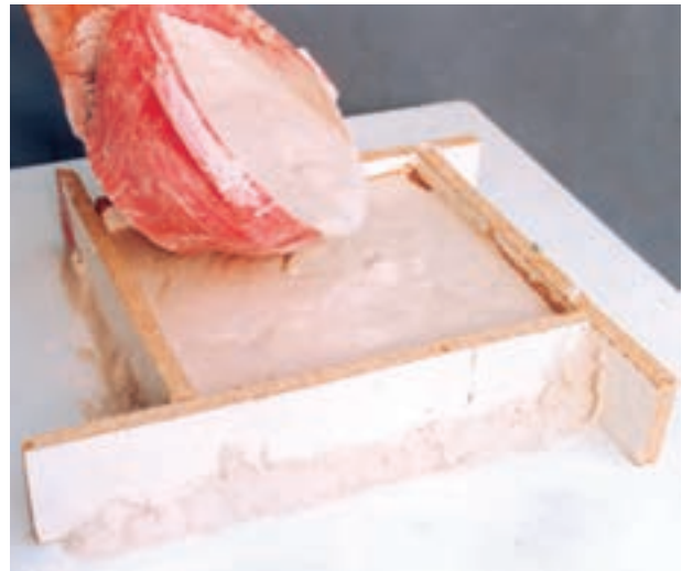
تصویر ۲- ج- ریختن دوغاب گچی روی نمونه