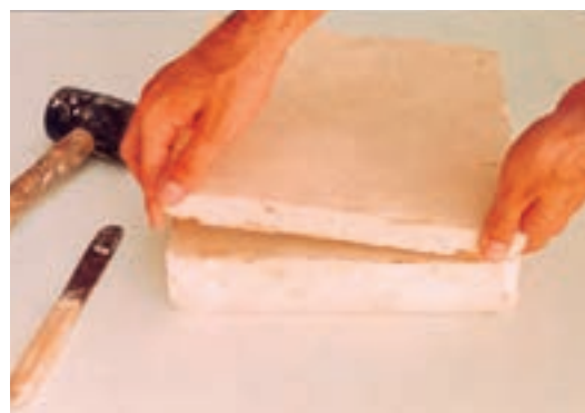
تصویر ۳-ج- برداشتن قالب از روی نمونه

به راحتی از آن جدا می‌شود. تعداد تقسیمها می‌تواند از دو تا چند قسمت باشد. ساخت قالب چندتکه به تجربه و دقت زیاد نیاز دارد.