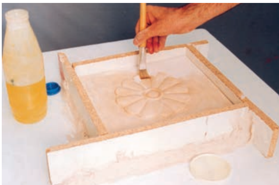
تصویر ۲- ب - آغشته نمودن سطوح داخلی دیواره و نمونه با مواد جداکننده