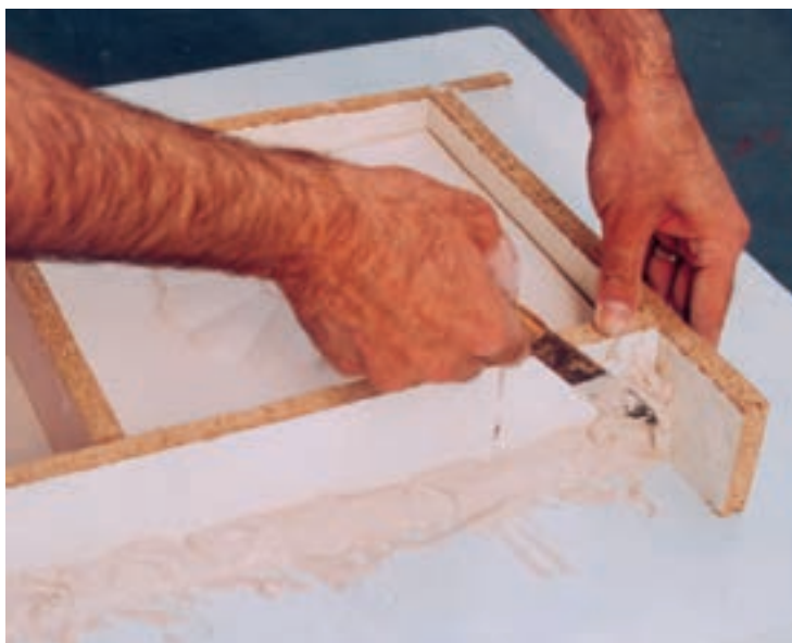
تصویر ۲- الف - ساختن دیواره در اطراف نمونه

مواد جدا کننده، آغشته می‌کنیم تا پس از قالبگیری به راحتی از هم جدا شوند. سپس در فضای خالی روی نمونه دوغاب گچی ۱ می‌ریزیم. صبر می‌کنیم تا دوغاب شروع به گیرش کند. در این مرحله مقداری حرارت ایجاد می‌شود که نشانه گیرش است. وقتی دوغاب گچی کاملاً سفت شد و حرارت خود را