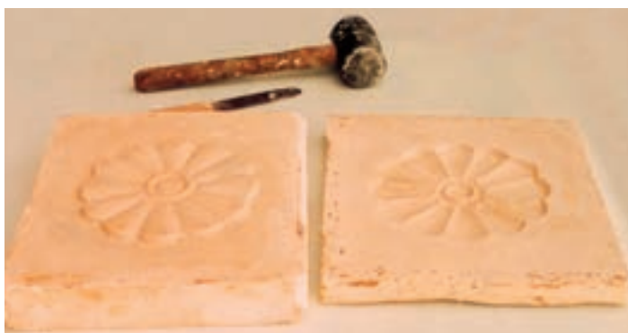
تصویر ۳-د- قالب آماده شده