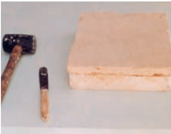
تصویر ۲- و- خشک کردن نمونه و قالب با هم