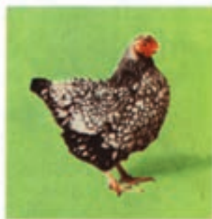
ویندوت خط نقره ای

۳- دسته مرغان آمریکایی ۱ : این دسته از تلاقی مرغان آسیایی و مدیترانه ای به وجود آمده اند. اولین بار در آمریکا پرورش و بعد به سایر نقاط انتقال یافتند. از نظر اقتصادی بسیار مهم و صفات ظاهری آنها تیپ دو منظوره این دسته را نشان می دهد. از این رو برای تولید گوشت از آنها استفاده می شود. علاوه بر این تولید تخم مرغ در آنها نیز نسبتاً بالاست. نژاد پلیموت روک، ویندوت و ردآیلندرد را جزء این دسته می توان نام برد (شکل ۲-۴).