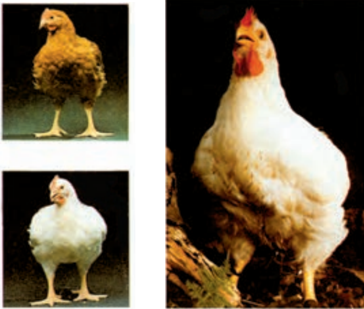
شکل ۲-۶- مرغان تیپ گوشتی

کیفیت گوشت نیز بهتر از نژادهای دیگر است، از نظر تولید تخم مرغ ضعیف هستند. از مهم ترین نژادهای این تیپ می توان نژاد کورنیش، وایت روک، ساسکس و براهما را نام برد (شکل ۲-۶).