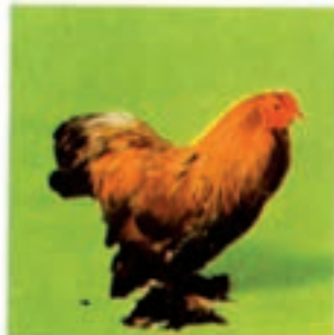
براهمای نقره ای