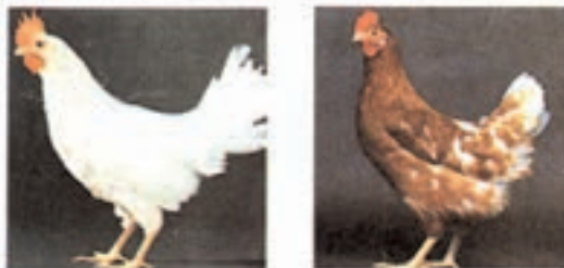
شکل ۲-۷- مرغان تیپ تخمگذار

۲- تیپ تخمگذار: مرغ های تیپ تخمگذار عموماً دارای جثه ای کوچک و ریز و سبک تر از نژادهای گوشتی هستند. بلوغ جنسی در آن ها زودتر بروز می کند. قابلیت و استعداد بیشتر برای تولید تخم مرغ دارند به طوری که برخی از نژادها تا ۳۰۰ عدد تخم در سال می گذارند. از دیگر خصوصیات مرغان این تیپ، این است که دیر کرج می شوند و دوره ی پرریزی (تولک رفتن) آن ها کوتاه است و به علت داشتن جثه ای ریز مصرف غذای آن ها کم است که خود از نظر اقتصادی برای تولید تخم مرغ مورد توجه است. نژادهای لگهورن، مینورکا، آنکونا و هودان، بهترین نژادهای این تیپ هستند (شکل ۲-۷).