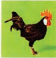
مینورکای سیاه (خروس)