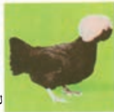
لهستانی سیاه تاج سفید

— گروه زینتی: این گروه دارای رنگ‌های مختلف و زیبایی خاصی هستند معروف‌ترین آن‌ها، مرغ‌های سیاه، کاکل سفید لهستانی — نژاد بارون ولدر که در آلمان و هلند دیده می‌شوند و نژاد فریزل ۱ که دارای پر فرفری هستند و مرغ‌های سیلکی که پر آن‌ها ظریف و ابریشمی است (شکل ۹-۲).