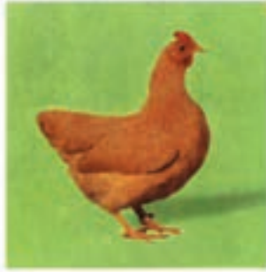
پلیموت روک نخودی