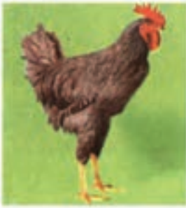
پلیموت روک خطدار

۳- تیپ دو منظوره : نژادهای دو منظوره هم از لحاظ تولید گوشت و هم از نظر تولید تخم مرغ قابل توجه هستند. در نژادهای دو منظوره پس از بلوغ جنسی تولید تخم مرغ آن‌ها خوب و در پایان دوره تخمگذاری وزن آن‌ها نیز مناسب است که می‌توان گوشت آن‌ها را در بازار به فروش رساند. مهم‌ترین آن‌ها نیوهمشایر، پلیموت روک و ردآیلندرد هستند.