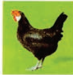
مینورکای سیاه (مرغ)