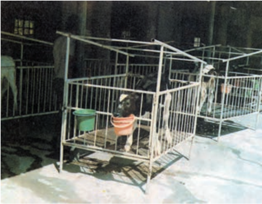
شکل ۷-۳ (بکسهای انفرادی)