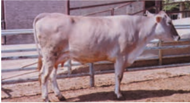
شکل ۱۵-۳ نژاد براون سوئیس

بوده و از خاکستری تا قهوه‌ای تغییر می‌نماید. گاو براون سوئیس با آب و هوای مناطق کوهستانی سازگاری خوبی دارد.