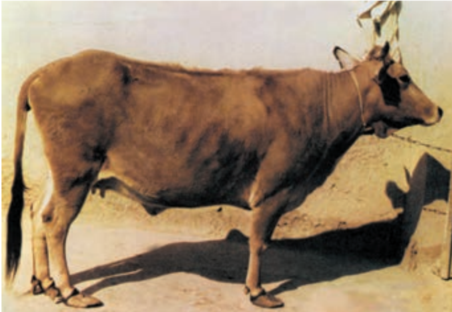
شکل ۱۸-۳ نژاد بومی سرابی

۲- نژاد گلپایگانی: موطن اصلی آن شهرستان گلپایگان می باشد. رنگ این نژاد متفاوت بوده و عمدتاً به رنگهای سیاه، قرمز بور و گاهی ابلق سیاه و سفید دیده می شود میزان تولید شیر این نژاد کمتر از نژاد سرابی می باشد.