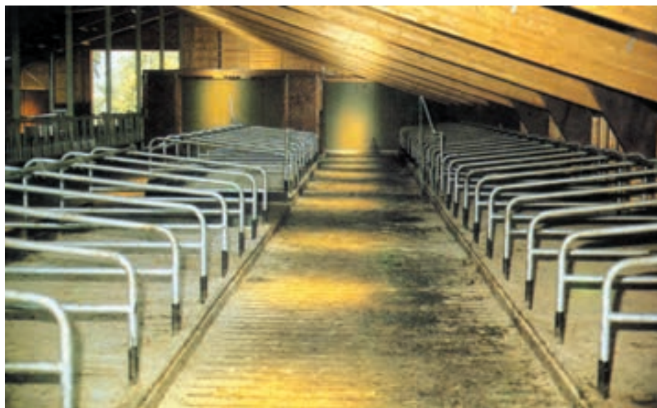
شکل ۲-۳ داخل اصطبل

به منظور جلوگیری از ناراحتی گاو و آلودگی پستان باید فضای کافی برای نگهداری گاوها در نظر گرفته شود. جایگاه انفرادی هر گاو در اصطبل از لحاظ طول و عرض طوری تعیین می‌گردد که حیوان در موقع ایستادن و استراحت راحت بوده و از آسیب و آزار گاوهای مجاور در امان باشد، ضمناً حداقل هر گاو از گاوهای دیگر به وسیله لوله‌های فلزی مجزا می‌گردد.