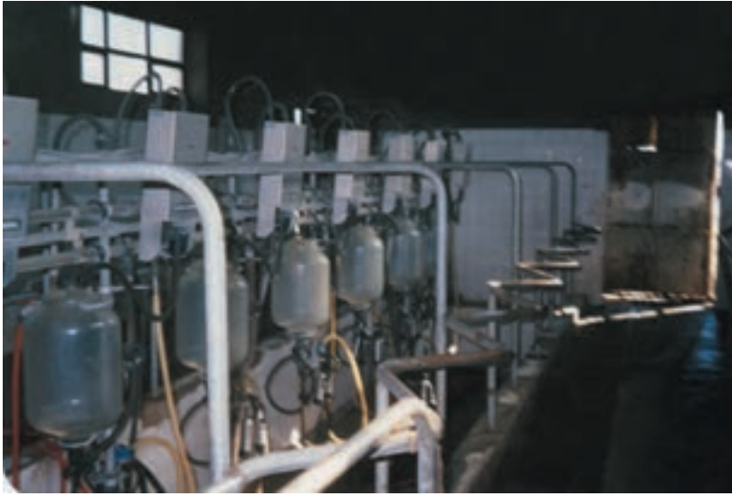
شکل ۸-۳ نمای یک سالن شیردوشی