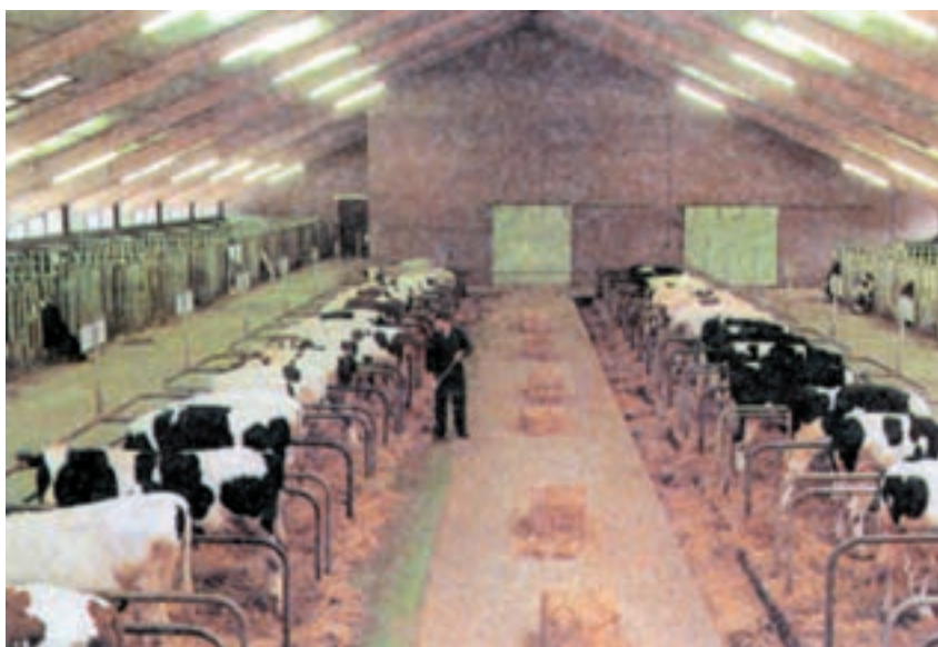
شکل ۳-۴ نمای اصطبل بسته

به منظور تغذیه گاوها در هر سه نوع اصطبل از تجهیزاتی به نام آخور و آبشخور استفاده می نمایند در اصطبلهای جدید دو نوع آخور دارای لبه سیمانی و بدون لبه سیمانی ساخته می شود. مزیت آخورهای لبه بلند در این است که از اتلاف و ریخت و پاش علوفه و مواد غذایی جلوگیری به عمل می آید اما آخورهای بدون لبه ارزاتر بوده و از نظر پاک کردن مناسبتر هستند.