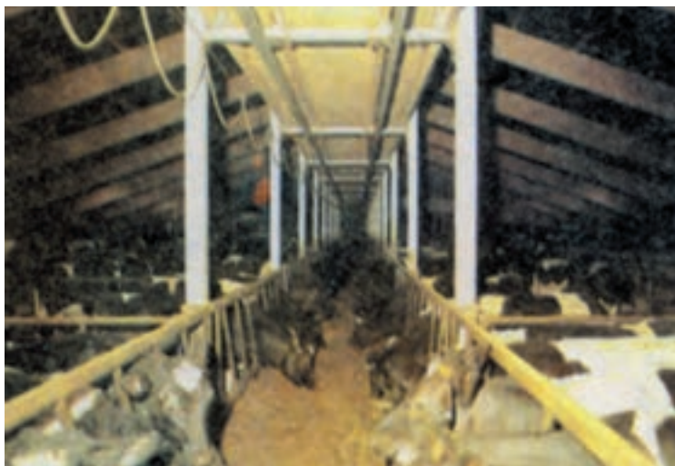
شکل ۳-۳ نحوه تغذیه دام در جایگاه سر به سر