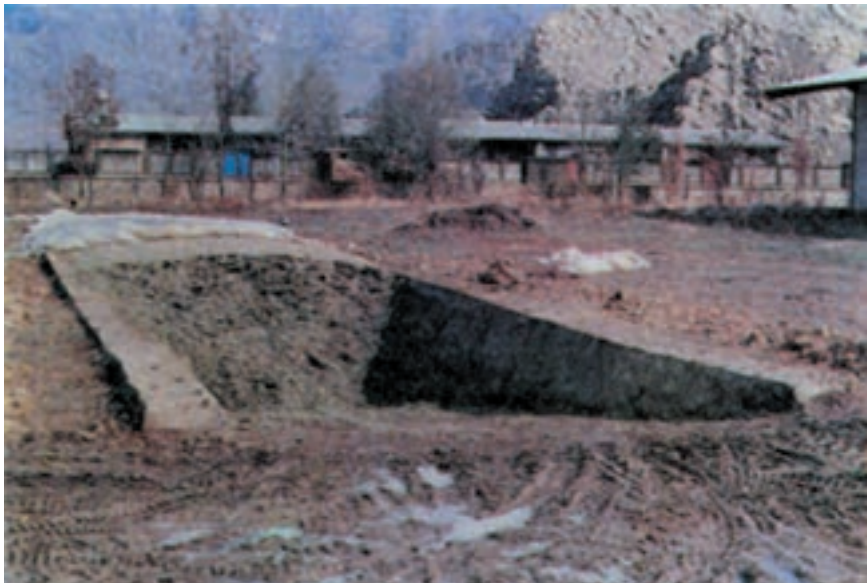
شکل ۱-۳ سیلوی زمینی مدرن

قسمتهای لازم در یک سیستم بسته عبارتند از: اصطبل گاوها، بهار بند، انبار خوراک، سیلو، محل نگهداری گوساله‌های بزرگ، محل نگهداری گاوهای بیمار، زایشگاه، محل نگهداری گوساله‌های شیرخوار، محل نگهداری گاو نر و اتاق شیردوشی.