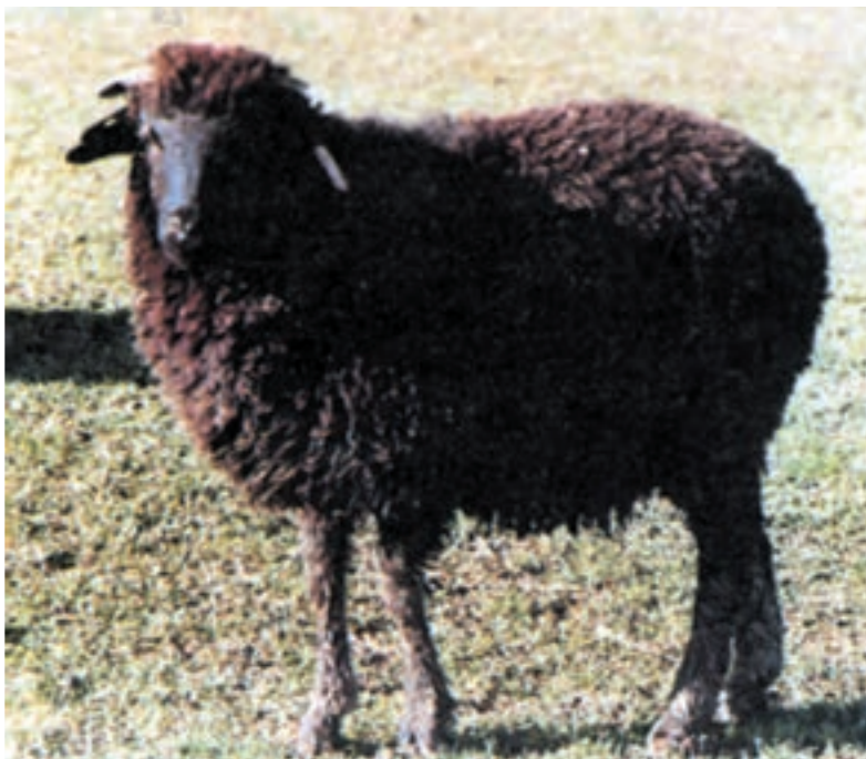
شکل ۵-۴ گوسفند زل

گوسفند قزل دارای شیری با کیفیت مطلوب می‌باشد پنی‌ر معروف تبریز از شیر این نژاد تهیه می‌گردد.