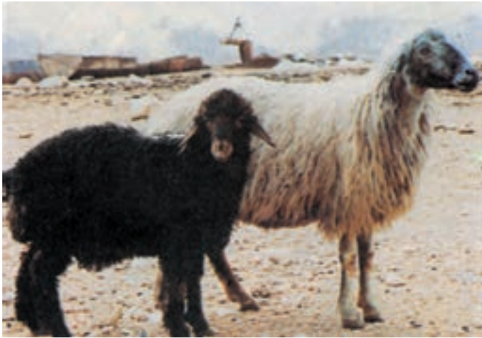
شکل ۳-۴ گوسفند قره گل

نژاد بلوچی نیز یکی از نژادهای مهم پشمی ایران است با وجود کوچکی جثه بسیار مقاوم بوده و قدرت راهپیمایی مسافات طولانی را دارا می‌باشد.