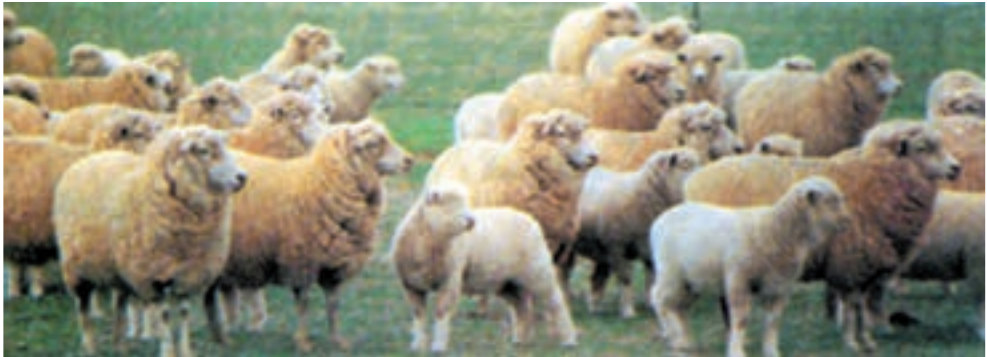
شکل ۸-۴ گوسفند مریوس