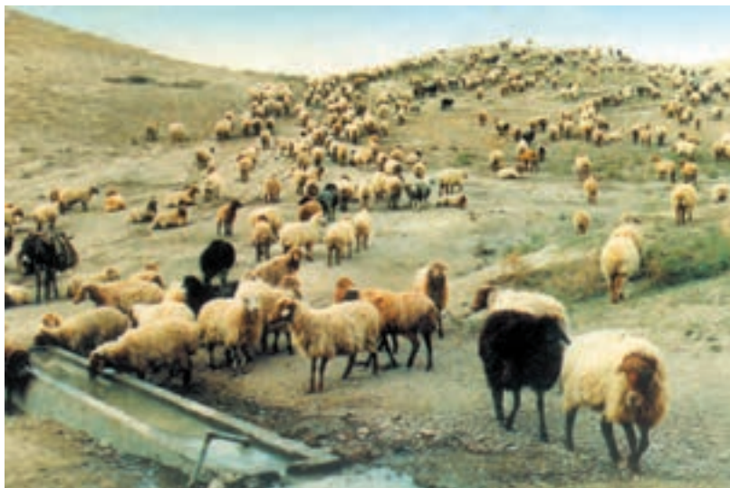
شکل ۱-۴ چرا در مرتع

صورت است که کل مرتع به صورت یک مجموعه واحد در نظر گرفته شده و دامها به طور آزاد با گردش در نواحی مختلف چرا می‌نمایند. از آنجایی که گوسفند در موقع چرا علوفه را از ته می‌کند بهتر است ابتدا مرتع به وسیله گاو چرانیده شده سپس در اختیار گوسفندان قرار بگیرد.