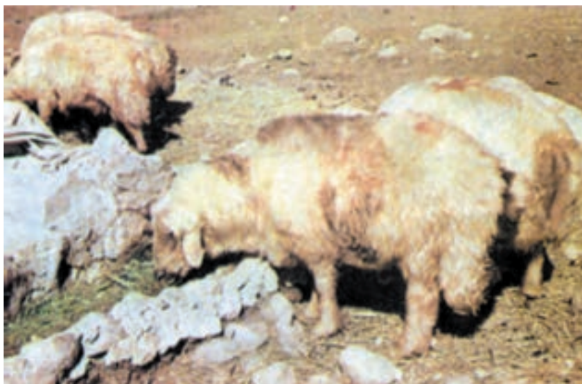
شکل ۶-۴ گوسفند لری