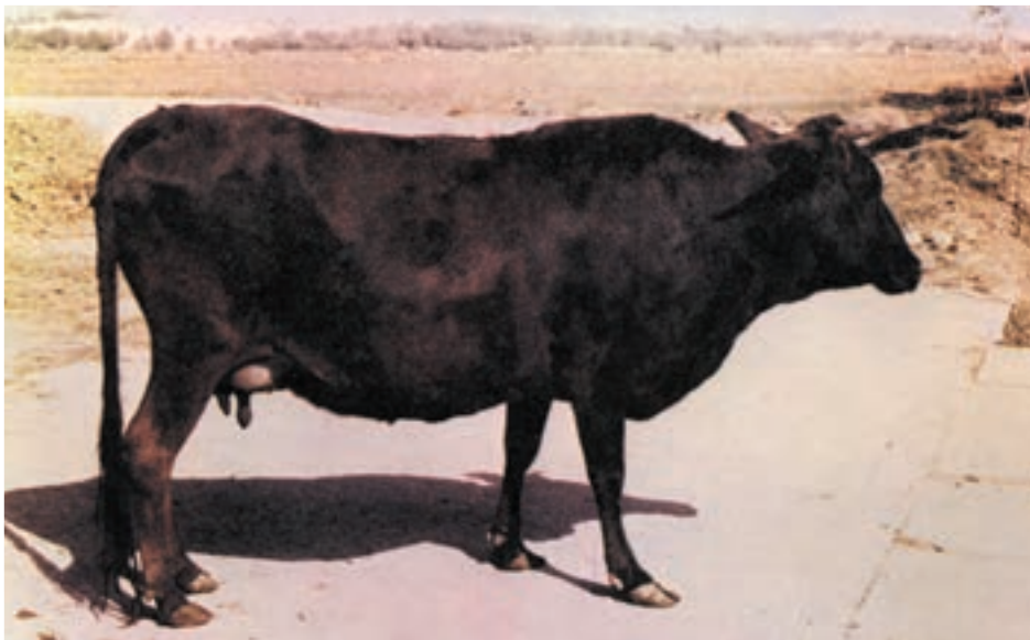
شکل ۱۹-۳ نژاد بومی گلپایگانی

۲- نژاد گلپایگانی: موطن اصلی آن شهرستان گلپایگان می باشد. رنگ این نژاد متفاوت بوده و عمدتاً به رنگهای سیاه، قرمز بور و گاهی ابلق سیاه و سفید دیده می شود میزان تولید شیر این نژاد کمتر از نژاد سرابی می باشد.