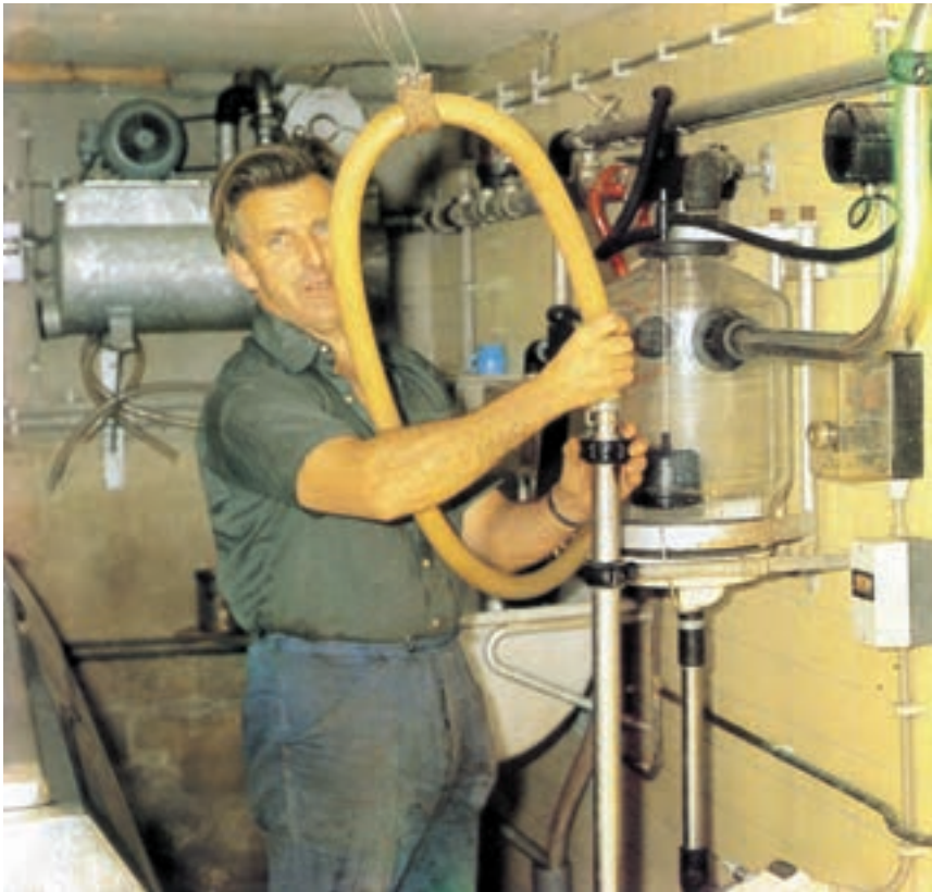
شکل ۹-۳ اطاق جمع آوری شیر