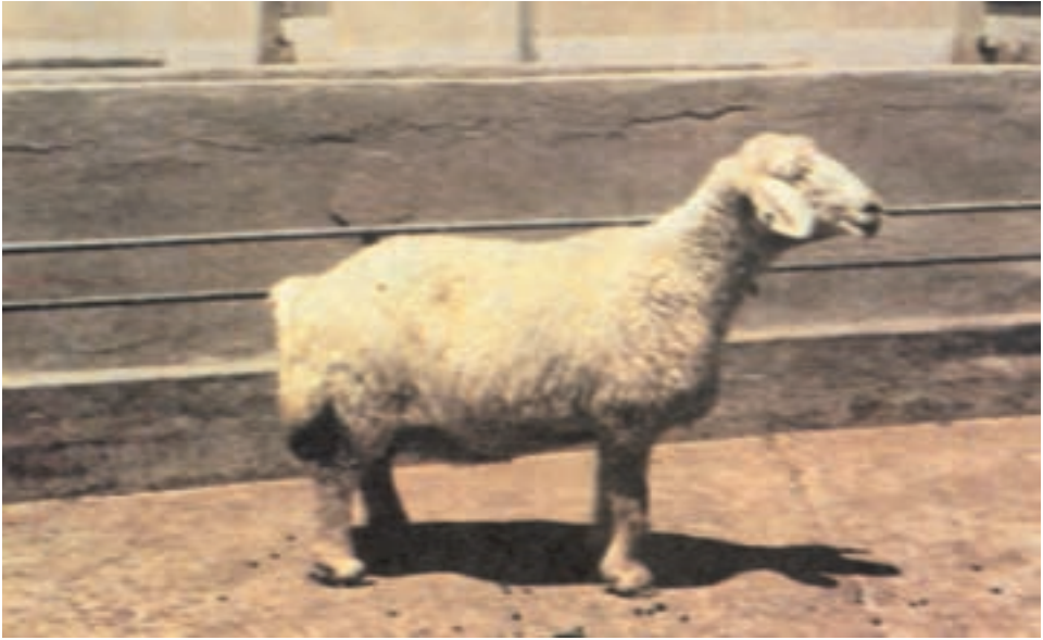
شکل ۷-۴ گوسفند پشمی