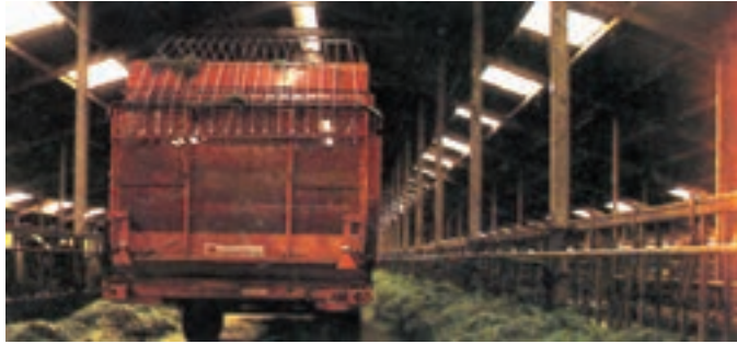
شکل ۶-۳ نمای پنجره‌های سقفی در اصطبل

۲- اصطبل باز: اینگونه اصطبلها از چهار طرف کاملاً باز بوده و فقط سایبانی به منظور استراحت دامها دارند.