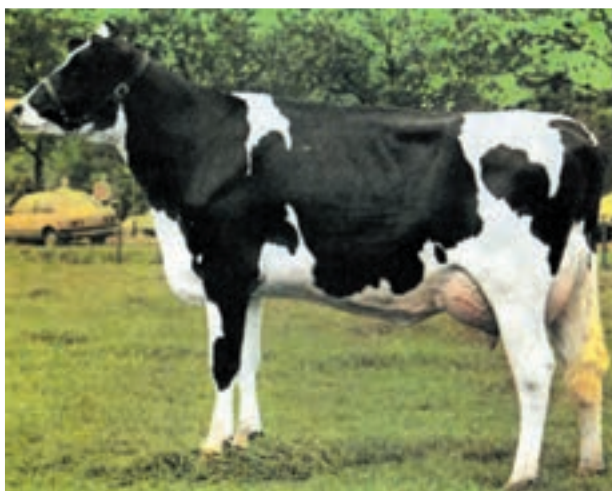
شکل ۱۲-۳ تیپ گاو شیری خوب

از دوشش بزرگ و بعد از دوشش چروکیده و کوچک می‌گردد. در صورتی که در پستان با بافت