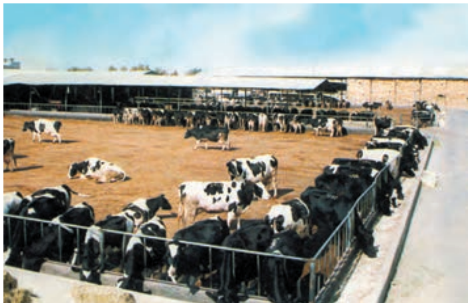
شکل ۳-۱۱ نمای یک اصطبل نیمه باز