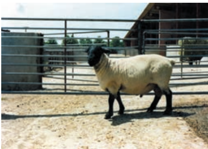
شکل ۲-۴ نژاد سافولک

۲- نژادهای پشمی مانند گوسفندان بلوچی - کلکو - ماکوئی