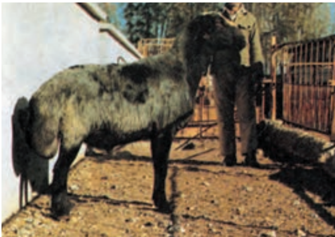
شکل ۴-۴ گوسفند شال