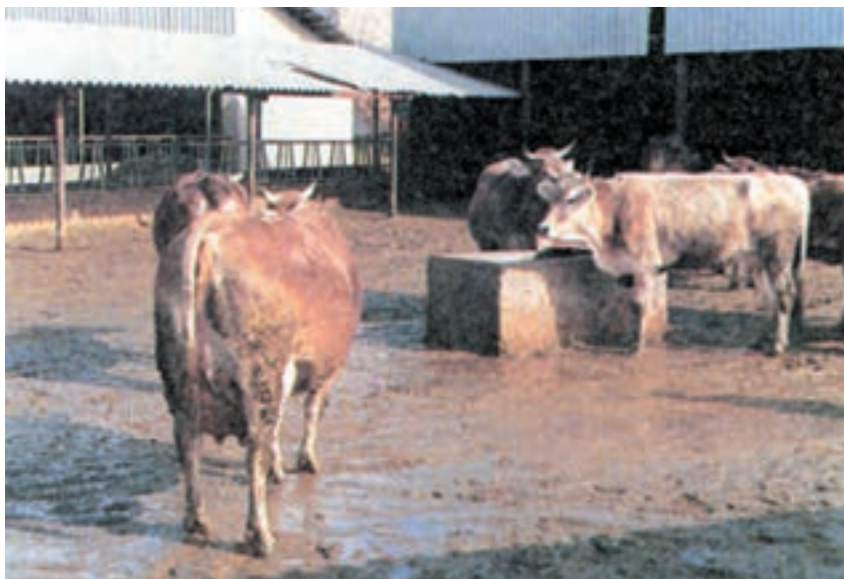
شکل ۳-۵ نمای یک اصطبل نیمه باز با آبشخور آن

به محل آب خوردن حیوان، آبشخور می‌گویند انواع آبشخورهای مورد استفاده در گاو‌داریها عبارتند از آبشخور معمولی و آبشخور اتوماتیک. آبشخورهای اتوماتیک با توجه به صرفه‌جویی عمده‌ای که در مصرف آب به‌وجود می‌آورند امروزه در گاو‌داریهای مدرن زیاد مورد استفاده قرار می‌گیرند.