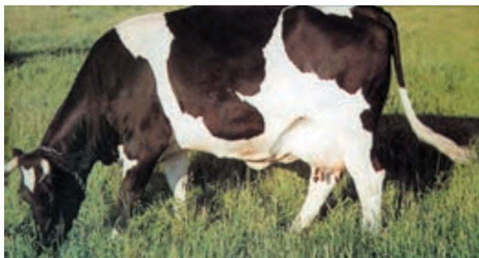
شکل ۱۴-۳ گاوهای هلشتاین

۱— نژاد هلشتاین: مرکز اولیه پرورش آن استان فرسیند در کشور هلند می‌باشد. از پرشیرترین نژادهای دنیا به‌شمار می‌آید و در عین حال به دلیل جثه بزرگش از نظر تولید گوشت نیز مناسب می‌باشد. رنگ در این نژاد ابلق سیاه و سفید است. گاو نژاد هلشتاین دارای سر ظریف، سینه‌ای فراخ، شاخی کوچک و پستانهایی شکیل می‌باشد. با توجه به مقاومت نسبی و تحمل شرایط گوناگون آب و هوایی آن هم اکنون در کشورهای مختلف جهان نیز نژادهایی از نژاد هلشتاین به‌دست آورده‌اند که میزان تولید شیر آنها در یک دوره شیردهی (۳۰۵ روز) حتی به حدود ده‌هزار لیتر می‌رسد.