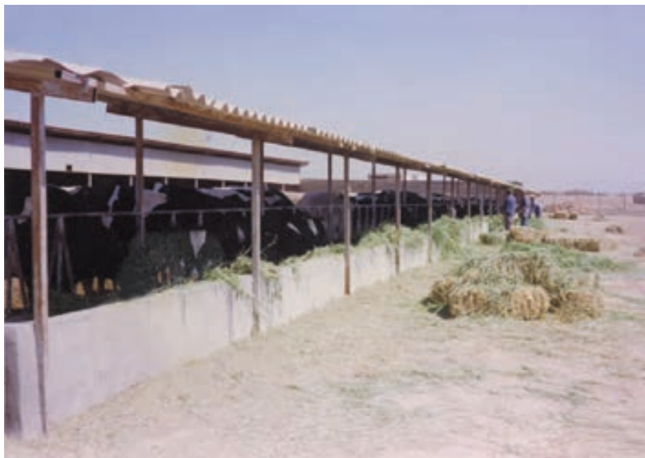
شکل ۳-۱۰ نمای آخور در یک اصطبل نیمه باز