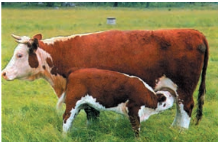
شکل ۱۷-۳ نژاد هر فورده

۴- نژاد هر فورده: مرکز اولیه پرورش آن کشور انگلستان است. یکی از بهترین نژادهای گاو گوشتی دنیا به شمار می‌آید. این نژاد به رنگ ابلق قرمز و سفید بوده و انتهای دست و پا سفید و پوزه روشنی دارد که به عنوان علامت مشخصه آن بکار می‌رود. نژاد هر فورده دارای قدرت اصلاح‌کنندگی خوبی بوده و خیلی سریع خود را به تغییرات آب و هوایی عادت می‌دهد.