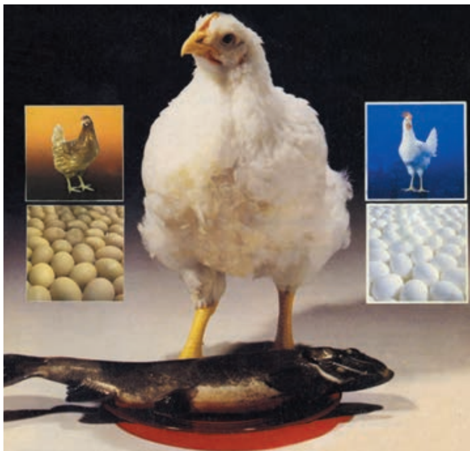
شکل ۴-۵ از تصویر چه مطالبی را می‌توانید درک کنید، به تفاوت فرم و قالب بدن مرغ گوشتی با تخمگذار بنگرید.

نسبت به بیماریها، فرم بدن، تلفات کم و توقف در تخمگذاری (تولک رفتن ...) مدنظر قرار گیرد.