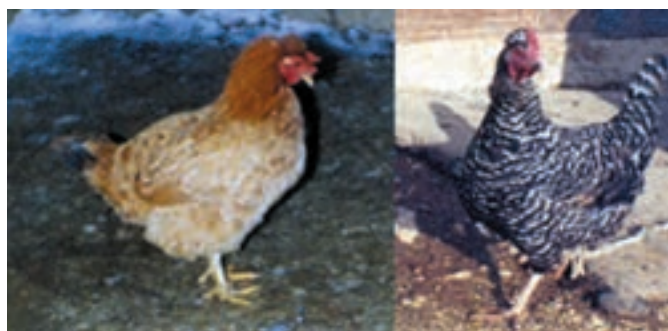
شکل ۷-۵ دو نمونه از مرغان دو بهره بومی روستایی ایران

با چه فاکتورهایی می‌توان نژادها را از همدیگر متمایز ساخت: در این مورد می‌توان گفت نوع، فرم و قالب بدن، تفاوت در شکل تاج، رنگ پر، شکل و اندازه ریش از جمله فاکتورهایی هستند که به‌وسیله آنها می‌توانید تفاوت‌های ظاهری بین نژادهای مختلف را دریابید. برای فهم این مطلب مجدداً به تصاویر نژادهای مرغان نگاه کنید و اگر می‌توانید با استفاده از تصاویر نژادهای گوشتی، تخمگذار و دو بهره را مشخص کنید. به‌عنوان مثال لگهورن تخمگذار، براهما گوشتی، و پلیموت روک دو بهره می‌باشند.