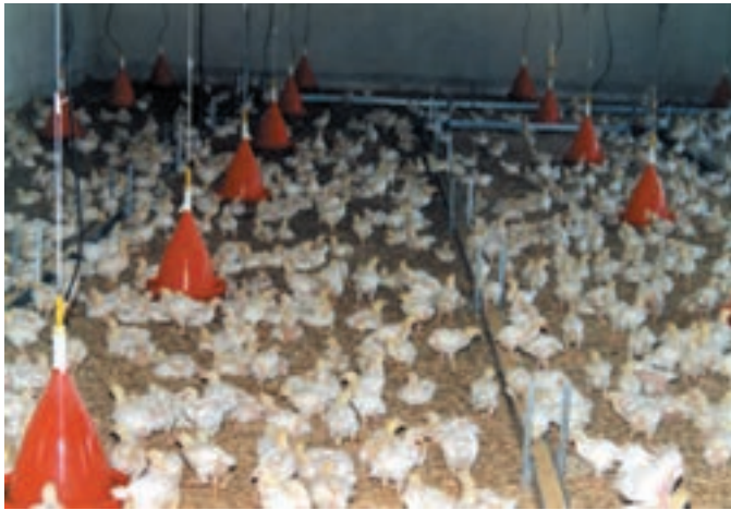
شکل ۱-۵ پرورش جوجه گوشتی در روی بستر

در پرورش طیور تخمگذار دو دوره پرورشی دیده می‌شود، دوره اول به نام پرورش پولت (Pullet) که در این دوره جوجه‌های یکروزه را تا حدود سه ماهگی روی بستر معمولی و یا کف توری نگهداری می‌کنند و واکسیناسیون واکسنهای ضروری منطقه در این دوره انجام می‌گیرد، پس از اتمام این دوره پرورش مرغان تخمگذار شروع می‌شود که از سه ماهگی تا آخر دوره تخمگذاری ادامه دارد، مرغان تخمگذار روی بستر معمولی با لانه‌های تخمگذاری و یا با سیستم پرورش در قفس نگهداری می‌گردند.