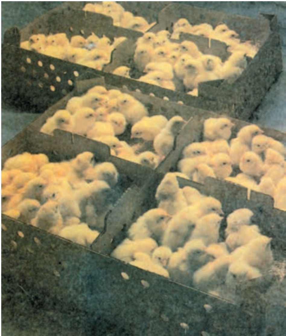
شکل ۱۰-۵ جوجه‌های حاصل از جوجه‌کشی مصنوعی (جوجه یکروزه)

جوجه‌کشی مصنوعی به مرغ کرج ندارد و در هر فصل از سال می‌توان عملیات جوجه‌کشی را انجام داد و در هر نوبت جوجه‌کشی با در نظر گرفتن ظرفیت دستگاه از تعداد بیشتری تخم مرغ نسبت به جوجه‌کشی طبیعی استفاده می‌گردد، ضمناً کنترل بیماریها، کنترل فاکتورهای حرارت، رطوبت و عمل چرخش تخم مرغها با دقت بیشتری صورت می‌گیرد، موارد ذکر شده از مزایا و برتریهای جوجه‌کشی مصنوعی می‌باشد ولی به این نکته نیز باید توجه داشت که در این نوع جوجه‌کشی آلودگی یک تخم مرغ به راحتی سبب آلودگی همه تخم مرغهای موجود در ماشین می‌گردد. چرا؟