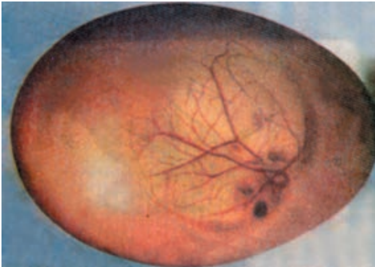
شکل ۸ - ۵ تخم مرغ نطفه‌داری که جنین درون آن در حال رشد می‌باشد.

برای این که از تخم مرغ نطفه‌دار پس از طی مدت زمانی جوجه به دنیا بیاید، مرغ کرج اعمالی را به طور غریزی بر روی آن انجام می‌دهد یعنی با حرارت بدن خود حرارت لازم برای رشد نطفه و جنین داخل تخم مرغ را فراهم و با رطوبت بدن خود مانع از تبخیر مایعات داخل تخم مرغ می‌گردد و همچنین مرغ کرج هر چند ساعت یکبار تخم مرغها را این طرف و آن طرف می‌چرخاند که این عمل مانع از حرکت جنین به طرف سطح و جلوگیری از توقف رشد آن خواهد شد. زمانی که بجای خوردن دانه و آب از روی تخم مرغها بلند می‌شود عمل تهویه جهت رشد جنین صورت می‌گیرد.