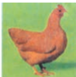
پلیموت روک نخودی