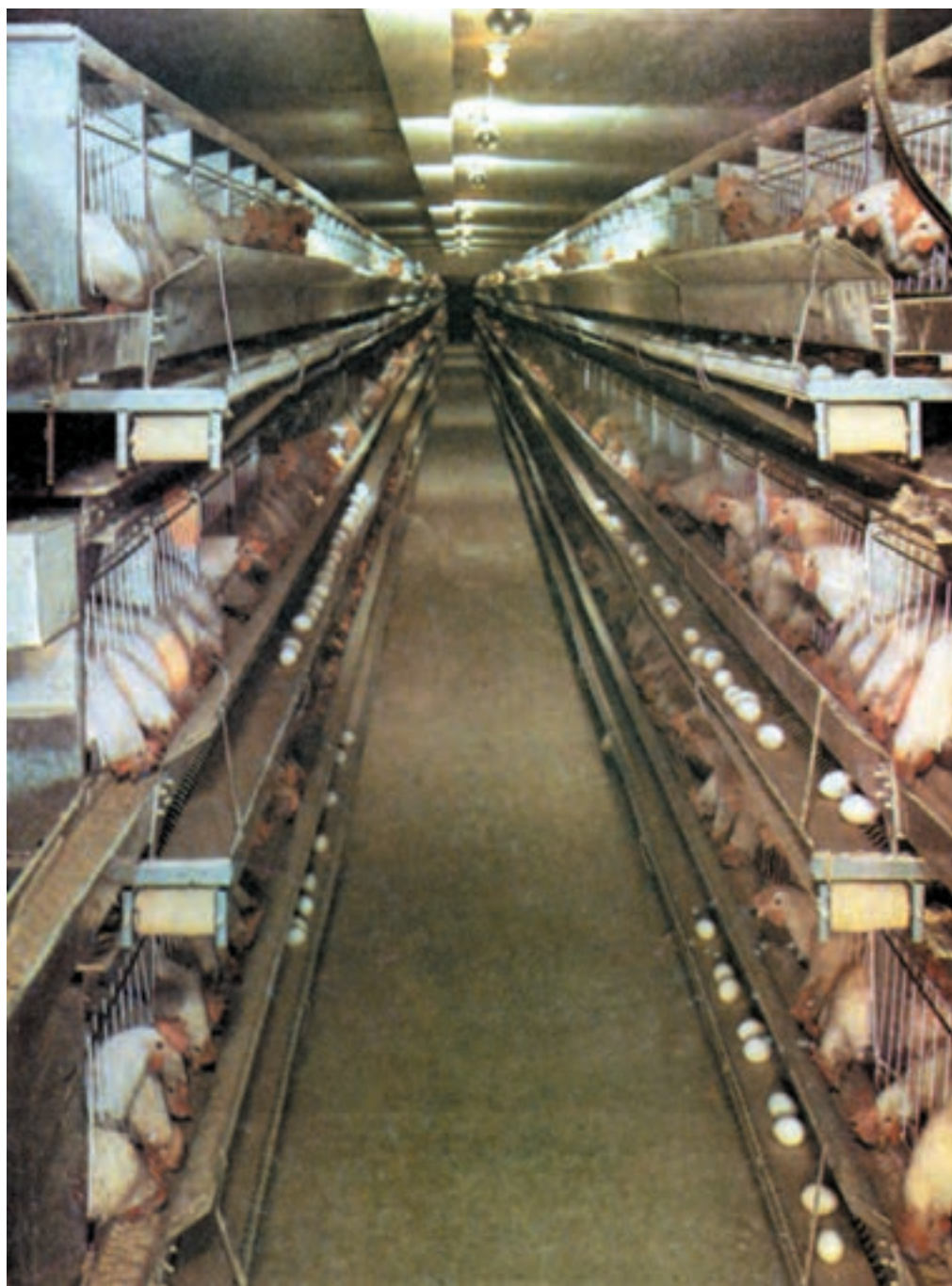
شکل ۳-۵ پرورش طیور در قفس