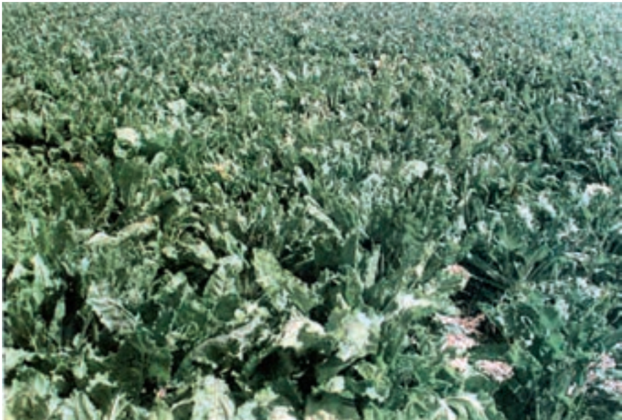
شکل ۳-۳- زمان برداشت مزرعه‌ی چغندر قند

چغندر قند جزو آن دسته از محصولات کشاورزی است که کیفیت آن دقیقاً قابل اندازه‌گیری می‌باشد. تعیین بهترین زمان رسیدن چغندر قند و برداشت آن در عملکرد و استحصال شکر سفید تأثیر فراوانی دارد و هزینه‌های تولید را در کارخانه کاهش می‌دهد. رسیدگی فیزیولوژیکی در چغندر قند وجود ندارد بلکه، رسیدگی تکنولوژیکی ۱ مورد نظر است. زمان رسیدن چغندر قند تابع عوامل زیادی است که مهم‌ترین آن‌ها نوع بذر، طول فصل یا سال زراعی، دما، حرارت محیط (بخصوص در آخر دوره‌ی رشد)، میزان مصرف کودهای شیمیایی (خصوصاً کودهای ازته) و عملیات داشت می‌باشد. به استثنای خوزستان در بقیه‌ی نقاط کشورمان با توجه به تاریخ کاشت و عوامل مؤثر دیگر، زمان رسیدگی تکنولوژیکی چغندر قند از اواسط مهرماه تا اواخر آذر متفاوت است. تا زمانی که دمای هوا به کمتر از 4^{\circ}\text{C} نرسیده باشد، چغندر قند به ذخیره سازی قند و افزایش وزن خود، ادامه خواهد داد. علائم ظاهری رسیدن چغندر قند با زرد شدن برگ‌های مسن، کُند شدن رشد برگ‌های مرکزی بوته نمایان می‌شود (شکل ۳-۳).