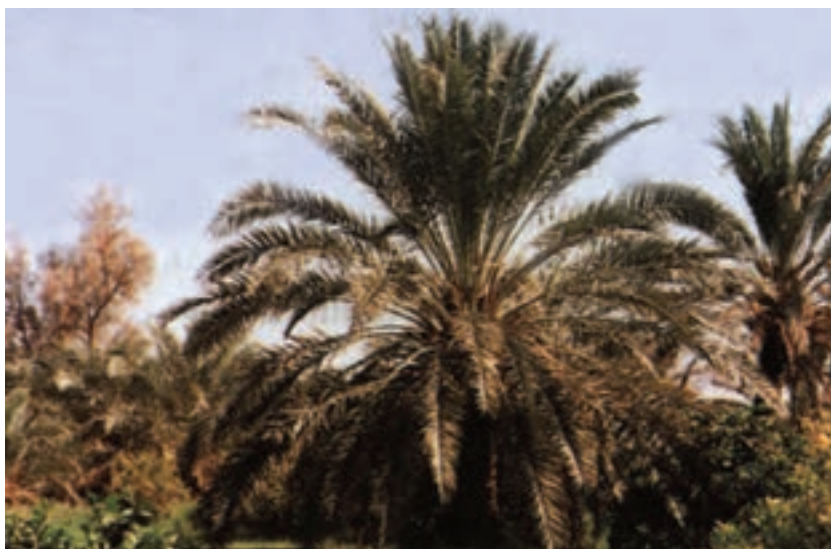
شکل ۸- ۷

درجه حرارت ۷ درجه سانتی‌گراد برگ‌ها را از بین می‌برد. اماتنه و جوانه‌ی انتهایی تا ۱۵ درجه سانتی‌گراد را تحمل می‌کنند. برای رشد مداوم، خرما نیاز به حداقل ۱۰ درجه حرارت دارد.