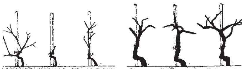
شکل ۶-۷- فرم هرس پاچراغی

فرم پاچراغی: برای تربیت مو به فرم پاچراغی، در سال اول نهال از نزدیکی سطح زمین به طوری که فقط یک جوانه روی آن باقی بماند، هرس می‌شود. این جوانه در طول فصل رشد، تبدیل به شاخه شده و تنه اصلی درخت را به وجود می‌آورد. در سال دوم و به هنگام هرس این شاخه از ارتفاع ۸۰-۷۰ سانتی متری قطع می‌شود. همچنین در انتهای این شاخه ۲-۴ جوانه نگهداری و بقیه جوانه‌ها حذف می‌شوند. در سال سوم با قطع انتهای شاخه‌ی اصلی، ارتفاع بوته‌ی مو ثابت نگاه داشته می‌شود و شاخه‌های فرعی نیز به نحوی که فقط ۲-۳ جوانه روی آن‌ها باقی بماند، هرس می‌شوند. از این به بعد تاج درخت فرم یافته است ولی باید همه ساله با هرس مداوم از رشد طولی و انبوه شدن تاج آن جلوگیری کرد. شکل (۶-۷) مراحل دستیابی به این فرم را نشان می‌دهد.