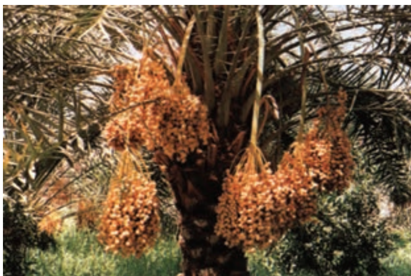
شکل ۹- ۷