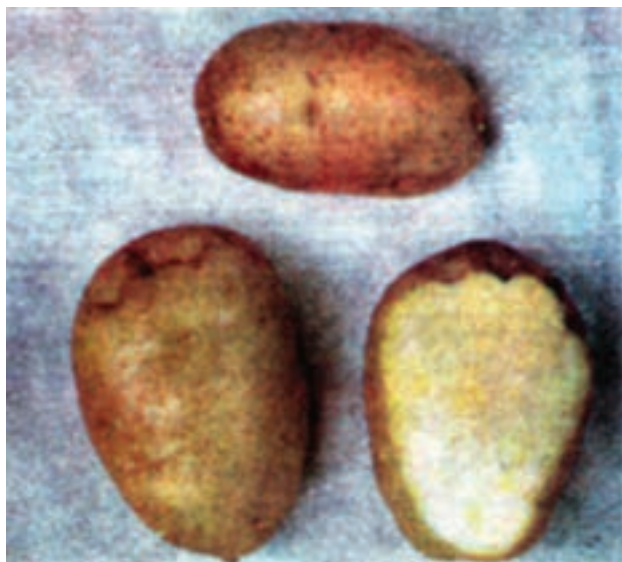
شکل ۱۱-۳- جوانه زنی غده‌ی سیب زمینی