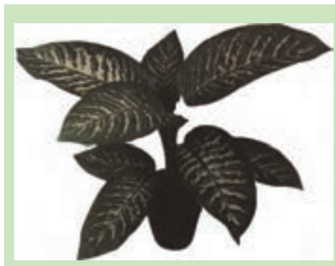
شکل ۹-۱- دیفن باخیا آمونتا

دیفن باخیا (شکل ۹-۱): دارای برگ‌های متوسط سبز رنگ آراسته به لکه‌های دراز سفید، کرم و زرد کم‌رنگ که از هر دو طرف برگ دیده می‌شود.