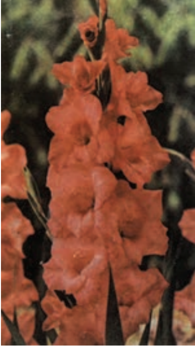
شکل ۹-۵- رقم سانسوسی

رقم آلفرد نوبل ۲ : در این رقم کنار گل‌ها صورتی و گلوی گل سفید رنگ است. گل‌ها درشت و کمی جدا از هم بر روی ساقه قرار می‌گیرند؛ پیاز آن کاملاً مقاوم و مدت دوام گل بریده‌ی آن در آب، زیاد است (شکل ۹-۶).