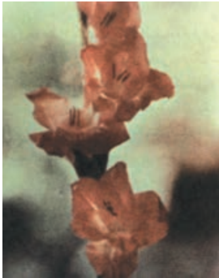
شکل ۹-۶- رقم آلفرد نوبل