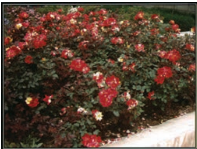
رز هفت رنگ