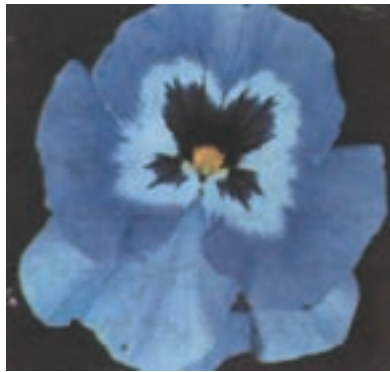
شکل ۷-۹- بنفشه فرنگی

گیاهی است از خانواده‌ی (Violaceae) علفی، از نظر گیاه‌شناسی چند ساله ولی در گل‌کاری