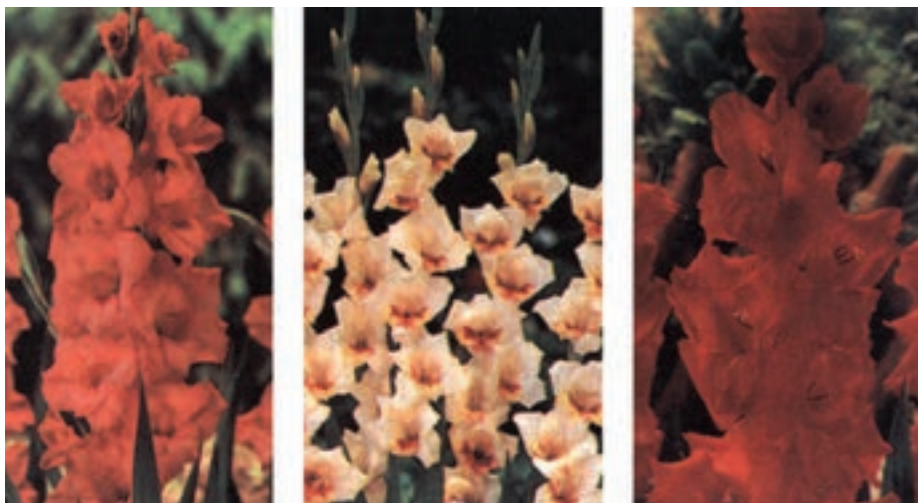
شکل ۲-۹- ارقامی از گلایل