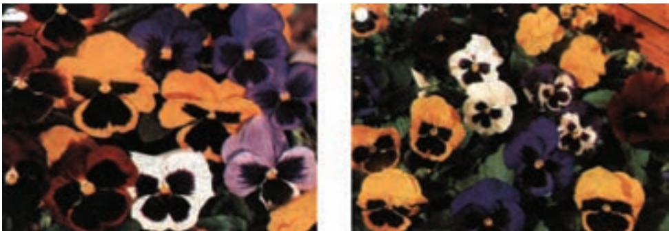
شکل ۸-۹- ارقامی از بنفشه سه رنگ (بنفشه فرنگی)

مهم‌ترین گونه بنفشه؛ بنفشه‌ی سه رنگ ۱ است که ارقام مختلفی دارد و از آن جمله بنفشه‌ی سه رنگ گل درشت پیش رس است که به اسم بنفشه گل درشت پاریسی معروف است. دارای زمینه‌ای به رنگ‌های قرمز؛ سفید؛ زرد و مسی بوده، روی آن لکه‌های بزرگ و پهن قهوه‌ای یا بنفش و... دیده می‌شود (شکل ۸-۹).