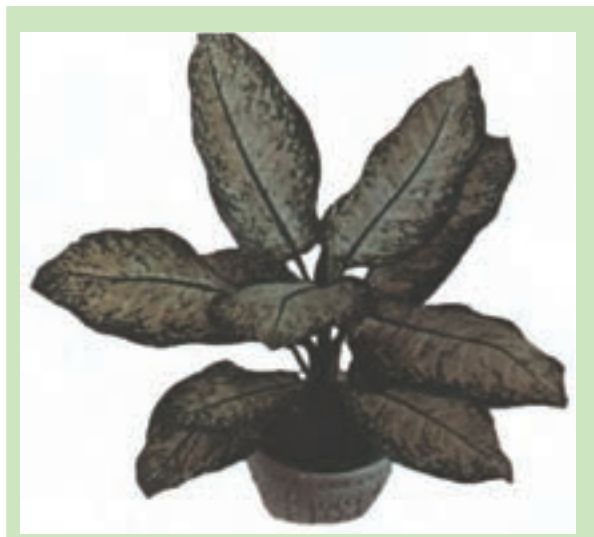
شکل ۹-۱۱- دیفن باخیا رژینا

دیفن باخیا رژینا ۱ (شکل ۹-۱۱): دارای قد نسبتاً کوتاه، ساقه‌ی ضخیم که بر روی برگ‌های سفید مایل به سبز آن رگه‌هایی به رنگ سبز کمرنگ با حاشیه‌ی سبز تیره دیده می‌شود.