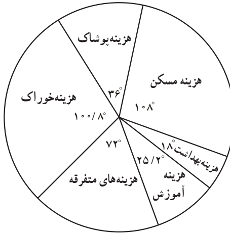
شکل ۱- نمودار دایره‌ای هزینه خانوارها

باید توجه نمود که جمع درجه‌ها بایستی 360^\circ باشد.