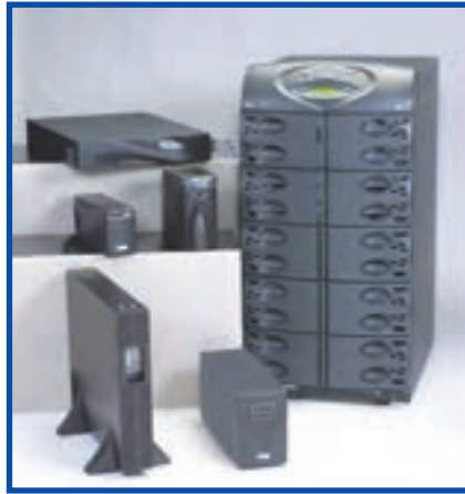
شکل ۶-۷ دستگاه‌های مختلف برای تأمین برق بی‌وقفه