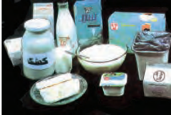
شکل ۷-۱- گروه شیر و فرآورده‌های آن

پنیر، کشک، بستنی و دوغ است (شکل ۷-۱). این مواد می‌توانند نیاز بدن به اغلب مواد مغذی به‌ویژه پروتئین، کلسیم، ریوفلاوین و روی را تأمین کنند. اگر چه لبنیات از بهترین منابع پروتئین و کلسیم هستند، ولی از نظر آهن، ویتامین C و ویتامین D فقیر می‌باشند.