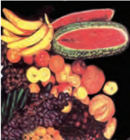
شکل ۳-۷- گروه میوه‌ها

روده‌های حساس هستند و معمولاً یبوست هم دارند می‌توانند روزانه با مصرف مقدار کمی میوه بین غذا یا همراه غذا دفع راحتی داشته باشند. مصرف زیاد میوه‌ها باعث نفخ شکم، اختلالات روده‌ای و اسهال می‌شود.