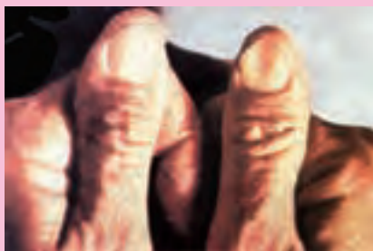
شکل ۱-۶- قاشقی شدن ناخن ها در کم خونی فقر آهن