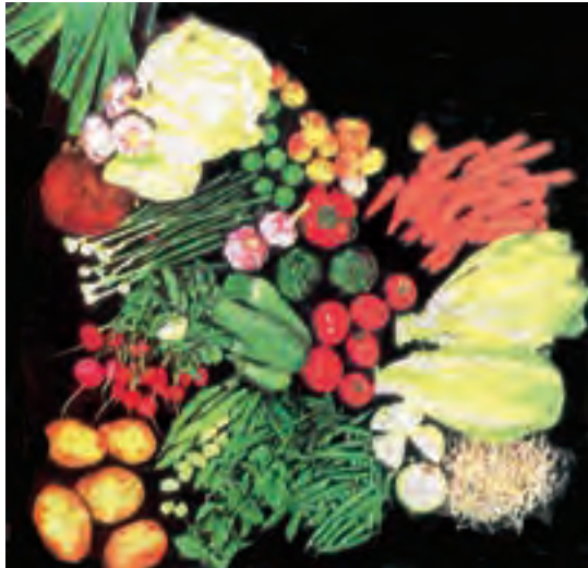
شکل ۴-۷- گروه سبزی‌ها

سبزی‌ها به علت داشتن آب زیاد (حدود ۷۵ تا ۹۰ درصد) معمولاً کالری کمتری دارند. در ترکیب سبزی‌ها مقداری سلولز وجود دارد که برای انسان قابل هضم و جذب نیست و فقط باعث افزایش حجم مواد غذایی مصرفی می‌شود و در نتیجه به تخلیه روده‌ها و دفع مواد زائد کمک می‌نماید.