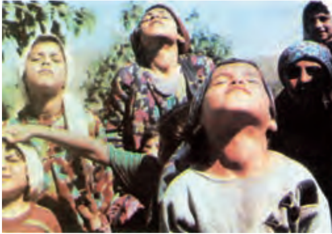
شکل ۲-۶ - شیوع بیماری گواتر در یک منطقه حاکی از کمبود ید در رژیم غذایی است.