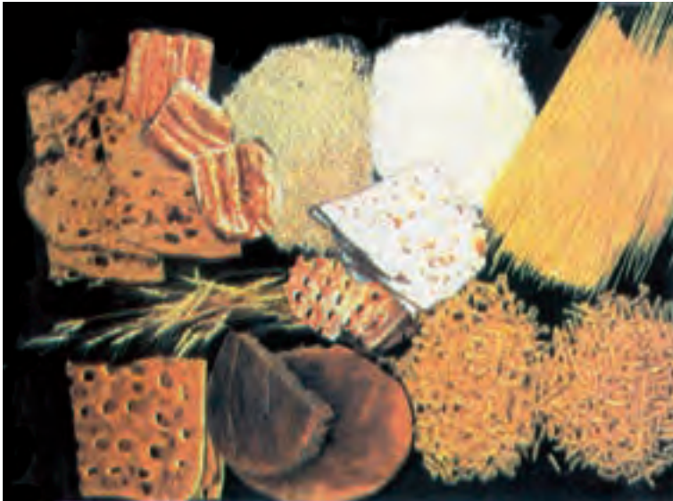
شکل ۵-۷- گروه نان و غلات

آرد می‌باشند. این مواد می‌توانند مقداری از نیاز بدن به انرژی، ویتامین‌های نیاسین، تیامین و برخی از مواد معدنی مانند آهن و روی و همین‌طور فیبر غذایی را تأمین کنند.