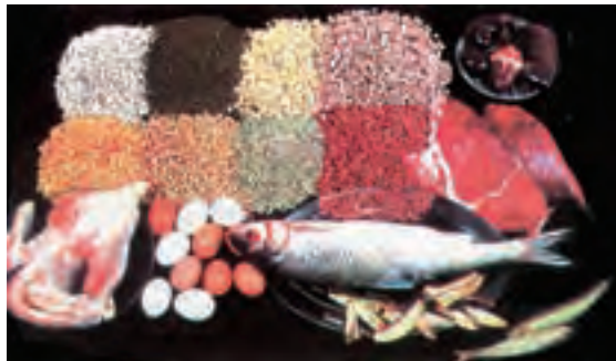
شکل ۷-۲- گروه گوشت و حبوبات

مواد غذایی که در گروه گوشت و حبوبات قرار می‌گیرند شامل انواع گوشت قرمز و سفید مثل گوشت گاو، گوسفند، مرغ، ماهی، دل، جگر و تخم مرغ و حبوبات (انواع لوبیاهای، نخود، عدس، ماش و لپه) و مغزها مثل گردو، پسته و بادام زمینی (شکل ۷-۲). این مواد می‌توانند قسمتی از نیاز انسان به پروتئین، آهن، ویتامین‌های گروه B (به‌خصوص تیامین، نیاسین، ریوفلاوین، ویتامین B ۱۲ ) و روی را تأمین نمایند.