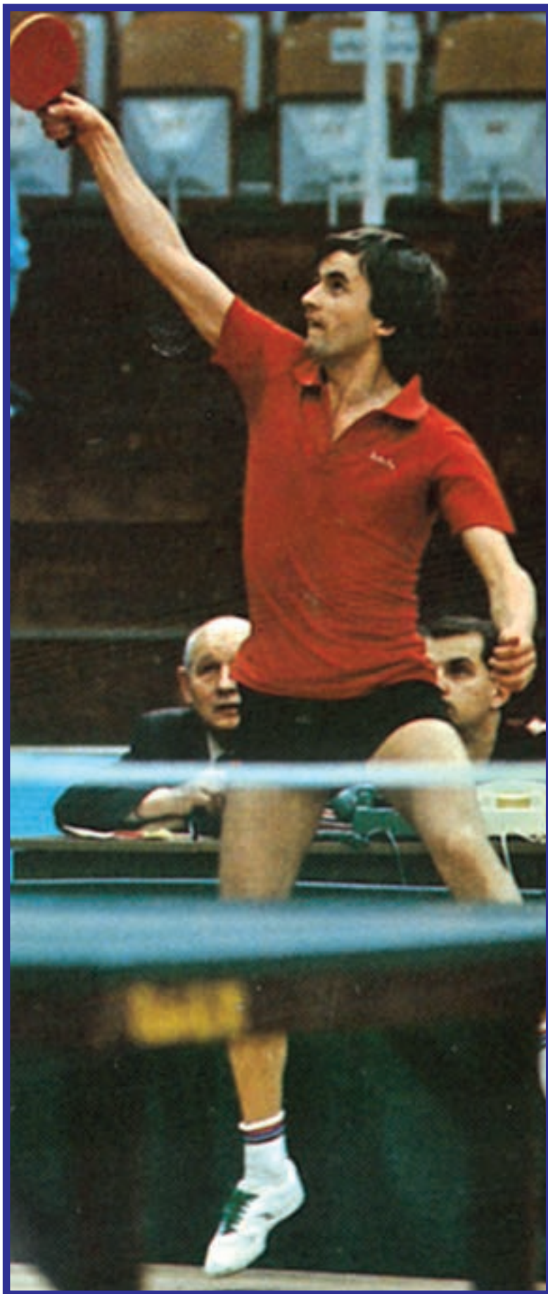
یکی از قهرمانان اروپا در حال زدن ضربه‌ی پاس بلند