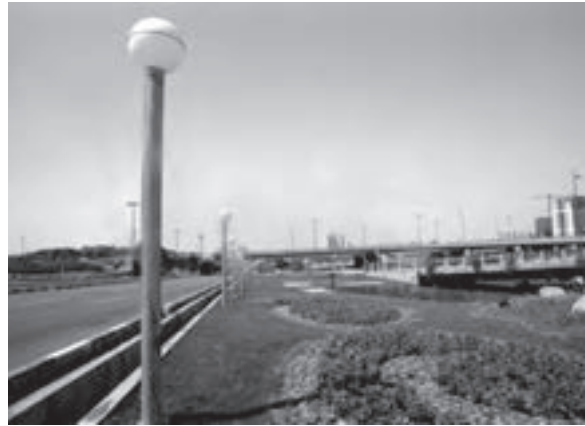
تصویر ۶-۲۱_ لنز واید