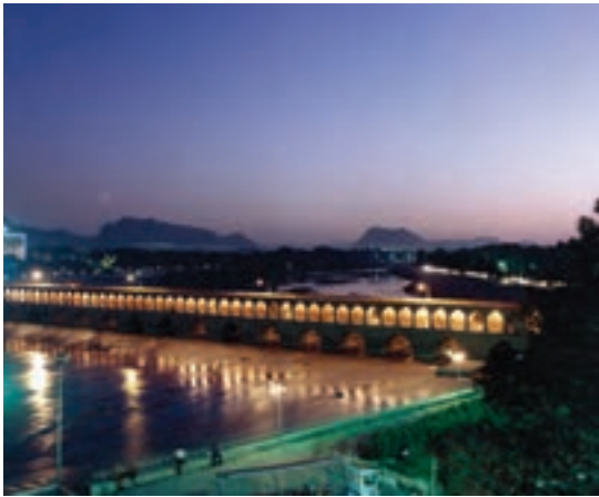
تصویر ۱۰-۶- لنز نرمال، سی و سه پل، اصفهان