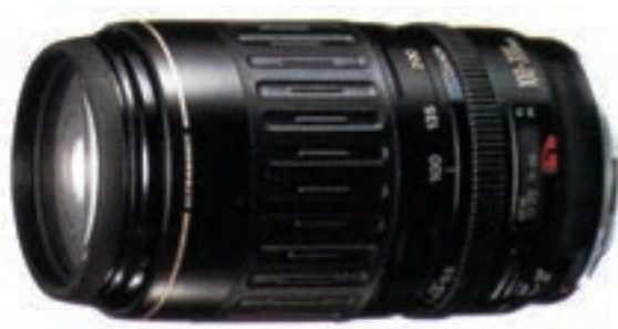
تصویر ۱۲-۶- لنز زوم با مشخصات، ۱۰۰-۳۰۰ f.4.5-5.6