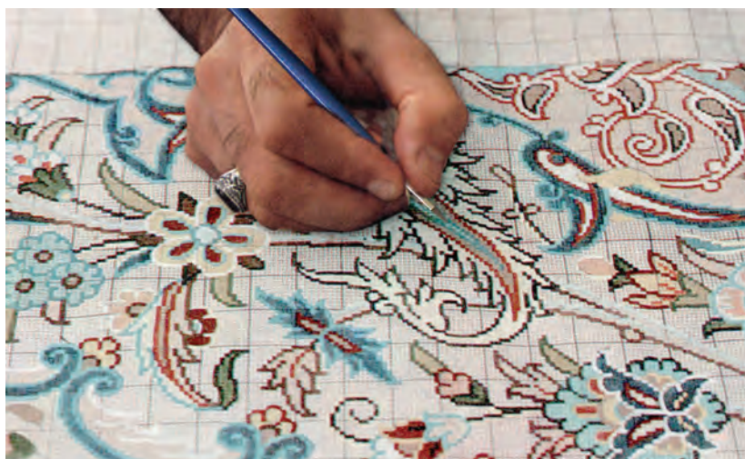
شکل ۳-۴- دورگیری نقوش با نقطه‌های تیره و روشن

برای نقطه‌زنی از قلم موهایی با شماره‌های کوچک‌تری استفاده می‌شود که پهنای نوک آنها به اندازه خانه‌های شطرنجی کاغذ باشد. اندازه قلم‌مو باید متناسب با شماره رج‌شمار نقشه باشد. در برخی مناطق برای دورگیری نقوش فقط از یک خط (تیره‌تر و یا روشن‌تر) استفاده می‌شود؛ در حالی که در برخی از مناطق دیگر گاهی از سه خط با رنگ‌های مختلف برای دورگیری نقوش استفاده می‌کنند.