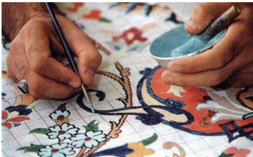
شکل ۳-۳- دورگیری (نقطه‌زنی) نقوش تیره با رنگ‌های روشن‌تر

در نقشه‌های فرش نیز برای تفکیک نقوش از زمینه‌های اطراف، گل‌ها را «دورگیری» می‌کنند. دورگیری شامل خط و یا خطوطی است که با رنگ‌های مشخص‌تری اطراف گل‌ها و نقوش ترسیم می‌شوند. معمولاً ضخامت خطوط دورگیری به اندازه یک گره (یک خانه از شطرنجی) است. در یک نقشه فرش پس از پایان رنگ‌آمیزی با روشی که به آن «نقطه‌زنی» می‌گویند، خطوط پیرامون نقوش را دورگیری می‌کنند.