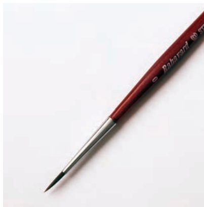
شکل ۵-۳- نوک قلم مو قبل از قطع زدن

معمولاً نوک قلم‌موهای آبرنگی تیز هستند. برای استفاده از آنها در نقطه‌زنی، باید به شکل تخت یا چهارگوش درآیند. اثر قلم‌مو روی کاغذ شطرنجی، باید صاف و یک دست باشد، به گونه‌ای که تمامی فضای داخل جداول نقشه پُر شده و حالت چهارگوش پیدا کند.