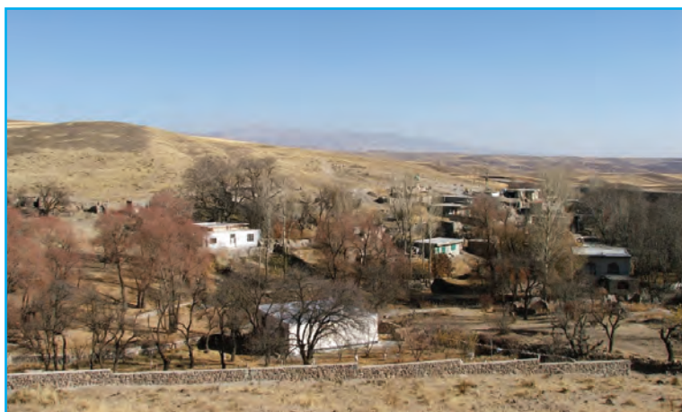
شکل ۵-۳- تصویری از روستای خشکناپ (زادگاه شهریار)

یکی از دلایل شاهکار بودن منظومه «حیدر بابا به سلام» آن است که دربر گیرنده فرهنگ عامه این دیار است. تصویر ارائه شده در این شعر، نه تنها تصویر واقعی روستای خشکناپ بلکه نمایی از تمام روستاهای ایران است. شهریار که به حق او را شهریار شعر و سخن نامیده‌اند، در قالب‌های مختلف شعر فارسی، مانند قصیده، مثنوی، غزل، قطعه، رباعی و قالب‌های آزاد شعر سروده است. از غزل‌های او می‌توان به «همای رحمت» و «آمدی جانم به قربانت» و «سهندیه شهریار» اشاره کرد.