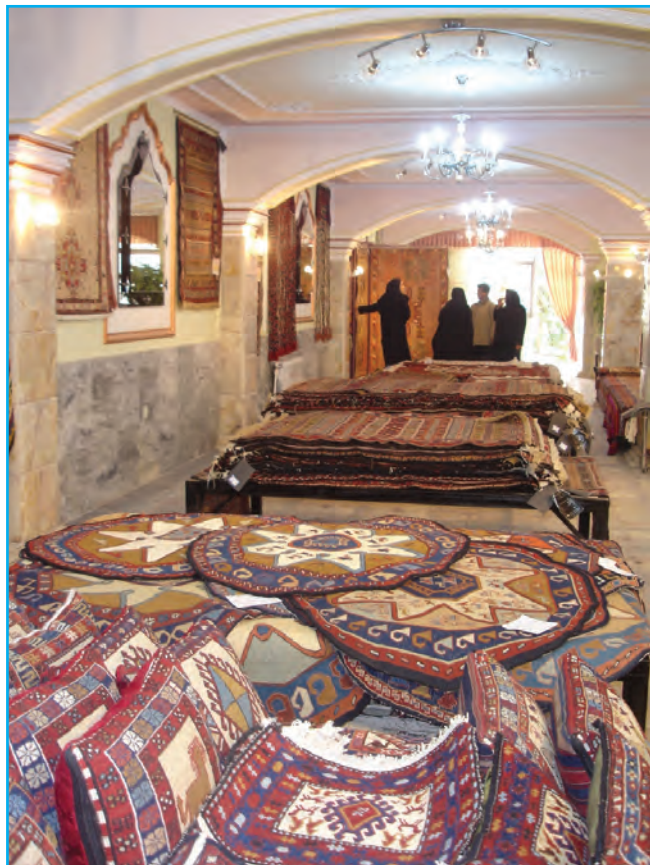
شکل ۱۲-۳- نمایشگاه و فروشگاه صنایع دستی عشایر

در این میان صنایع دستی به‌عنوان جلوه‌ای بدیع از هنرهای سنتی در آذربایجان توانسته همواره تحسین نظاره‌گران را برانگیزد.