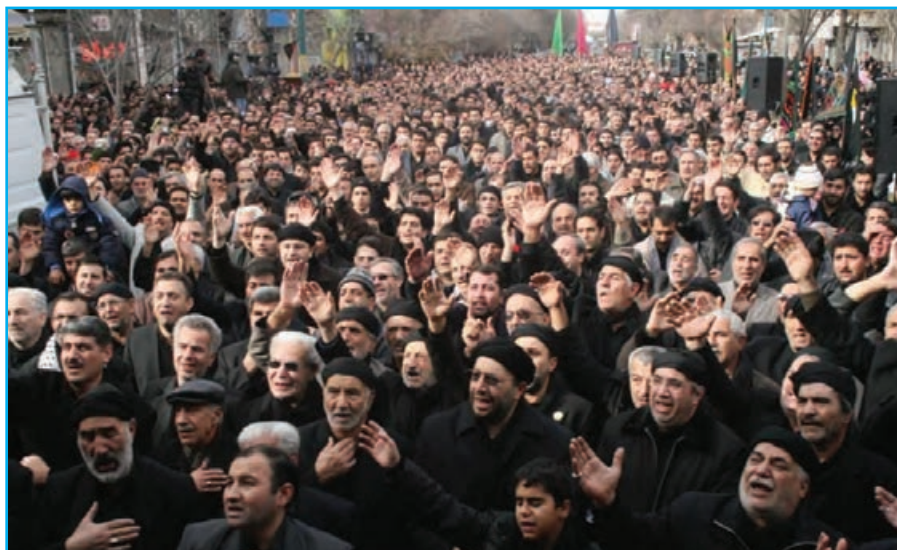
شکل ۲-۳- تصویری از مراسم سینه‌زنی در ایام محرم در استان

شبیه‌خوانی، برخی روستاییان با روشن نمودن سماور زغالی جلوی منازل خود از عزاداران حسینی پذیرایی می‌کردند. امروزه این مراسم با گذشت زمان شکل‌های متفاوتی پیدا کرده است.