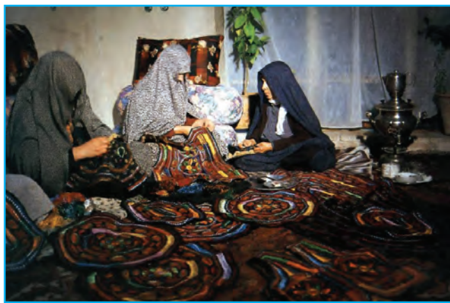
شکل ۱۳-۳- سوزن‌دوزی در ممقان