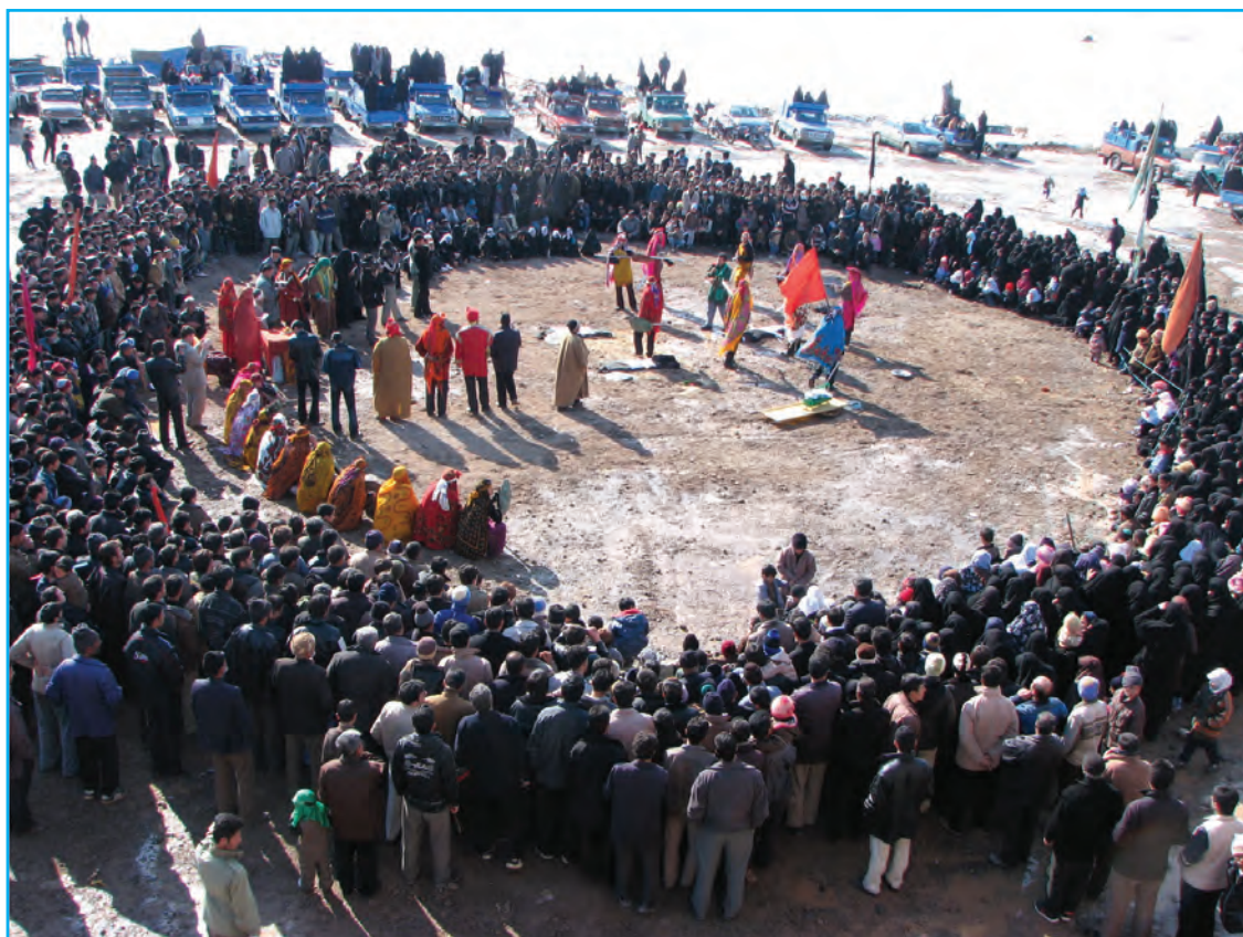
شکل ۳-۳- تصویری از مراسم شبیه‌خوانی