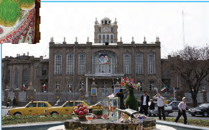
شکل ۱۰-۳- تصویری از مراسم عید نوروز در استان