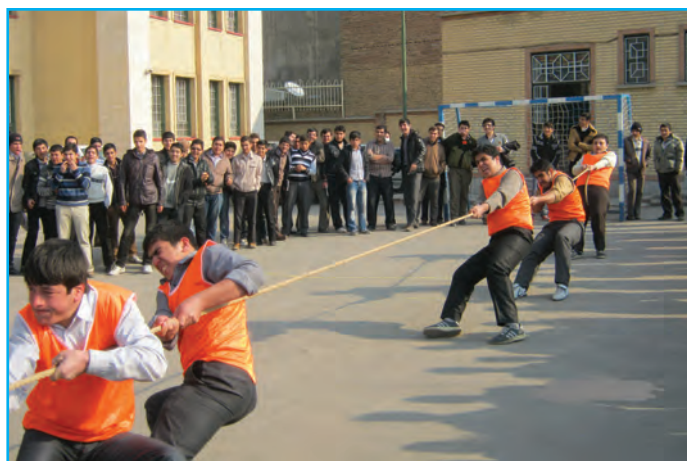
شکل ۷-۳- تصویری از مسابقه طنابکشی در میان دانش آموزان در مدارس

در گذشته در مناطق مختلف آذربایجان همچون دیگر مناطق ایران، کودکان و نوجوانان اوقات فراغت خود به صورت های گوناگون سپری می کردند که هم موجب تفریح و شادی آنان می شد و هم آنها را با فنون و مهارت های اجتماعی آشنا می ساخت. امروزه این بازی ها که پر از شادی و نشاط بوده اند، جای خود را به وسایل ارتباط جمعی به ویژه تلویزیون، بازی های رایانه ای، آتاری و ... داده است که هم آثار نامناسبی بر سلامت روح و روان کودکان و نوجوانان برجای می گذارد و هم سلامت جسمی آنان را به مخاطره می اندازند. در آذربایجان با توجه به تنوع این منطقه انواع بازی های محلی مشاهده می شود. از جمله آنها می توان به بازی: بنفشه بنده دوشتر، بش داش، طناب کشی، تیرنا ووردی، پیل دسته (کلینگ آغاج)، آرادا ووردی، گیزلین پالانج (قایم باشک) و... اشاره کرد.