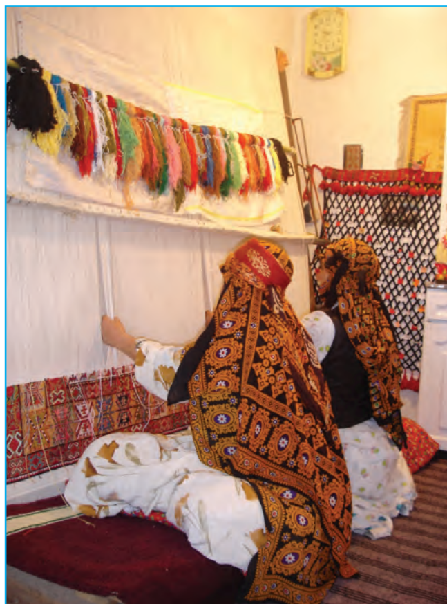
شکل ۱۱-۳- قالی‌بافی در استان

استان آذربایجان شرقی در بسیاری از زمینه‌های هنری پیشرو بوده و مکتب خاص خود را داشته است و توانسته در طول تاریخ صفحات درخشانی را از حضور فعال و مؤثر مردان و زنان هنرمند خود به نمایش بگذارد.