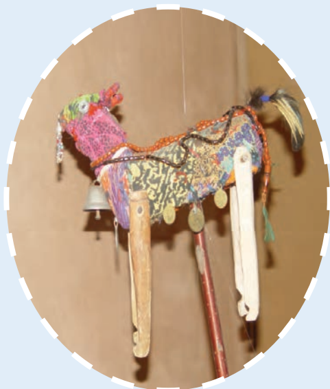
شکل ۹-۳- تصویری از «تکم» در روستا