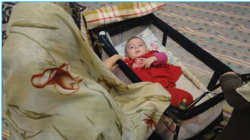
شکل ۳-۶- لالایی موجب آرامش جسم و روح مادر و کودک می‌شود.

لالایی‌ها بخش لطیفی از ادبیات شفاهی سرزمین ماست که به عنوان نخستین ارتباط کلامی مادر با کودک، مهر و محبت مادرانه را به طرز زیبایی در وجود کودکان جاری می‌سازد و موجب آرامش جسم و روح مادر و کودک می‌شود. از دیرباز در آذربایجان لالایی‌ها در فرهنگ عامیانه مردم جایگاه مهمی داشته است.