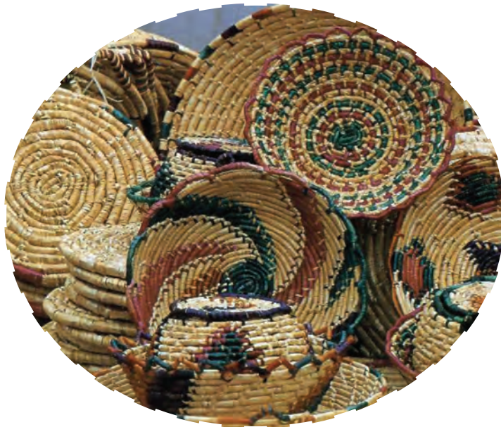
شکل ۱۵-۳- سبدهافی در کشکسرای

از سبدهافی نیز باید به عنوان یکی از صنایع در حال انقراض یاد کرد. این صنعت خانگی در گذشته نه چندان دور در بیشتر مناطق آذربایجان رونق داشته است. سبدهافی از ساقه‌های گندم و جو در مناطقی از شهرستان مرند (کشکسرای) و سبدهافی از چوب موسون در روستاهای اطراف مراغه پیشینه تاریخی زیادی دارد. زنان این مناطق این سبدها را در طرح‌ها و رنگ‌های بسیار زیبا می‌بافتند و این سبدها بیشتر مصارف خانگی داشته است.