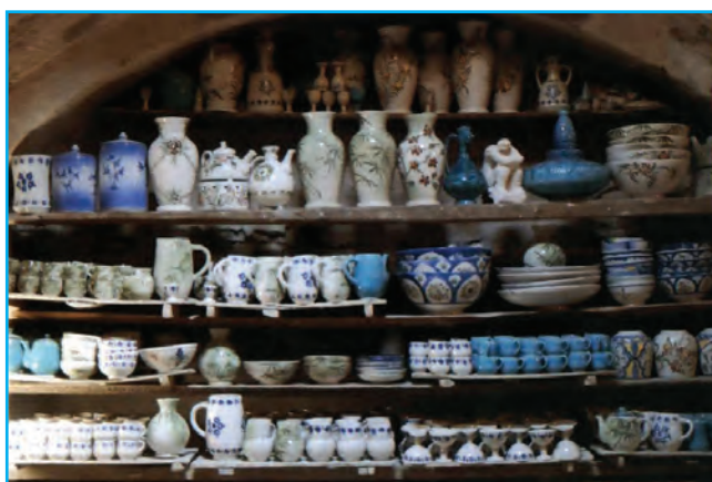
شکل ۱۴-۳- سفالگری در زنوز

صنایع دستی برجسته این استان شامل قالی‌بافی، ورنی بافی، گلیم بافی، سوزن دوزی، جاجیم بافی، تذهیب، هنرهای چوبی، سفالگری، نقاشی روی چرم، سبذبافی و... است. رونق صنعت زیبای فرش بافی در این استان به حدی است که عمده‌ترین صادرات غیرنفتی استان را به‌خود اختصاص داده است. فرش این استان معمولاً به کشورهای آلمان، فرانسه، ایتالیا و انگلیس صادر می‌شود.