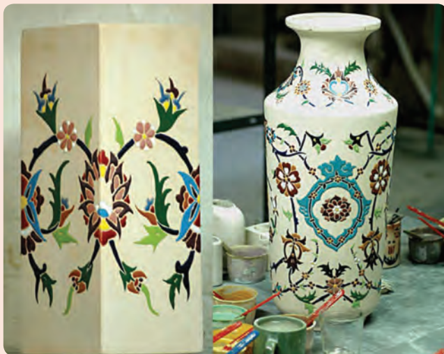
شکل ۳-۶- دو نمونه از صنایع دستی استان

مهم‌ترین و قدیمی‌ترین دست ساخته‌های بشر است. آثار سفالی برخلاف آثار یافته شده فلزی و چوبی در زیر خاک فاسد نمی‌شود و به خاطر این ویژگی به اطلاعات گویایی درباره صنایع دستی اقوام گذشته می‌توان پی برد. صنعت سفالگری در استان سمنان از قدمت بالایی برخوردار است. به‌طوری که دکتر اریک اشمیت هنگام حفاری در اطراف دامغان امیدوار به کشف شهر افسانه‌ای هکاتوم پلیس یا شهر صد دروازه بود، اگرچه موفق به کشف بقایای شهر مورد نظرش