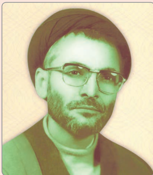
شکل ۱۴-۴- شهید حجت‌الاسلام سید کاظم موسوی

این شاعر طبیعت‌سرا و تیزهوش به زبان‌های فارسی و عربی تسلط داشته و از شعرای عرب نیز در اشعار خود تأثیر پذیرفت. این شاعر پرآوازه ادبیات ایران در سال ۴۳۲ هجری قمری از دنیا رفت.