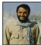
شهید قدرت ا... امینیان مسئول مهندسی فراگاه جبهه