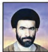
شهید سید ابوالقاسم فاوود الموسوی دامغانی نماینده مردم رامهرمز