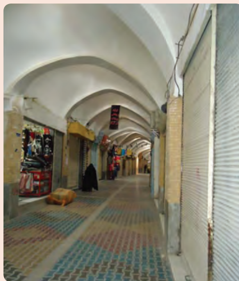
شکل ۵-۴. بازار سرپوشیده سمنان