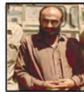
شهید حاج فرنسی شاکو فرمانده پشتیبانی جنگ جبهه کرمان