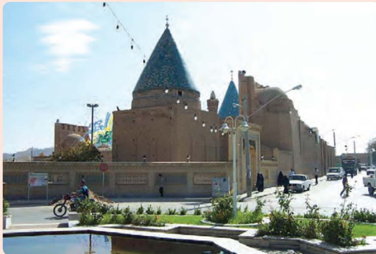
شکل ۱۱-۴- آرامگاه عارف بزرگ بایزید بسطامی، بسطام در شهرستان شاهرود

بایزید بسطامی: بایزید بسطامی ملقب به سلطان العارفين از جمله عرفای نامدار ایران است که در سال ۱۰۱ هجری قمری در خانواده‌ای مذهبی در بسطام دیده به جهان گشود. شخصیت وی چنان مورد توجه اهل دل و صاحبان قلم و اندیشه عرفانی بوده که از او به تعبیری مانند سلطان العارفين، برهان الموحدين، مراد السالکين، برهان المحققين، حجت الخلاق و مرشد السالکين یاد می‌شود. از نوشته‌های منتسب به ایشان کتاب‌های النور و دستورالجمهور است. بایزید در سال ۱۸۰ هجری قمری از دنیا رفت. آرامگاه ایشان در شهر بسطام در جوار مرقد امام زاده محمد بن صادق (ع) است.