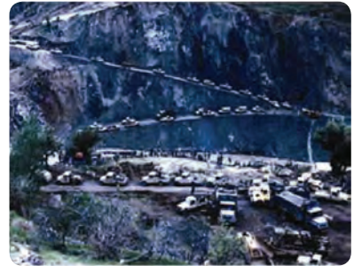
شکل ۷-۴- پشتیبانی جهاد سازندگی از جبهه‌های نبرد حق علیه باطل

احداث خاکریز، نصب پل، احداث جاده، بازسازی روستاها و شهرهای آسیب دیده به ویژه احداث جاده استراتژیک در عملیات طریق القدس در منطقه بستان و جاده سید الشهداء (ع) در جزیره مجنون از موارد مهم آن است. همچنین مدیریت قرارگاه حمزه سید الشهداء (ع) بر عهده جهاد استان بوده است که پذیرای ۱۲۰۰۰ نفر از رزمندگان جهادی استان و ۱۳۰۰۰ نفر از سایر استان‌ها بوده است. در مجموع تعداد ۱۱۳ نفر از رزمندگان جهاد سازندگی در طول ۸ سال دفاع مقدس به شهادت رسیدند.