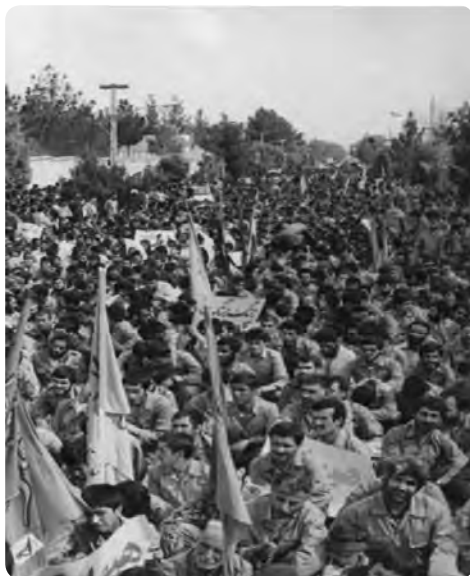
شکل ۶-۴- اعزام نیروهای مردمی از استان

روزنامه‌ها نوشتند: گروه کثیری از نیروهای تازه نفس رزمی طی یک اقدام سریع و فوق‌العاده از استان سمنان راهی جبهه‌های خون و شرف میهن اسلامی شدند.