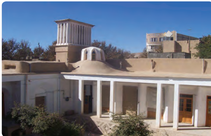
شکل ۳-۴- فضاهای زیستی اندرونی، سازگار با محیط و بادگیر در شاهرود