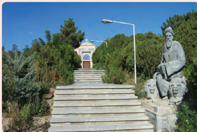
شکل ۱۲-۴- آرامگاه عارف نامی شیخ ابوالحسن خرقانی روستای خرقان در شهرستان شاهرود

تحصیل، به تزکیه نفس اهتمام ورزید و با مجاهدت به مقام‌های شایانی دست یافت. از جمله رسالاتی که به ایشان منسوب است، نورالعلوم است. این عارف بزرگ در سال ۴۲۵ هجری قمری در هفتاد و سه سالگی در روستای خرقان بسطام دیده از جهان فرو بست.