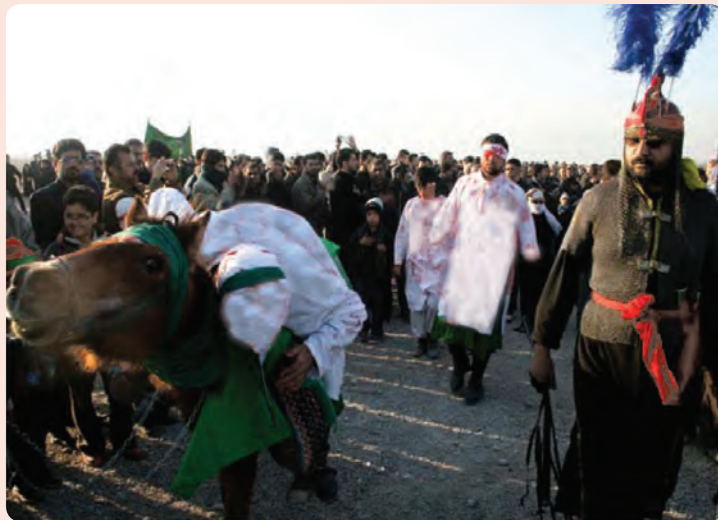
شکل ۱-۳- مراسم تعزیه خوانی ایام محرم در استان