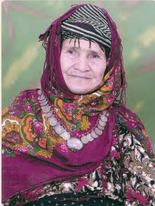
شکل ۳-۵- پوشش لباس زنان عشایر الیکایی در شهرستان گرمسار