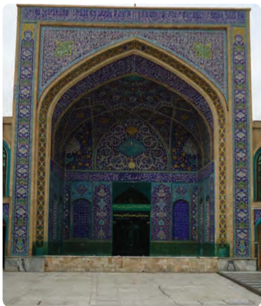
شکل ۳-۴- مرقد مطهر یحیی بن موسی بن جعفر (ع) در شهر سمنان