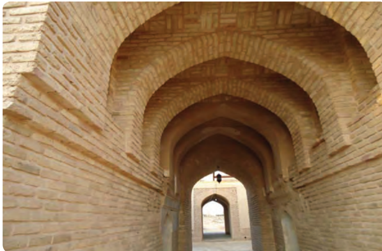
شکل ۲-۳- معماری سنتی (طاق‌های آجری) در سمنان

● معماری: به ساخت بنا و پرداختن به ظاهر و نمای ساختمانی هنر معماری می‌گویند که ریشه در فرهنگ هر قوم دارد. معماری استان سمنان نیز مانند معماری ایران آمیخته‌ای از فرهنگ باستانی و اسلامی است که در هر منطقه با توجه به شرایط محیطی و مصالح نمود پیدا می‌کند. از جمله می‌توان به نوع گنبدها، طاق‌ها و نقوش به کار رفته در بناهای تاریخی استان اشاره کرد که گویای سبک خاص معماری ایرانی و اسلامی است.