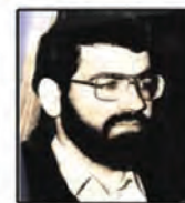
شهید سید کاظم کاشانی جانشین اطلاعات کل سیاه