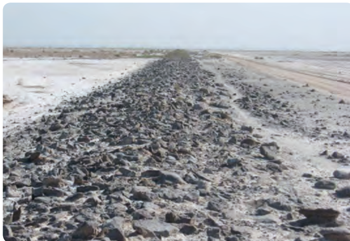
شکل ۲-۴- جاده سنگ فرش جهت عبور کاروان‌ها در جنوب گرمسار