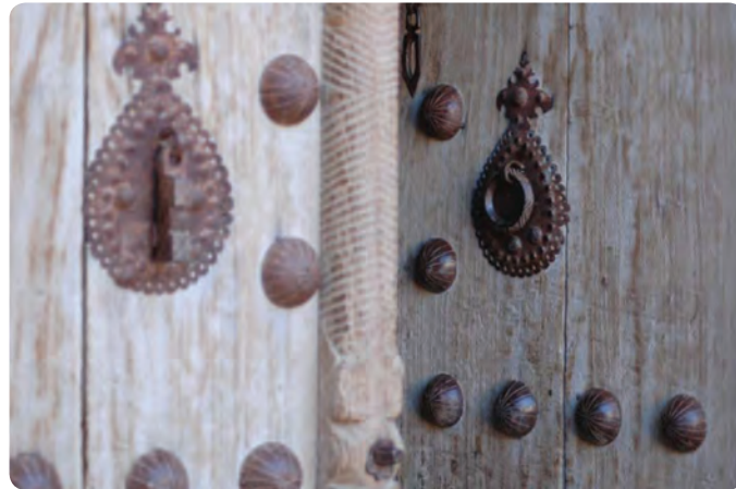
شکل ۳-۳- نقوش روی در و انواع کوبه

و رف‌های کوچک، اجرای انواع سقف به صورت گنبدی، مسطح، شیب‌دار و ... می‌توان برشمرد.