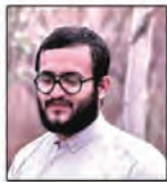
شهید حیدر هدیوس مسئول تبلیغات جبهه و جنگ جنوب کشور

نتیجه این که رده استان را بین اول تا سوم کشور با اختلاف بسیار زیاد میانگین از کشور.