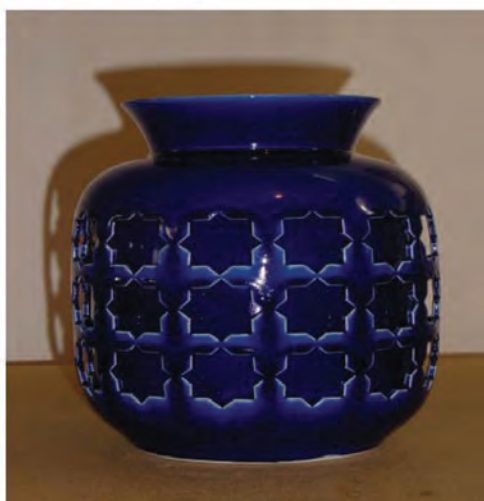
شکل ۷-۳- نمونه‌هایی از صنایع دستی استان سمنان