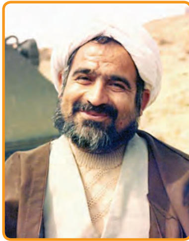
شهید حجت الاسلام غلامرضا سلطانی نماینده مردم کرج در مجلس شورای اسلامی