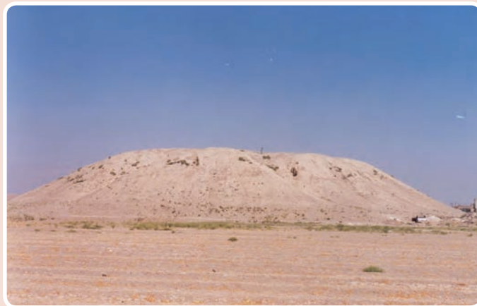
شکل ۲-۱۰- تپه مردآباد

محوطه باستانی آق تپه: این تپه در اراضی جنوب مهرشهر در محله‌ای به همین نام واقع شده است. آثار به دست آمده از این تپه مربوط به هزاره چهارم و سوم قبل از میلاد است همانند تپه مردآباد که آثار چهار دوره تاریخی در آن مشاهده می‌شود.