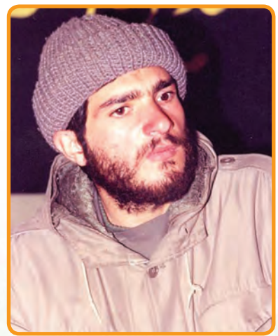
سردار شهید حمیدرضا گلکار فرمانده تیپ حبیب ابن مظاهر