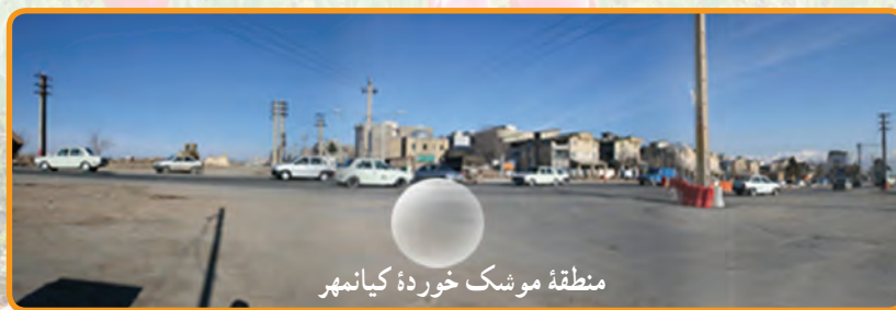
منطقه موشک خورده کیانمهر

شکل ۲-۱۱- مناطق موشک خورده کرج در دوران دفاع مقدس