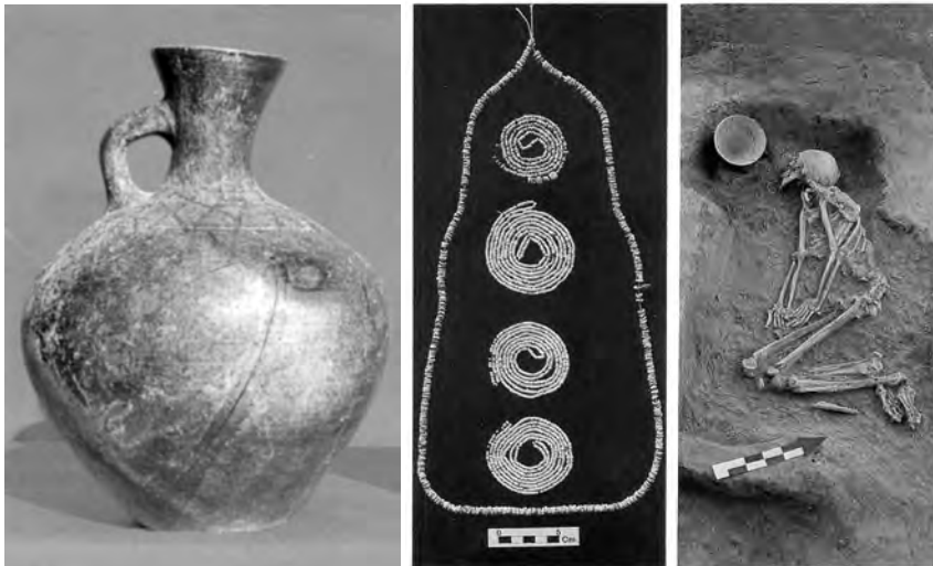
شکل ۱-۱۰-۱ تعدادی از آثار کشف شده از محوطه ازبکی

محوطه ازبکی: این محوطه در غرب شهر نظرآباد واقع شده که آثار به دست آمده از آن مربوط به هزاره هفتم قبل از میلاد است. این محوطه شامل مجموعه‌ای از تپه‌های باستانی است که در حال حاضر شش تپه از آن به نام‌های یان تپه، جیران تپه، دوشان تپه، مارال تپه، گو‌موش تپه و تپه اصلی ازبکی است. تپه