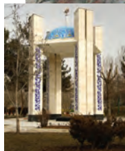
یادمان شهدای نظرآباد