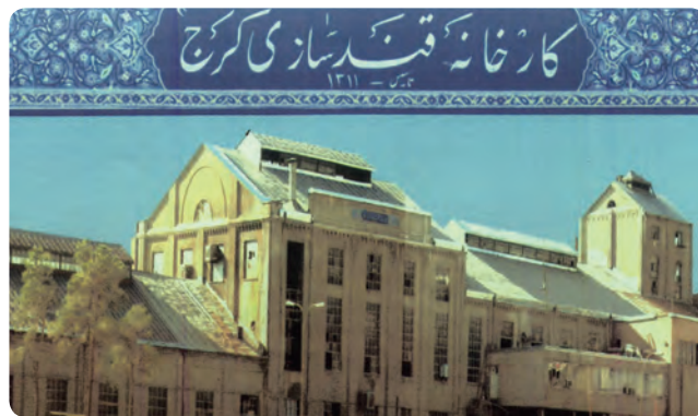
شکل ۸-۱۰- کارخانه قند کرج از اولین واحدهای صنعتی استان

مجموعه این تحولات موجب شد در مدت کوتاهی کرج با جذب مهاجرانی از سراسر کشور به دومین شهر پرجمعیت استان تهران تبدیل شود و سرانجام در سال ۱۳۸۹ به‌عنوان مرکز استان البرز انتخاب شد.