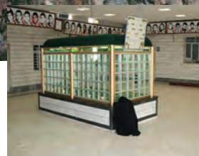
مسجد جامع المهدی کرج