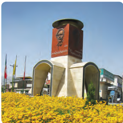
یادمان جلال آل احمد

جلال آل احمد : در ۱۱ آذر ۱۳۰۲ در خانواده‌ای مذهبی – روحانی به دنیا آمد. وی پسرعموی آیت‌الله طالقانی بود. پس از اخذ دیپلم وارد دانش‌سرای عالی تهران شد و در رشته ادبیات فارسی به تحصیل پرداخت. دو اثر تحلیلی معروف جلال آل احمد «غرب‌زدگی» و «خدمت و خیانت روشنفکران» تأثیر فراوانی در جامعه معاصر ایران به‌ویژه انقلاب اسلامی داشته است.