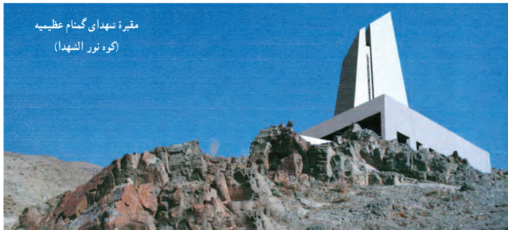
مقبره شهدای گمنام عظیمیه (کوه نور الشهداء)

در چهارده نقطه از شهرهای استان پیکر پاک ۶۴ شهید گمنام دفن شده که بنای یادبودی در این نقاط ایجاد شده است.