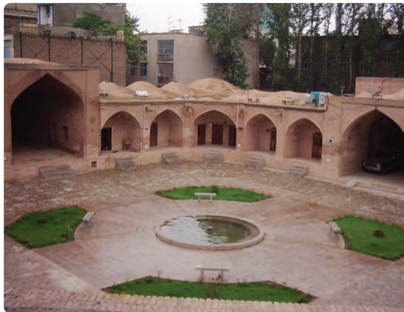
شکل ۵-۱۰- کاروان‌سرای شاه‌عباسی کرج