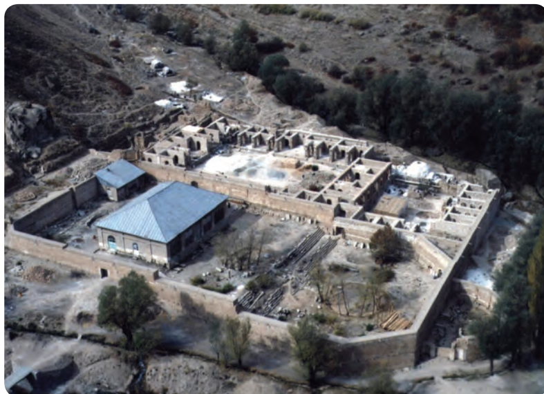
شکل ۷-۱۰- کاخ شهرستانک