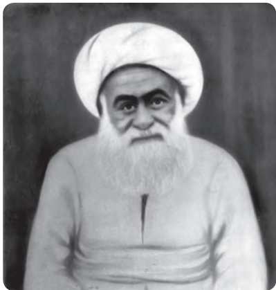
آیت‌الله شیخ هادی نجم‌آبادی

آیت‌الله سید محمود طالقانی : اولین امام جمعه تهران در سال ۱۲۸۹ هجری شمسی در خانواده‌ای اهل علم و در روستای گلیرد طالقان دیده به جهان گشود. پس از گذراندن دوره مقدماتی در زادگاهش، در مدارس رضویه و فیضیه قم تحصیل را تا درجه اجتهاد ادامه داد. طالقانی یکی از مخالفان فعال رژیم ستم‌شاهی بود و چندین بار دستگیر و روانه زندان شد. اولین مخالفت او با رژیم پهلوی مخالفت علنی با رویداد کشف حجاب بود که در پی آن دستگیر و زندانی شد و پس از آزادی با تشکیل گروه‌های سیاسی، مبارزه با رژیم را به طور رسمی آغاز کرد. با پیروزی انقلاب آیت‌الله طالقانی، ولایت‌مداری را سرلوحه امور خود قرار داد و حضرت امام او را ابوذر زمان نامید. سرانجام در سحرگاه ۱۹ شهریور ۱۳۵۸ این عالم مجاهد پس از سال‌ها فعالیت علمی مبارزات سیاسی در اثر سکته قلبی دار فانی را وداع گفت و به دیدار معبود شتافت.