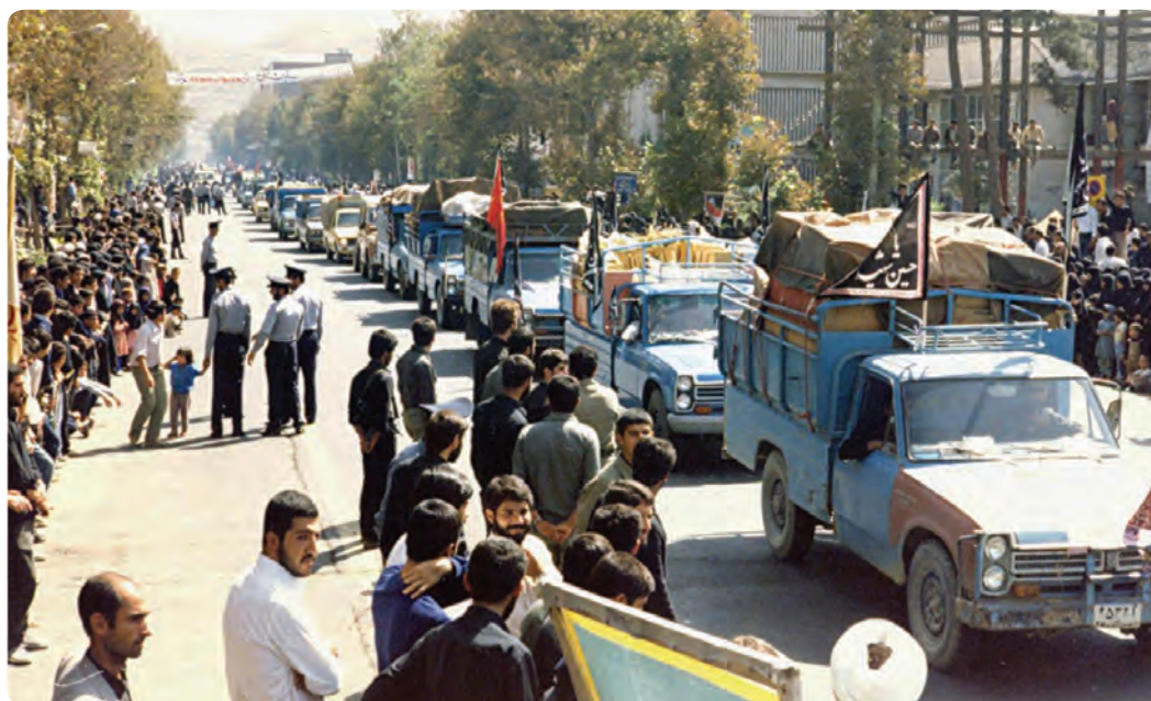
شکل ۱-۱۱- ارسال کمک‌های مردمی و اعزام رزمندگان به جبهه