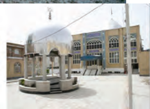
مسجد علی ابن ابی طالب شاهین ویلا