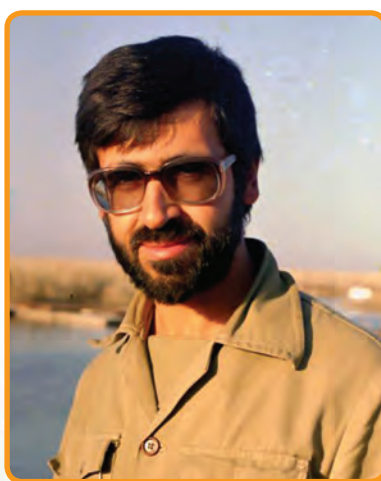
سردار شهید سیدحسین میررضی فرمانده عملیات لشکر ده حضرت سیدالشهداء (ع)