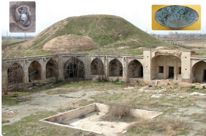
شکل ۴-۱۰- کاروان‌سرا و تپه ینگی امام ساوجبلاغ و آثار کشف شده از آن

استان در دوران صفویه : در دوره صفویه محدوده استان البرز به دلیل نزدیکی به شهر قزوین که پایتخت صفویه بود، مورد توجه قرار گرفت و صفویان اقدام به مرمت بنای امامزاده‌ها، احداث بناها، پل‌ها و کاروان‌سراها کردند؛ از آن جمله می‌توان به کاروان‌سرای شاه عباسی کرج و ینگی امام، پل‌های کرج و برغان و بناهای مذهبی چون، امامزاده سلیمان اشتهاورد و حسینیه اعظم برغان اشاره کرد. در این دوره شاهان صفویه از مناطق طالقان، ساوجبلاغ و شمال کرج به عنوان مناطق بیلاقی استفاده می‌کردند. با انتقال پایتخت از قزوین به اصفهان در زمان شاه عباس طرح‌های عمرانی منطقه متوقف شد.