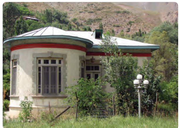
شکل ۹-۱۰- کاخ‌های دوره پهلوی