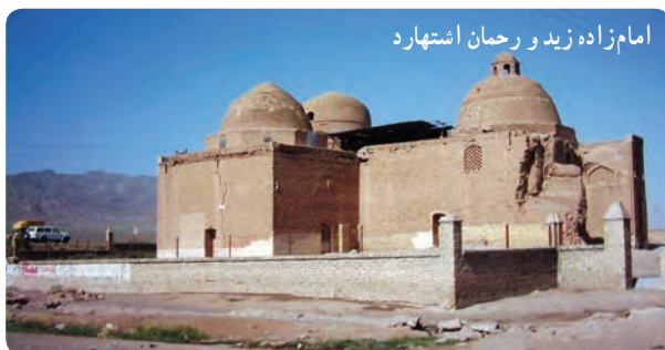
شکل ۳-۱۰- آثار دوران تاریخی اسلامی