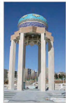
دانشگاه آزاد اسلامی کرج