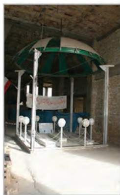
مسجد جمعه محمدشهر