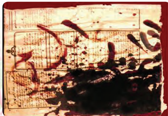
(الف) تصویر اصلی