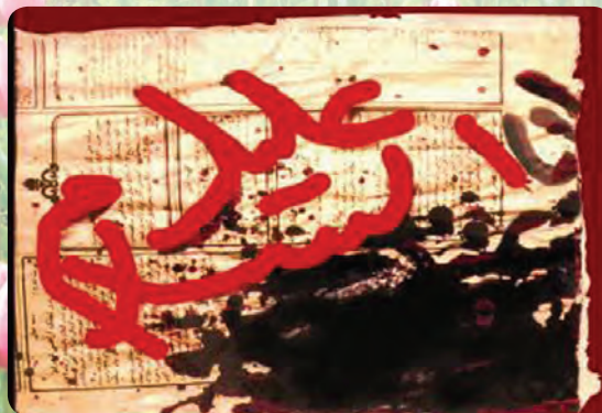
(ب) تصویر بازسازی شده