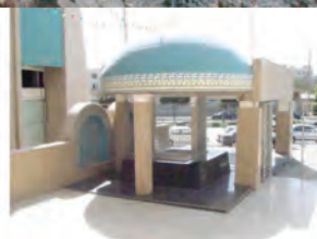
هیئت انصارالامام رزمندگان کرج