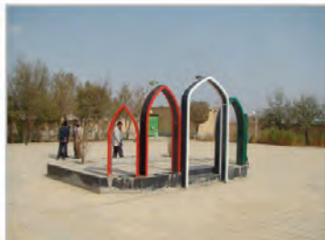
امامزاده سلیمان اشتهارد