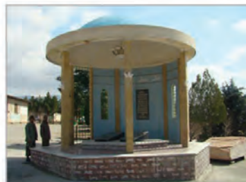
میدان صبحگاه لشکر عملیاتی حضرت سیدالشهداء (ع)