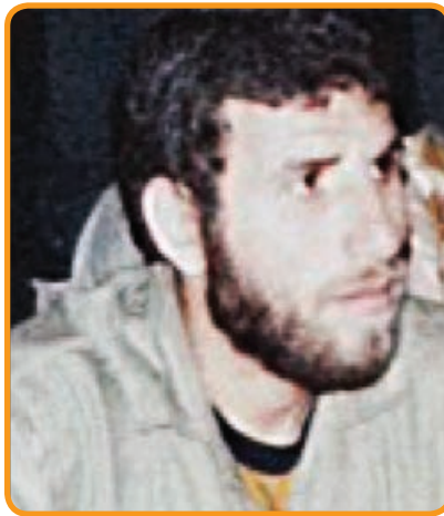
سردار شهید جمشید اصل دهقان