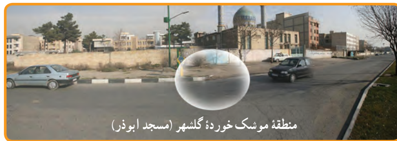
منطقه موشک خورده گلشهر (مسجد ابوذر)