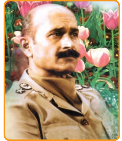
سردار شهید تیمسار ولی... فلاحی