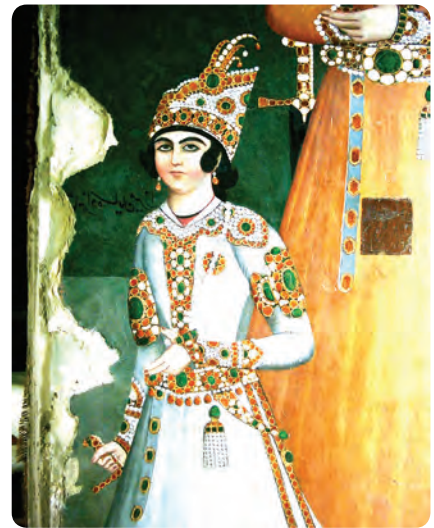
شکل ۶-۱۰- تصاویری از سران قاجار در کاخ سلیمانیه