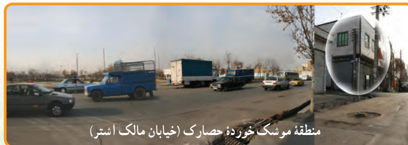
منطقه موشک خورده حصارک (خیابان مالک اشتر)