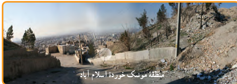
منطقه موشک خورده اسلام آباد

حمله موشکی عراق به شهرها : هنگامی که مقاومت و پیروزی رزمندگان اسلام در جبهه‌های جنگ نیروهای بعثی عراق را زمین گیر کرد، ارتش بعثی عراق به دستور صدام برای شکستن مقاومت رزمندگان حمله موشکی به شهرهای بی دفاع را در اواخر سال ۱۳۶۶ آغاز کرد. در این عملیات ناجوانمردانه شهر کرج نیز چهار بار مورد حمله موشکی قرار گرفت که در این حملات ۱۱۷ تن از هموطنان شهید و تعداد زیادی مجروح شدند.