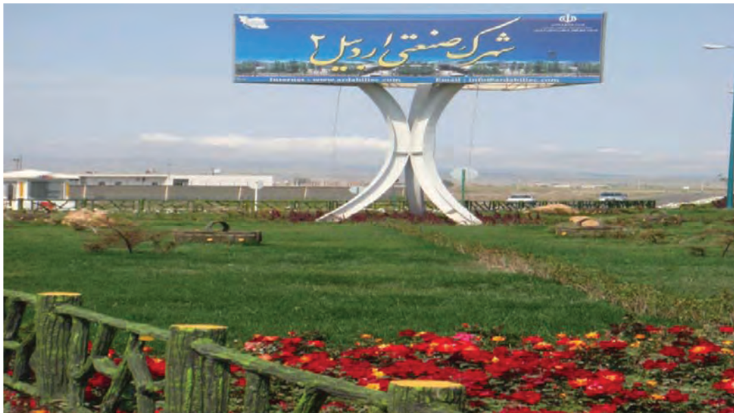
شکل ۳-۶- شهرک صنعتی اردبیل ۲

۲- شهرک صنعتی اردبیل (۲): عملیات اجرایی این شهرک از سال ۱۳۸۰ در زمینی به مساحت ۶۰۰ هکتار (امکان توسعه تا ۷۰۰ هکتار) آغاز شد. این شهرک که بزرگ‌ترین شهرک صنعتی استان است در فاصله ۱۳ کیلومتری بزرگراه اردبیل- آستارا واقع شده است همجواری این شهرک با گمرک و فرودگاه و نیز واقع شدن در مسیر بزرگراه اردبیل به تهران و نداشتن محدودیت‌های زیست محیطی برای استقرار واحدهای صنعتی مختلف از مزایا و جاذبه‌های این شهرک می‌باشد.