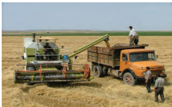
شکل ۹-۶ برداشت محصول گندم در جلگه مغان