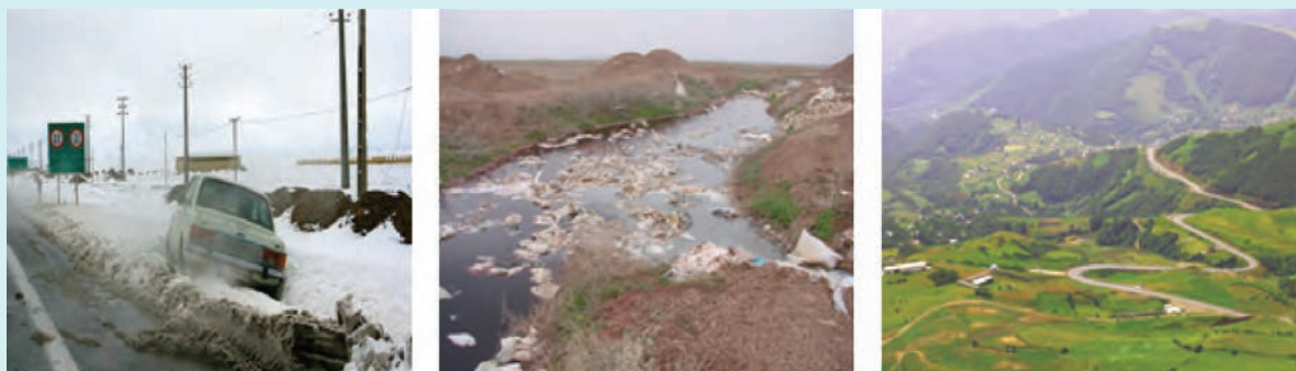
شکل ۱۵-۶- نمونه‌هایی از محدودیت‌ها و مشکلات توسعه در استان

در شکل ۱۵-۶ نمونه‌هایی از مشکلات و محدودیت‌های استان به تصویر کشیده شده است. هر تصویر کدام یک از مشکلات و محدودیت‌های استان را نشان می‌دهد؟ راهکارهای خود را برای حل این مشکلات بیان کنید.