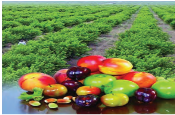
شکل ۱۴-۶- محصولات باغداری کشت و صنعت مغان

امروزه استان اردبیل با شرایط خاص جغرافیایی، تنوع محیطی، شرایط آب و هوایی، جاذبه‌های توریستی، قابلیت کشاورزی و باغداری از توان بالایی در مسیر توسعه فضایی یکپارچه برخوردار است. از طرفی همجواری با کشور جمهوری آذربایجان و ایجاد بازارچه مرزی و گمرک، ارتباط کشورمان ایران را با منطقه قفقاز و اروپا تسهیل کرده و جایگاه استان را در سطح فنی و بین‌المللی بهبود بخشیده است. با وجود قابلیت‌ها و مزیت‌های یاد شده، استان ما مسائل و مشکلاتی به شرح زیر دارد: - مرزی بودن استان و داشتن فاصله زیاد از مناطق مرکزی و توسعه یافته‌تر کشور - کوهستانی بودن استان و به تبع آن ضعف پیوند فیزیکی، اقتصادی و اجتماعی - طولانی بودن دوره سرما و یخبندان - عدم تجهیز فرودگاه‌های اردبیل و پارس آباد - نبود شبکه راه آهن