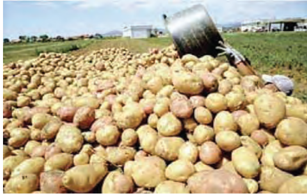
شکل ۱۳-۶- محصول سیب زمینی در دشت اردبیل