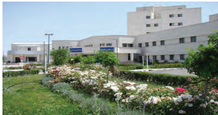
شکل ۸-۶ - بیمارستان امام خمینی اردبیل