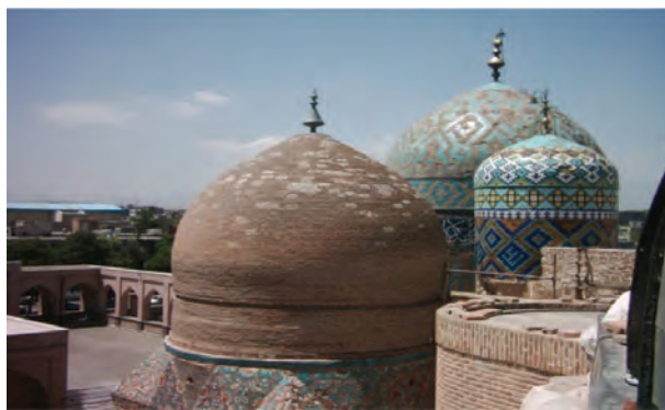
شکل ۱۱-۶ بقعه شیخ صفی در اردبیل