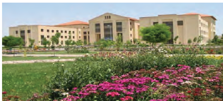
شکل ۶-۷- دانشگاه محقق اردبیلی