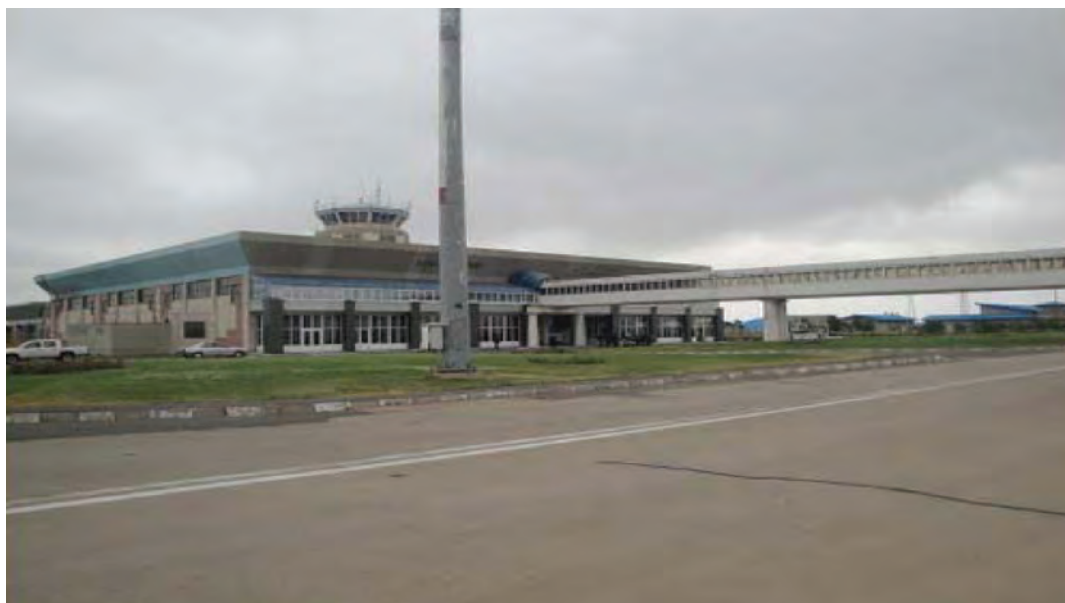
شکل ۴-۶- فرودگاه اردبیل