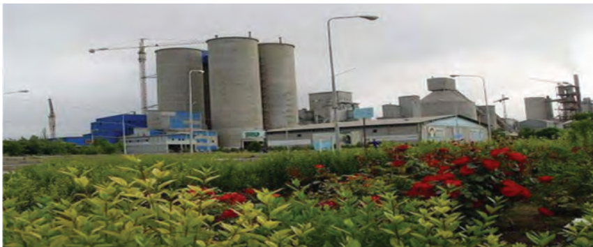
شکل ۱-۶- کارخانه سیمان آرتا اردبیل

پس از انقلاب شکوهمند اسلامی ایران نیز به علت مشکلات سیاسی مخصوصاً جنگ تحمیلی، تحول عمده‌ای در صنعت استان رخ نداد. اما پس از استان شدن اردبیل و با شروع برنامه اول توسعه اقتصادی، مسئولان منطقه در صدد توسعه صنعتی استان برآمدند و با تشکیل ادارات کل اقتصادی مخصوصاً اداره کل صنایع و معادن و شرکت شهرک‌های صنعتی، رغبت و علاقه برای سرمایه‌گذاری افزایش یافت به طوری که با راه اندازی واحدهای صنعتی بزرگ در کنار واحدهای صنعتی و معدنی کوچک، کارخانجاتی مانند: سیمان، لاستیک، خودرو، شیرخشک صنعتی، رنگ و ابزار آلات صنعتی، ریسندگی، پنبه پاک کنی، فولاد، نئوپان سازی، قطعات خودرو، ... احداث و به مرحله بهره‌برداری رسید.