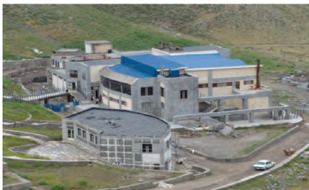
شکل ۱۲-۶ آبگرم قینرجه در مشکین شهر