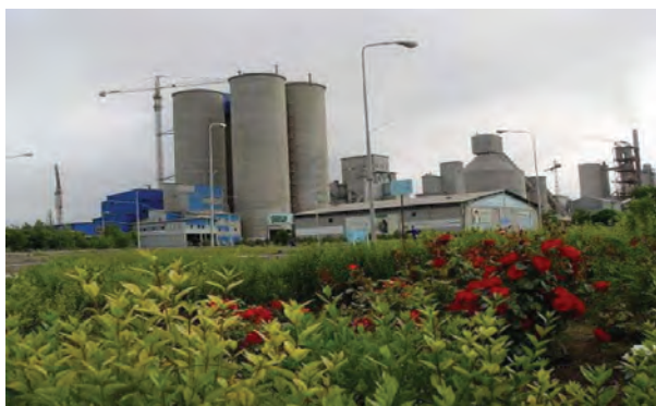
شکل ۱۰-۶ کارخانه سیمان در اردبیل

تصاویر پایین نشانگر بخشی از توانمندی‌های استان اردبیل در زمینه‌های کشاورزی و گردشگری و صنعتی و باغداری است. به نظر شما هر تصویر مربوط به کدام توانمندی‌های استان است؟ آیا می‌دانید استان اردبیل با وجود چنین توانمندی‌ها، با کدام موانع و محدودیت‌هایی در جهت توسعه مواجه است؟ این درس ضمن شرح وضعیت موجود، شما را با چشم انداز و برنامه‌های آتی توسعه استان آشنا می‌سازد.