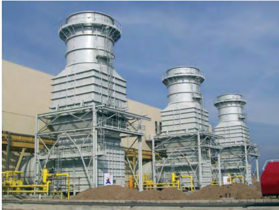
شکل ۵-۶- نیروگاه گازی سبلان اردبیل واقع در کیلومتر ۲۵ جاده اردبیل به مشکین شهر