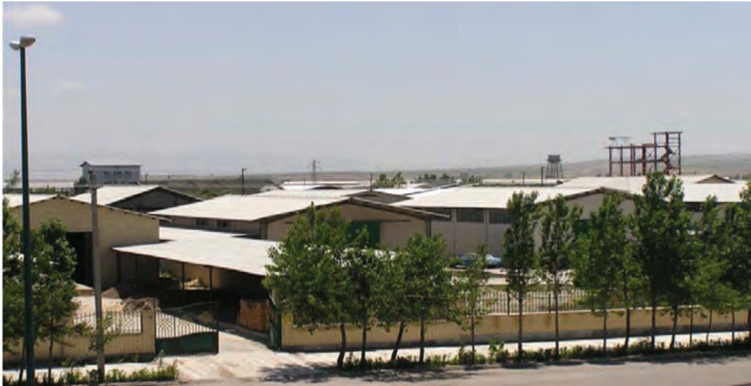
شکل ۲-۶- شهرک صنعتی اردبیل ۱

۲- شهرک صنعتی اردبیل (۲): عملیات اجرایی این شهرک از سال ۱۳۸۰ در زمینی به مساحت ۶۰۰ هکتار (امکان توسعه تا ۷۰۰ هکتار) آغاز شد. این شهرک که بزرگ‌ترین شهرک صنعتی استان است در فاصله ۱۳ کیلومتری بزرگراه اردبیل- آستارا واقع شده است همجواری این شهرک با گمرک و فرودگاه و نیز واقع شدن در مسیر بزرگراه اردبیل به تهران و نداشتن محدودیت‌های زیست محیطی برای استقرار واحدهای صنعتی مختلف از مزایا و جاذبه‌های این شهرک می‌باشد.