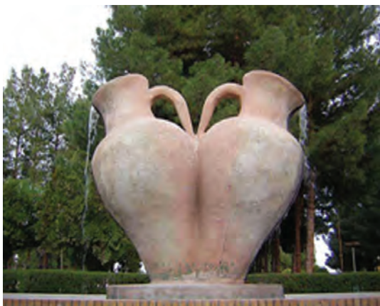
شکل ۴-۱۲- بوستان شهری بشرویه