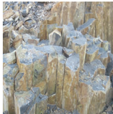
شکل ۷-۱۳- توانمندی های اقتصادی در بخش معدن