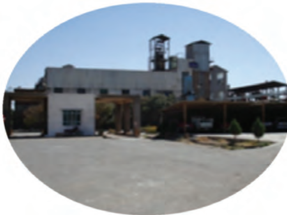
شکل ۵-۱۳- توانمندی‌های اقتصادی در بخش صنعت