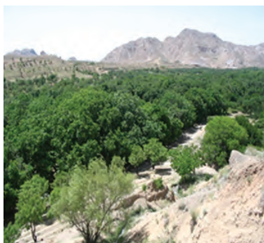
شکل ۲۰-۱۲- دره ییلاقی کریمو و مصعبی سرایان