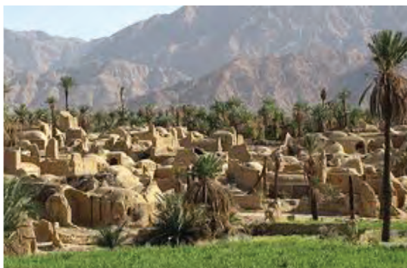
شکل ۳۱-۱۲- روستای اصفهک

● منطقه نمونه گردشگری تون و باغستان - آبگرم فردوس : شهر تاریخی و قدیمی تون در جنوب شهر فردوس با وسعتی حدود ۱۸ هکتار واقع شده است که مجموعه‌ای از جاذبه‌های تاریخی و فرهنگی را تشکیل می‌دهد؛ اما منطقه نمونه گردشگری باغستان آبگرم بیشتر از جاذبه‌های طبیعی برخوردار است.