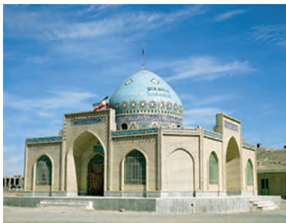
شکل ۴۰-۱۲- مزار آقا سید علی نهبندان