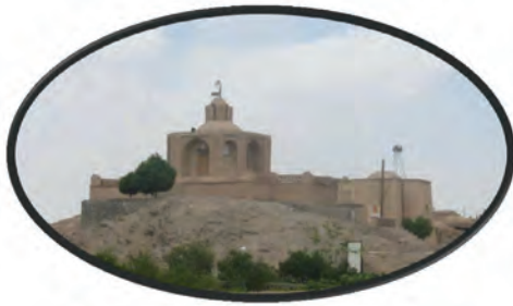
شکل ۱۶-۱۲- آرامگاه ابن حسام در شهر خوسف