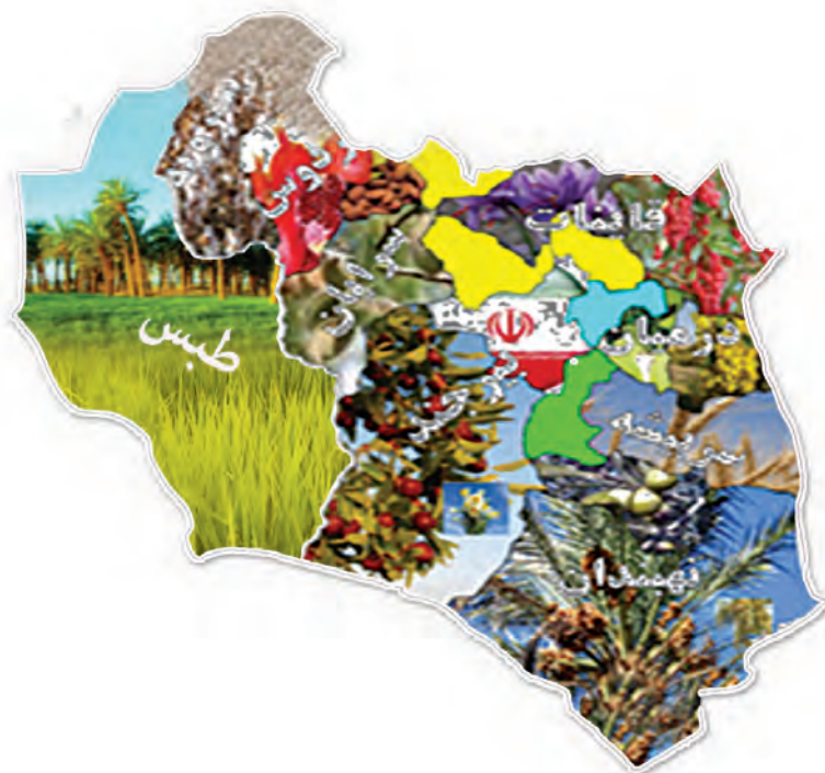
شکل ۲-۱۳- نقشه پراکندگی محصولات کشاورزی استان

استان ما دارای ۱۳۲۶۳۹ هکتار اراضی زیر کشت محصولات زراعی با تولید ۵۷۰۴۱۲ تن و ۴۶۸۸۸ هکتار سطح زیر کشت محصولات باغی با تولید ۶۱۸۹۳ تن است. همچنین از لحاظ دام، استان دارای ۳۴۱۹۳۷۷ واحد دامی می‌باشد که علاوه بر تولید نیاز استان، به سایر استان‌های همجوار نیز تولیدات آن ارسال می‌شود.