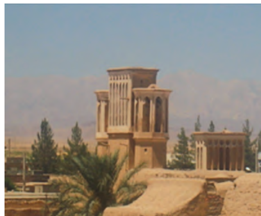
شکل ۳-۱۲- بادگیرهای بشرویه