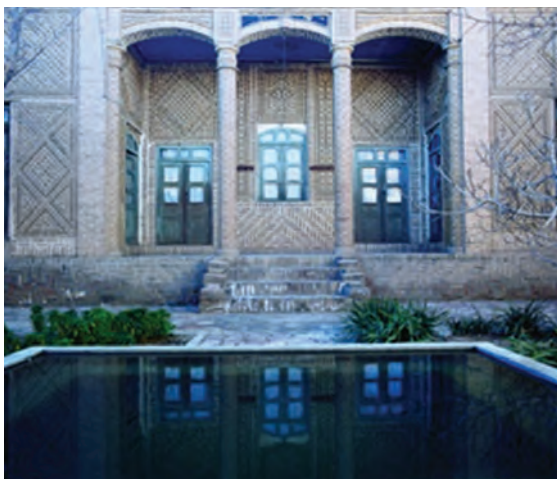
شکل ۱۰-۱۲- خانه فرهنگ بیرجند