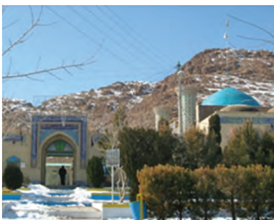
شکل ۶-۱۲- امامزاده هوگند بشرویه