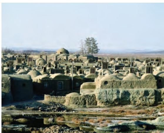
شکل ۱۴-۱۲- بافت تاریخی روستای خور شهر خوسف