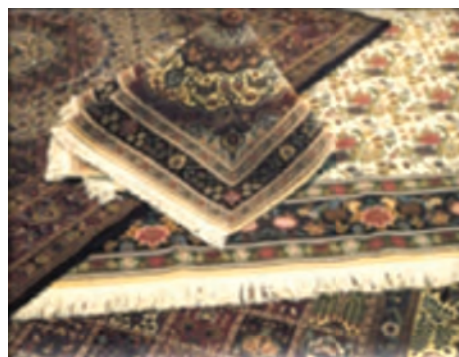
شکل ۶-۱۳- فرش مود

* کدام یک از صنایع دستی در شهرستان محل زندگی شما از رونق برخوردار است؟ چند مورد را نام ببرید. ب) بخش معدن: به جدول ۵-۱۳ توزیع پراکندگی معادن استان ما نگاه کنید. بگویید که بیشترین و کمترین معادن فعال استان در محدوده کدام شهرستان‌ها واقع شده است؟