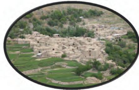
شکل ۱۵-۱۲- روستای آرک شهر خوسف

● منطقه نمونه گردشگری درخش و آسیابان (قهستان)، روستای هدف گردشگری در میان و فورگ در شهرستان در میان: این منطقه در شهرستان در میان در ۷۰ کیلومتر محور بیرجند - در میان - زیرکوه واقع شده است و یکی از قدیمی ترین نقاط استان خراسان جنوبی محسوب می شود. اهمیت آن بیشتر از لحاظ جاذبه های تاریخی و فرهنگی است؛ هرچند دارای مناطق بیلاقی با درختان و باغات سرسبز می باشد و روستاهای هدف گردشگری در میان و فورگ در مسیر جاده اسدیبه به سریشه و بیرجند واقع شده است.