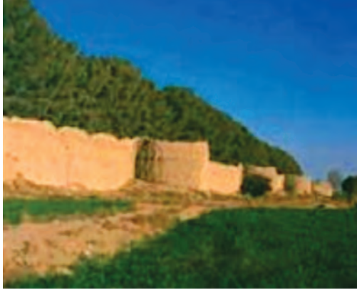
شکل ۲۸-۱۲- قلعه باغ شهرمود