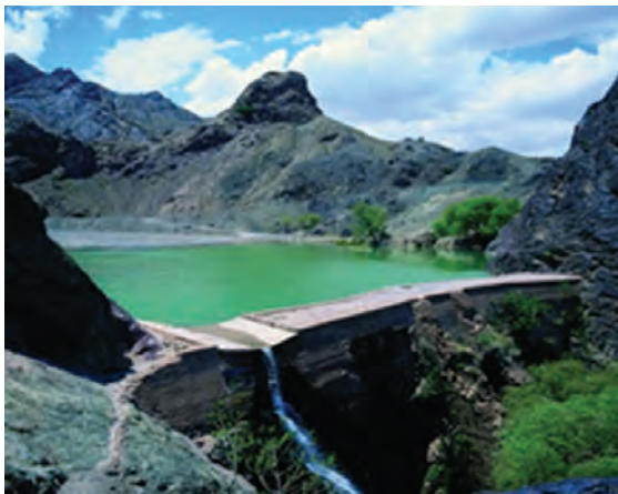
شکل ۸-۱۲- بنددره بیرجند