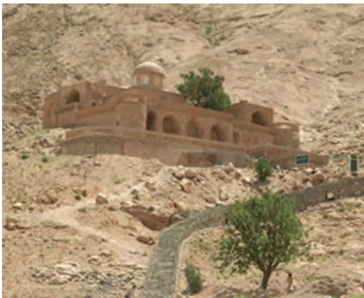
شکل ۳۷-۱۲- بوذرجمهر قاین