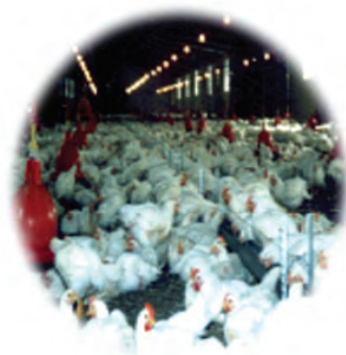
شکل ۴-۱۳- توانمندی‌های اقتصادی در بخش پرورش دام و طیور