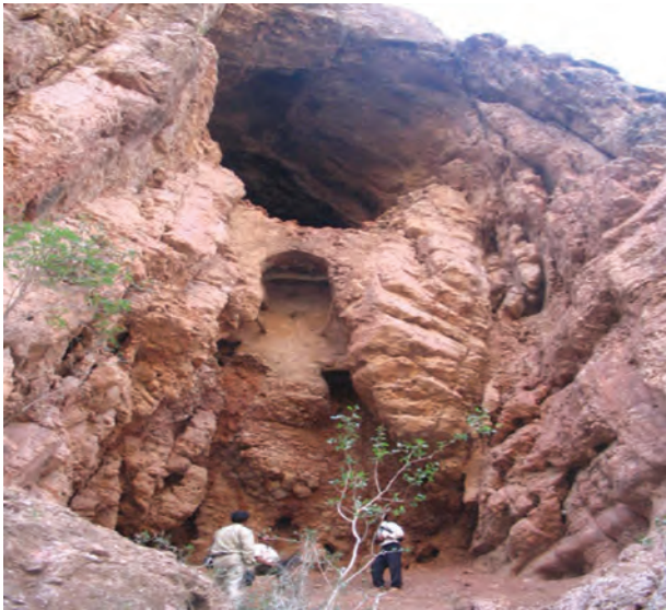
شکل ۱۲-۲۲- غار پهلوان شهرستان زیرکوه