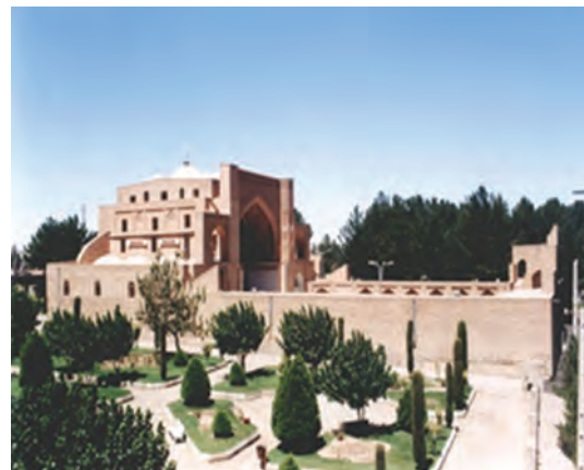
شکل ۳۶-۱۲- مسجد جامع قاین