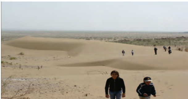
شکل ۱۲-۲۴- کویر همت آباد شهرستان زیرکوه