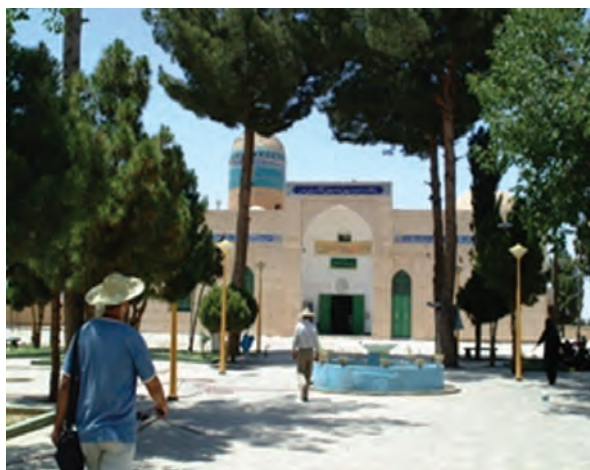
شکل ۳۲-۱۲- امامزادگان سلطان محمد و سلطان ابراهیم