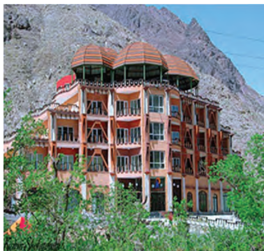
شکل ۱۱-۱۲- هتل کوهستان بند عمرشاه (امیرشاه) بیرجند