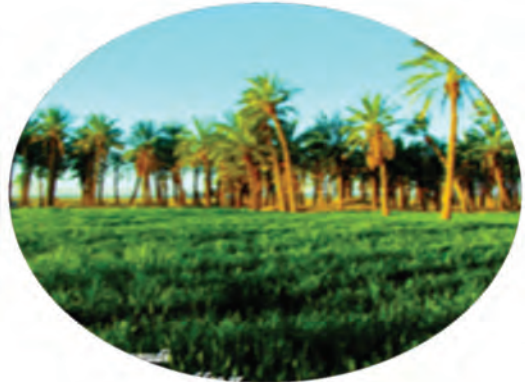
شکل ۴۱-۱۲- نخلستان‌های دهسلم