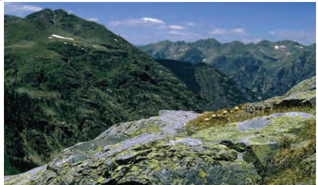
شکل ۱۲-۲۳- قلّه میلاد شاسکوه شهرستان زیرکوه