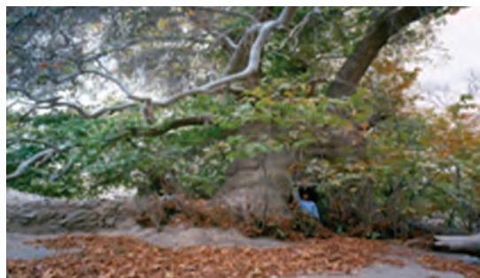
شکل ۱۹-۱۲- درخت هزار ساله دوشنگان