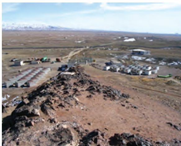
شکل ۳۳-۱۲- آب گرم فردوس