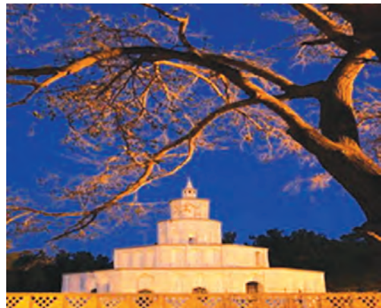
شکل ۷-۱۲- ارگ کلاه فرنگی بیرجند