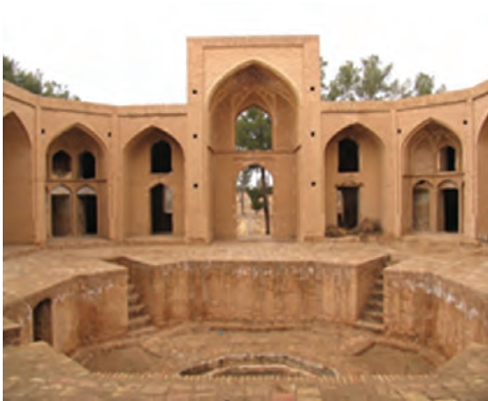
شکل ۳۵-۱۲- مدرسه علیای فردوس