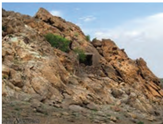
شکل ۲۶-۱۲- غار چنشت