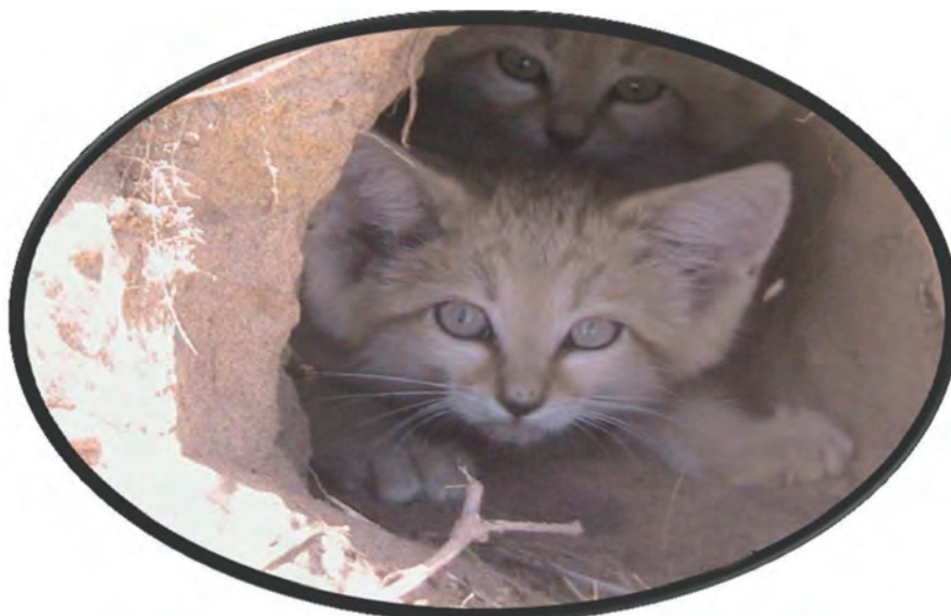
شکل ۲۵-۱۲- گربه شنی در حال انقراض شهرستان زیرکوه

● روستاهای هدف گردشگری چنشت و ماخونیک در سریشبه: روستای هدف گردشگری چنشت در ۳۵ کیلومتری شهر مود واقع شده است و از نظر جاذبه‌های طبیعی و تاریخی - فرهنگی اهمیت خاصی دارد اما روستای ماخونیک در محور سریشبه به دُرُح قرار دارد. و بیشتر از اهمیت تاریخی برخوردار است.