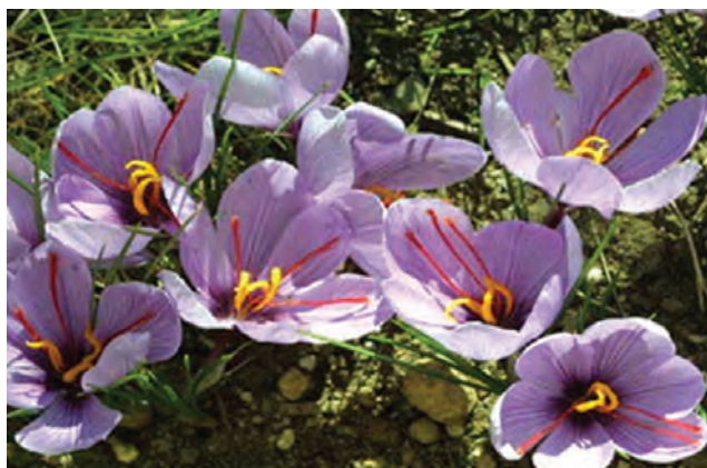
شکل ۳۸-۱۲- مزارع زعفران (طلای سرخ) قاینات

● روستای هدف گردشگری دهسلم در نهبندان: شرایط اقلیمی مناطق کویری از جمله نهبندان باعث شده تا مردم کویرنشین از ابتکار و خلاقیت خود استفاده کنند و با حداکثر بهره‌گیری از عوامل و شرایط طبیعی آن را در اختیار خود درآورند.