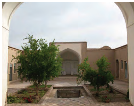
شکل ۱۳-۱۲- خانه تاجور شهر خوسف