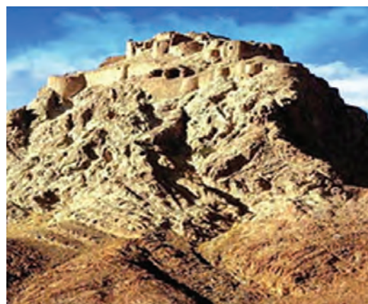
شکل ۵-۱۲- قلعه دختر