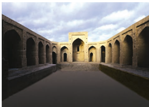
شکل ۲۱-۱۲- کاروانسرای سرایان