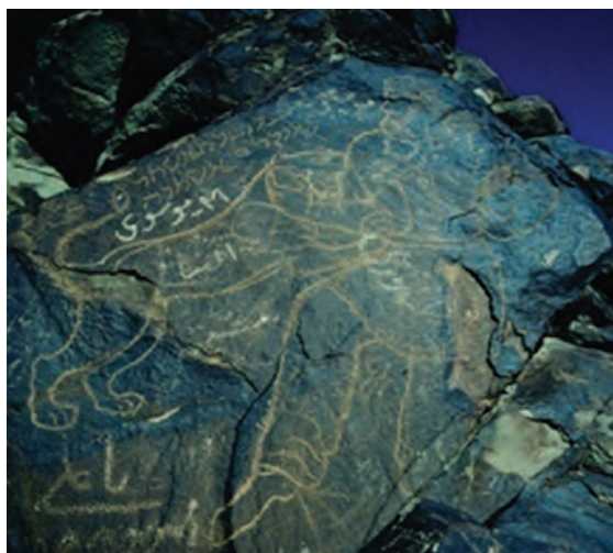
شکل ۱۲-۱۲- سنگ نگاره کال جنگال بیرجند