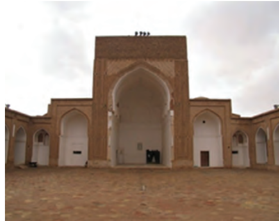
شکل ۳۴-۱۲- مسجد جامع فردوس

● منطقه نمونه گردشگری بوذرجمهر قاین : منطقه نمونه گردشگری بوذرجمهر با وسعتی حدود ۵۰۹ هکتار در ضلع شرقی شهر قاین واقع شده است که پیوند تنگاتنگی با پایتخت زعفران جهان و کانون شهری دیرینه و پایدار سرزمین قهستان و فرهنگ و تمدن کهن دارد.