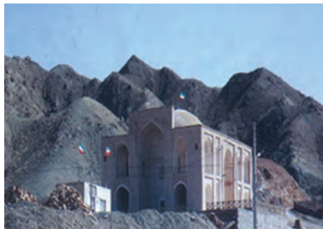
شکل ۱۸-۱۲- امامزاده سلطان ابراهیم رضا