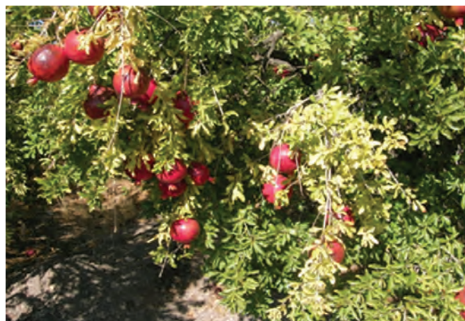
شکل ۳-۱۳- باغات انار در استان خراسان جنوبی

پ) دامپروری : علی‌رغم شرایط نامناسب اقلیمی، بیش از ۱۵۱۵۳ خانوار عشایری در استان به فعالیت‌های دامی مشغول‌اند. علاوه بر آن در بخش دامپروری، پرورش مرغ گوشتی و تخم‌گذار، گاو شیری و گوشتی، گوسفند، بز و شتر به صورت سنتی و صنعتی انجام می‌پذیرد.