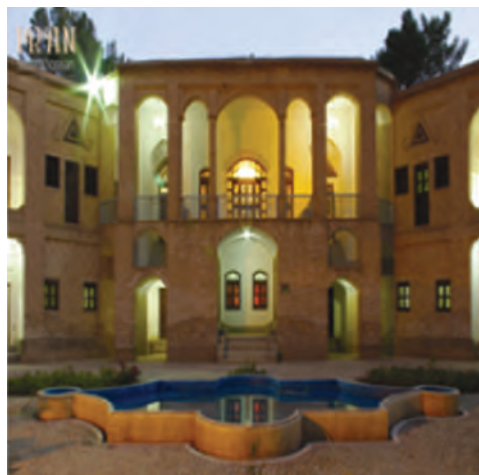
شکل ۱-۱۲- باغ موزه و عمارت اکبریّه بیرجند