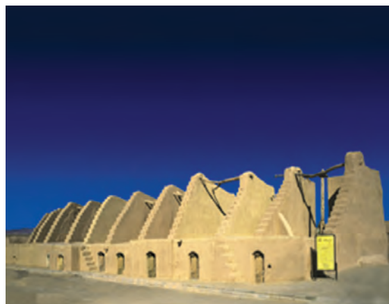
شکل ۳۹-۱۲- آسبادهای خوانشرف نهبندان