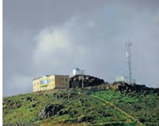
شکل ۲۷-۱۲- رصدخانه دکتر مجتهدی

● مناطق نمونه گردشگری خرو، اصفهک و نای بند طبس : شهرستان زیارتی - سیاحتی طبس با پیشینه تاریخی می تواند به یکی از قطب های گردشگری استان خراسان جنوبی تبدیل شود و باعث شکوفایی اقتصاد منطقه گردد.