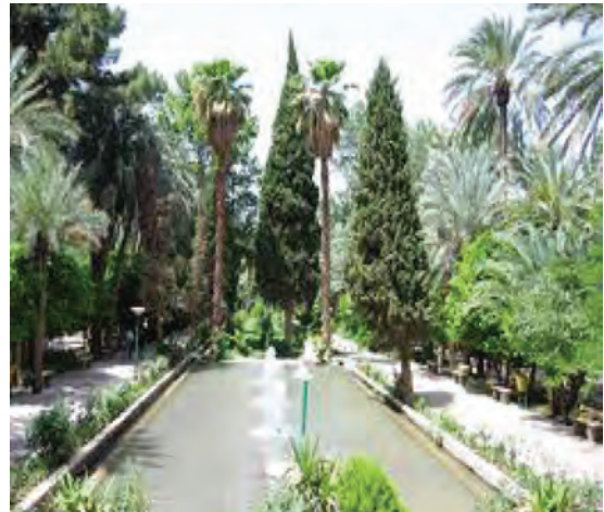
شکل ۲۹-۱۲- باغ گلشن