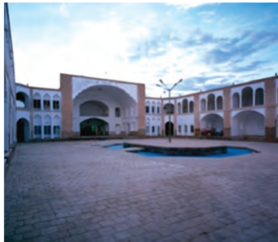
شکل ۹-۱۲- مدرسه شوکتیه بیرجند