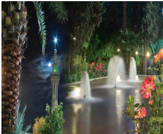
شکل ۳۰-۱۲- بارگاه امامزاده حسین بن موسی الکاظم