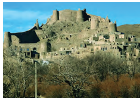
شکل ۱۷-۱۲- قلعه فورگ در میان