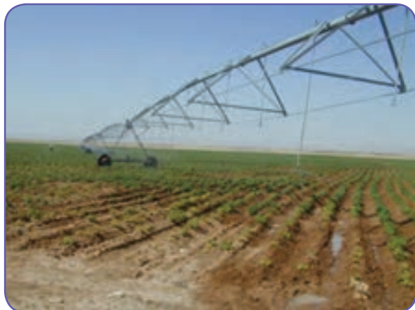
شکل ۱۲-۶- شیوه‌های نوین آبیاری (بارانی)