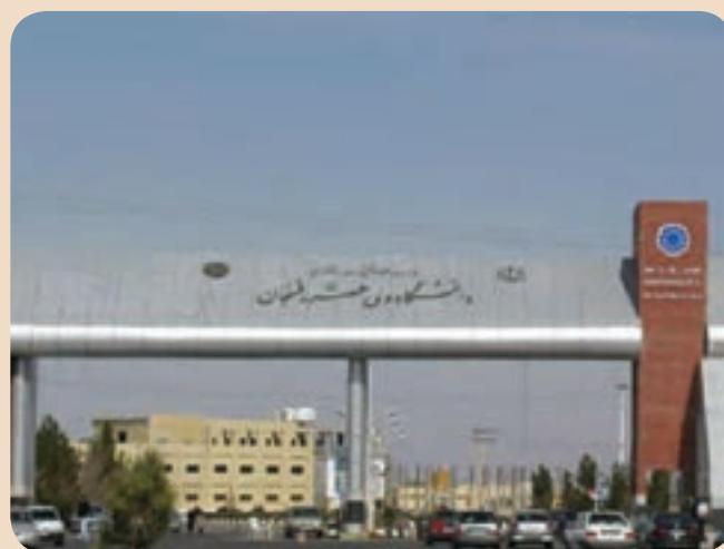
شکل ۱۰-۶- دانشگاه ولی عصر رفسنجان