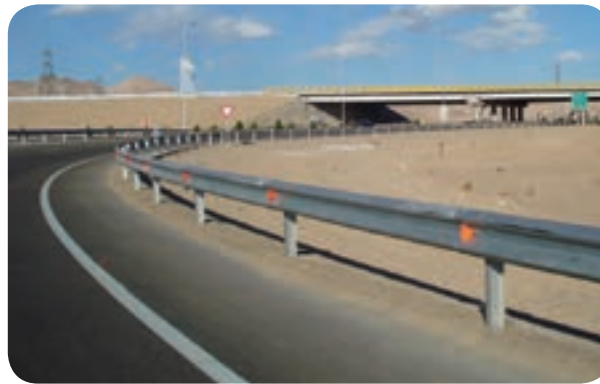
شکل ۳-۶- محور ارتباطی کرمان- باغین