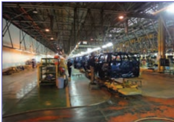
شکل ۲۱-۶- منطقه ویژه اقتصادی ارگ جدید بم (کارخانه خودروسازی)