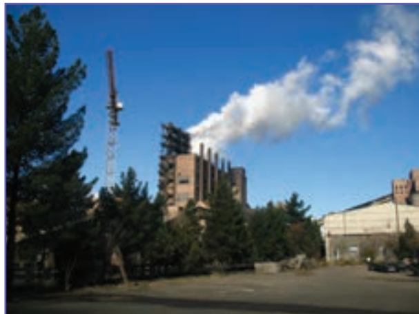
شکل ۷-۶- کارخانه زغال سویی زرنند