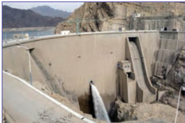
شکل ۶-۶- سد جیرفت (سالانه ۸۰ مگاوات ساعت انرژی تولید می‌کند.)