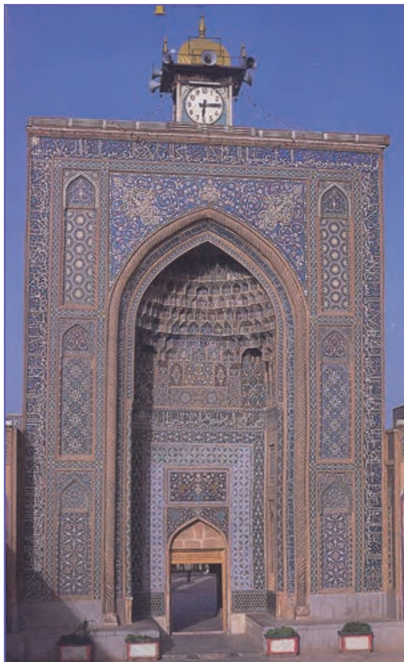
شکل ۲۰-۶- مسجد جامع کرمان