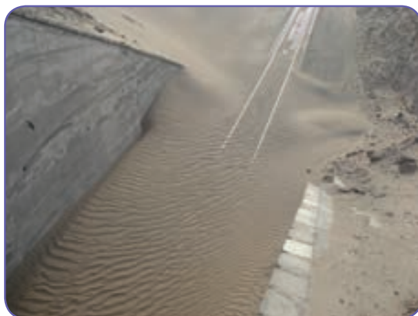
شکل ۱۴-۶- هجوم ماسه‌های روان و ایجاد مشکل برای خطوط راه آهن