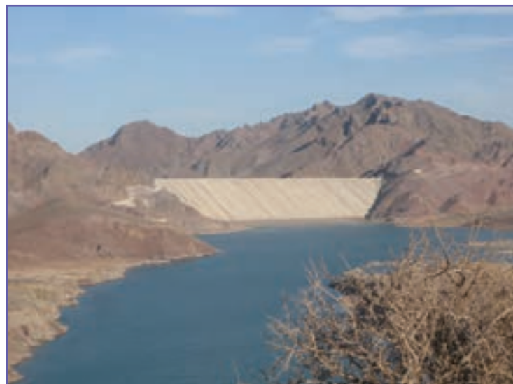
شکل ۱۶-۶- سد سنگریزه‌ای نساءبم