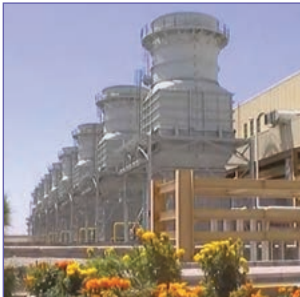
شکل ۶-۵- نیروگاه سیکل ترکیبی کرمان

آب: در سال ۹۶ بخش قابل توجه‌ای از مناطق شهری (۹۹/۷ درصد) و مناطق روستایی (تقریباً ۶۴/۲ درصد) دارای شبکه آب آشامیدنی سالم و بهداشتی می‌باشند.