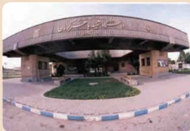
شکل ۹-۶- دانشگاه شهید باهنر کرمان

آموزش عالی : در استان کرمان جهت گیری اهداف دانشگاه ها و مراکز آموزش عالی به سوی ایجاد بستری مناسب برای آموزش، تحقیق و فناوری طی ۴۰ ساله پس از پیروزی انقلاب اسلامی بوده است. در سال تحصیلی ۹۷-۱۳۹۶ در مجموع ۱۲۲۸۷۹ نفر دانشجو در مراکز آموزش عالی استان مشغول به تحصیل بودند که با توجه به تعداد دانشجو در سال های اولیه انقلاب -۱۱۳۲ نفر- نشان از رشد قابل توجه آن دارد. از شاخص ترین دانشگاه های استان می توان به شهید باهنر کرمان، علوم پزشکی کرمان و... اشاره کرد.