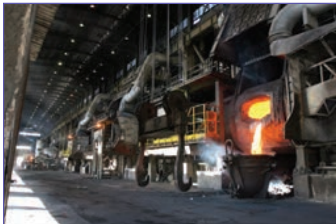
شکل ۸-۶- کارخانه مس خاتون آباد شهراباک

این استان از لحاظ زمین‌شناسی و ذخائر معدنی دارای موقعیت ویژه‌ای است. بهره‌برداری از معادن فلزی مانند آهن، مس، سرب و روی دارای سابقه چند هزارساله در استان می‌باشد. عمده‌ترین معادن استان شامل معادن مس سرچشمه به ذخیره یک میلیارد تن، مس میدوک شهراباک به ذخیره ۸۰ میلیون تن، مس چهار گنبد به ذخیره ۴۵ میلیون تن و همچنین هشت معدن زغال سنگ با ذخیره‌ای معادل ۲۰۰ میلیون تن، ۱۰ معدن سرب و روی و معادن سنگ آهن گل گهر سیرجان به ذخیره‌ای بیش از یک میلیارد تن و جلال آباد زرنند با ذخیره‌ای معادل ۱۵۰ میلیون تن کرومیت بافت و اسفندقه و فاریاب جیرفت با ذخائری معادل یک میلیون تن همچنین ذخائر غیرفلزی سولفات دوسود راین، باریت رفسنجان، دولومیت سیرجان و سیلیس شهراباک و رفسنجان می‌باشد. علاوه بر آن معادن سنگ تزئینی استان کرمان به لحاظ میزان ذخیره انبوه و تنوع و کیفیت دارای جایگاه ویژه‌ای است. در سال‌های اخیر پروانه‌های بهره‌برداری معادن در استان رشد چشمگیری داشته به نحوی که سال ۸۸ نسبت به سال ۸۶ از رشد ۴۶/۵ درصدی برخوردار بوده است. استان کرمان از نظر ارزش تولیدات معدنی ۴۵ درصد از کل تولیدات معدنی کشور را به خود اختصاص داده که از این نظر رتبه اول را در کشور به خود اختصاص داده است. همچنین از نظر شاغلین در معدن و سرمایه‌گذاری در معادن مقام اول کشور را دارا است.