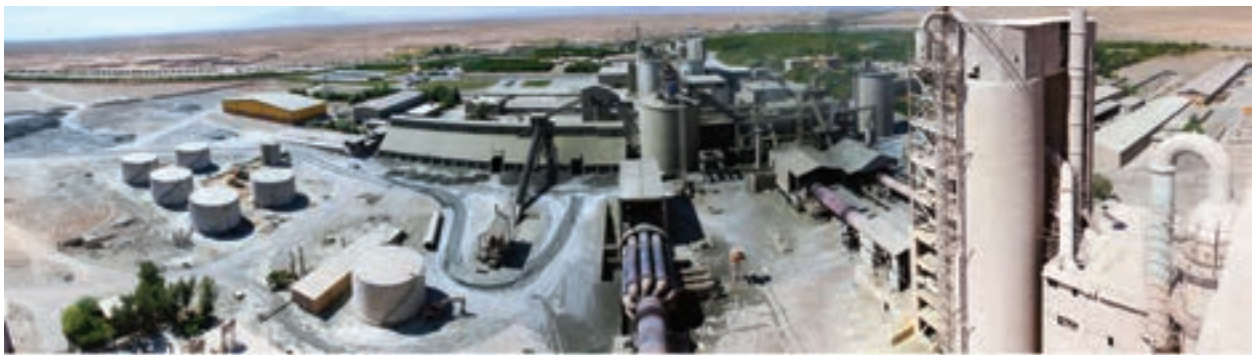
شکل ۱۷-۶- کارخانه سیمان کرمان