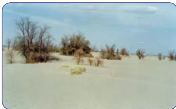
شکل ۱۳-۶- احیای پوشش گیاهی جهت تثبیت شن‌های روان