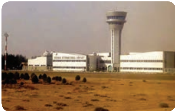
شکل ۴-۶- فرودگاه کرمان