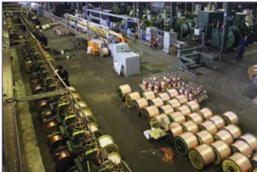
شکل ۱۸-۶- کارخانه سیم و کابل کرمان