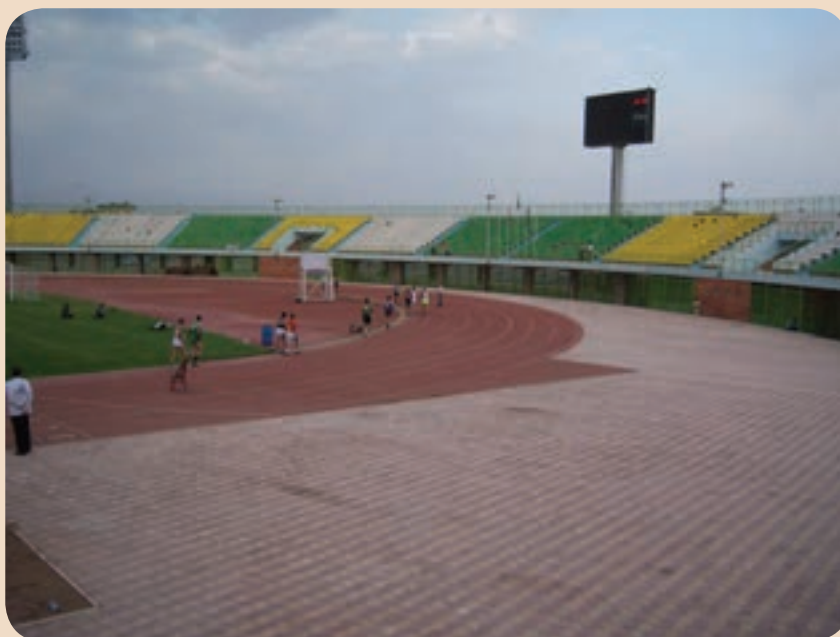
شکل ۱۱-۶- استادیوم ورزشی شهید باهنر کرمان