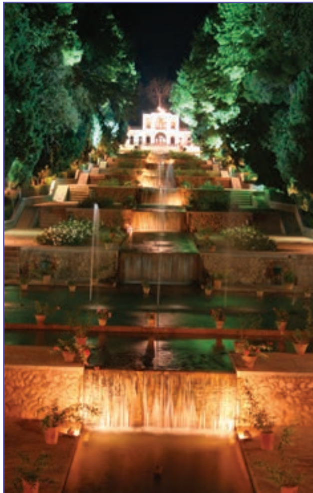
شکل ۱۹-۶- باغ شاهزاده ماهان