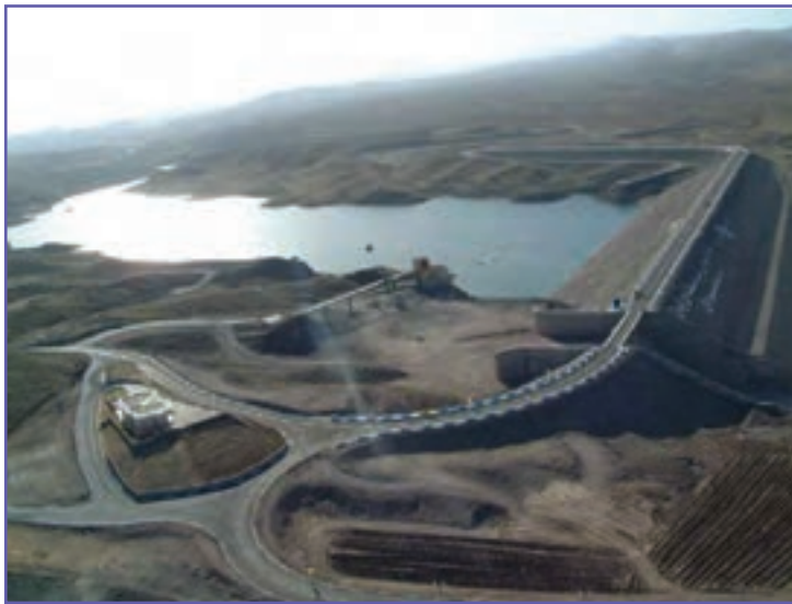
شکل ۱۵-۶- سد سیرجان

- از راهکارهای بلندمدت می‌توان به انتقال آب حوضه به حوضه برای شهرهای شمالی اشاره کرد.