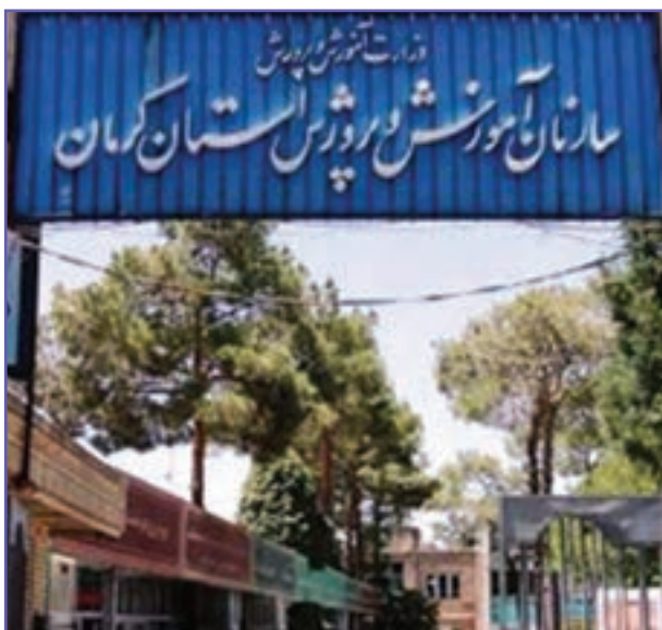
شکل ۲۲-۶- سازمان آموزش و پرورش استان کرمان