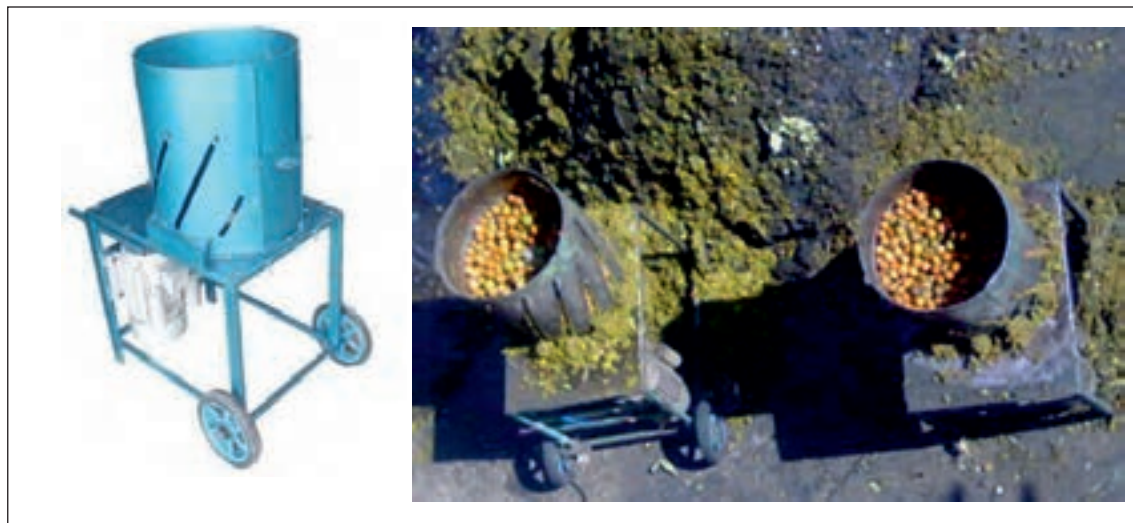
شکل ۳-۲- دستگاه پوست‌گیر گردو