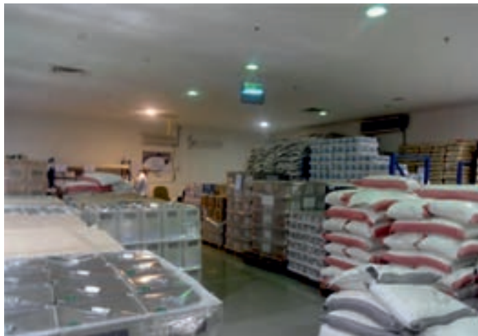
شکل ۳-۷- انبار نگهداری محصول