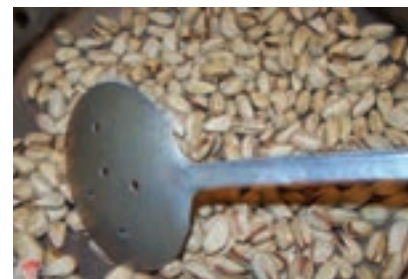
شکل ۳-۵- مراحل خشک کردن و بودادن پسته