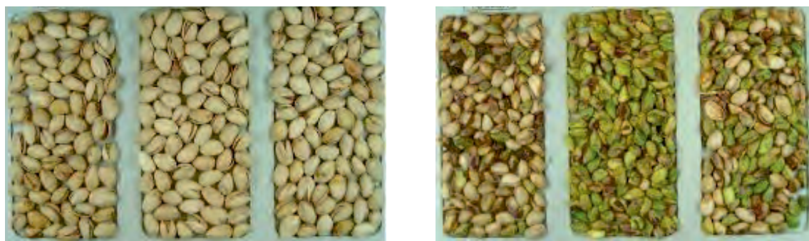
شکل ۳-۶ محصول اولیه قابل قبول غیر قابل قبول غیر قابل قبول قابل قبول محصول اولیه

آزمون‌های شیمیایی: عدد پراکسید بیانگر میزان اکسید شدن روغن مغزهای آجیلی است و برحسب میلی‌اکی‌والان گرم اکسیژن فعال در کیلوگرم روغن تعیین می‌شود.