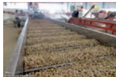
شکل ۳-۳- مراحل شست‌وشو و نم‌گیری پسته

پس از شست‌وشو، رطوبت اضافی با استفاده از دستگاه نم‌گیر کاهش می‌یابد. در این مرحله از هوای داغ با دمای حدود ۱۰۰ درجه سلسیوس به مدت ۳۰ - ۲۰ دقیقه استفاده می‌شود تا رطوبت پسته به حدود ۳۳ - ۳۰ درصد برسد.