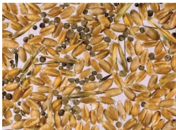
شکل ۴۷- انتقال بذر علفهای هرز با بذر گیاه اصلی

۵- از طریق بذر گیاه اصلی: این روش یکی از رایج ترین و مهم ترین روش انتقال بذر علفهای هرز می باشد. زیرا هر ساله میلیون ها تن بذر گیاهی در سطح جهانی جابجا می شود (شکل ۴۷).