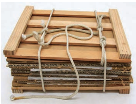
شکل ۱۷- تخته پرس مخصوص خشک کردن نمونه‌های گیاهی