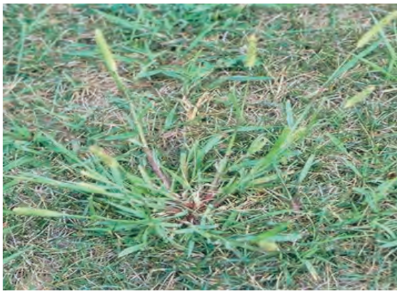
شکل ۱۲- گیاه کامل

برای جمع آوری نمونه‌های علف‌های هرز، در زمان‌های مختلف به عبارت دیگر در مراحل مختلف رشد و نمو یا حداقل زمانی که گیاه تمام یا حداکثر اندام‌های خود را دارد، به محل پراکنش یا مزارع اختصاصی آن علف هرز رفته، آنها را با احتیاط کامل از زمین خارج می‌کنند (شکل ۱۲).