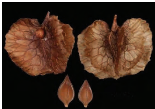
بذر ترشک با زوائد بال‌مانند