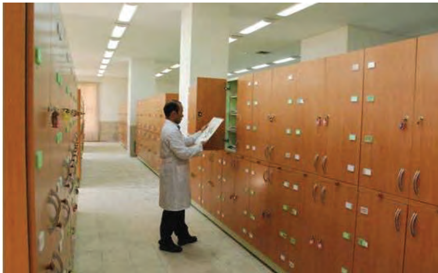
شکل ۱۱- نمونه‌ای از هرباریوم