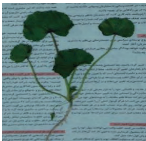
شکل ۱۳- خشک کردن نمونه

برگ‌ها، ریشه‌ها و سایر اندام‌ها را روی کاغذ به نحوی می‌گسترانند تا بدون چین خوردگی، شکل طبیعی گیاه حفظ گردد. این صفحه را لای صفحات کاغذی دیگر قرار داده و مجموعه را تحت فشار (پرس) قرار می‌دهند؛ تا هم ضمن کاهش یا کشیده شدن رطوبت و خشک شدن، گیاه دارای فرم مطلوبی برای نگهداری و شناسایی گردد.