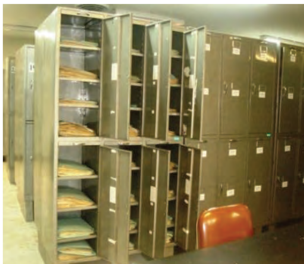
شکل ۱۵- کمد طبقه‌بندی علفهای هرز در هر بار یوم

اطلاعات لازم مربوط به علفهای هرز را روی برچسب نوشته و سپس برچسب را روی پوشه می‌چسبانند. مجموعه‌های بزرگتر در یک فایل و به همین ترتیب در کمد مخصوص چیده می‌شوند (شکل ۱۵).