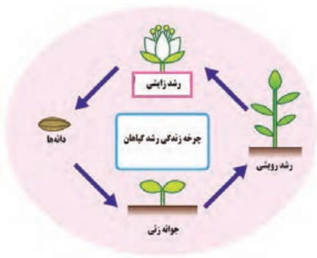
شکل ۱- نمایی شماتیک از چرخه زندگی گیاه

طول عمر یک گیاه مدت زمانی است که بذر آن جوانه زده، رشد کرده و پس از تولید مثل و بوجود آوردن بذر، از بین می‌رود. از این نظر علف‌های هرز را به سه دسته کلی: یک‌ساله‌ها، دوساله‌ها و چندساله‌ها تقسیم می‌نمایند (شکل ۱).