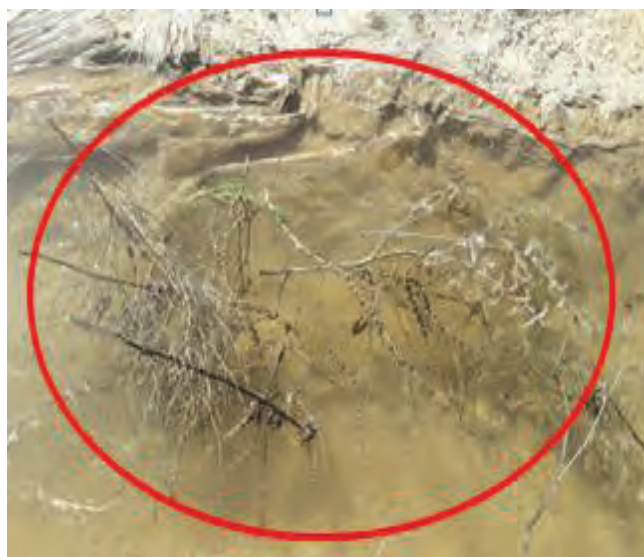
شکل ۴۴- انتشار بذر علف‌های هرز از محلی به محل دیگر توسط آب

۲- از طریق جریان آب: در حاشیه جوی‌ها و رودخانه‌ها انواع علف‌های هرز می‌روید. بذر این گیاهان داخل آب می‌ریزد. بر این اساس آب در انتشار بذر علف هرز نقش مهمی دارد. سیلاب‌های طبیعی نیز به‌طور قابل توجهی باعث پخش علف‌های هرز می‌گردند (شکل ۴۴).