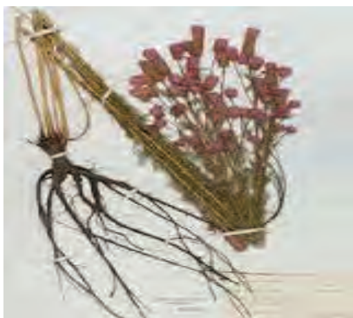
شکل ۱۴- خم کردن ساقه