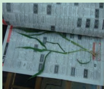
شکل ۱۶- خشک کردن نمونه علف‌های هرز منطقه

دقت کنید: در صورت عدم دسترسی به تخته مناسب، می‌توانید از ورقه‌های مقوایی ضخیم استفاده کنید.