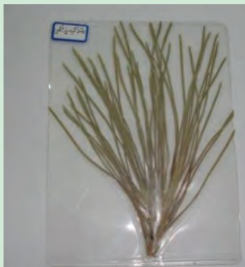
شکل ۲۰- نگهداری نمونه‌های علف هرز به روش پرس کردن در تلق