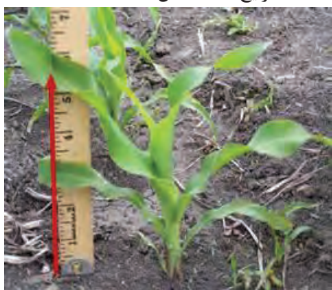
شکل ۵۲- جوانه زنی و قدکشیدن در کشت زود هنگام و بهنگام بیشتر است.