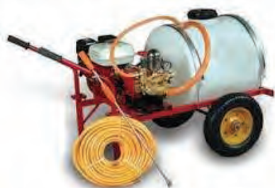
سمپاش موتوری چرخ‌دار (فرغونی)