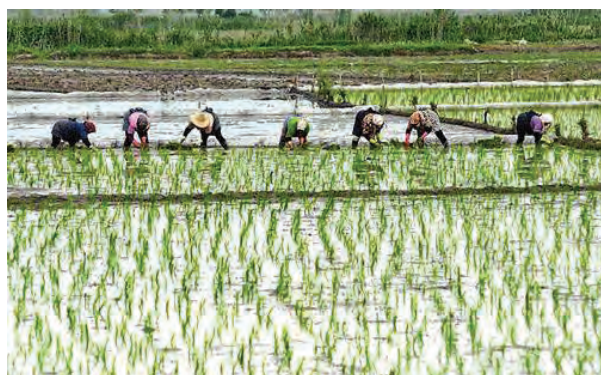
شکل ۵۳- کاشت نشاء، روشی برای غلبه بر علف‌های هرز

تغییر روش کاشت: استفاده از روش‌هایی مانند کشت تأخیری و ماخار(اجرای شخم پس از رویش علف‌های هرز) که جمعیت علف‌هرز را کاهش می‌دهد یا کشت نشاء به جای بذرکاری که گیاه اصلی را بر علف‌هرز مسلط می‌سازد(شکل ۵۳).