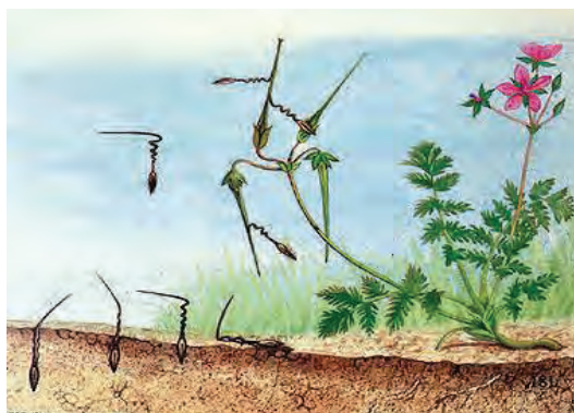
بذر نوک لک‌لکی با ساختار مته‌مانند