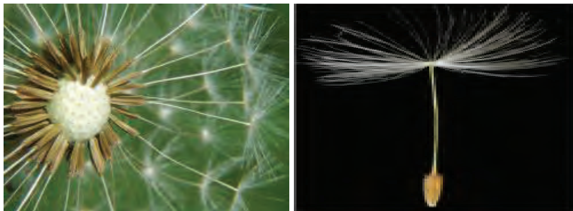
شکل ۲۷-بذر علف هرز گل قاصد با چتر جهت انتشار آسان‌تر

- خواب بذر: مجموعه بذرها در شاخه‌های متفاوت یک بوته علف هرز و حتی در قسمت‌های مختلف یک شاخه، دارای خواب متفاوت هستند و در صورت قرار گرفتن در شرایط مطلوب جوانه‌زنی، بذرها با هم جوانه نمی‌زنند. - سهولت انتشار: بذر برخی از علف‌های هرز با برخورداری از زواید و شکل‌های خاص، توانایی انتقال و انتشار بیشتری نسبت به گیاهان زراعی دارند (شکل ۲۷).