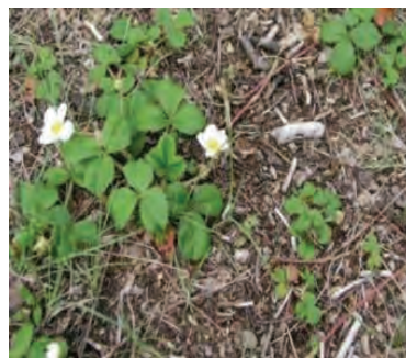
توت فرنگی وحشی (تکثیر با استولن)

شکل ۳۸- علف هرز تکثیرشونده با استولن و ریزوم