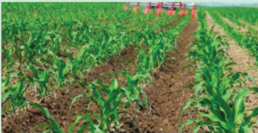
شکل ۵۸- اجرای کولتیواتور مزرعه (سله شکنی، وجین، خاکدهی پای بوته)