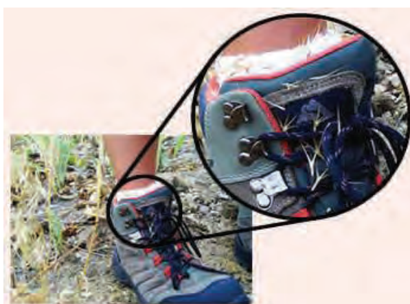
شکل ۴۶- بذر های چسبیده به کفش و لباس انسان

در منطقه یا هنرستان شما بذر کدام علف‌های هرز از طریق فرو رفتن در کفش و یا چسبیدن به لباس، منتشر می‌شوند؟