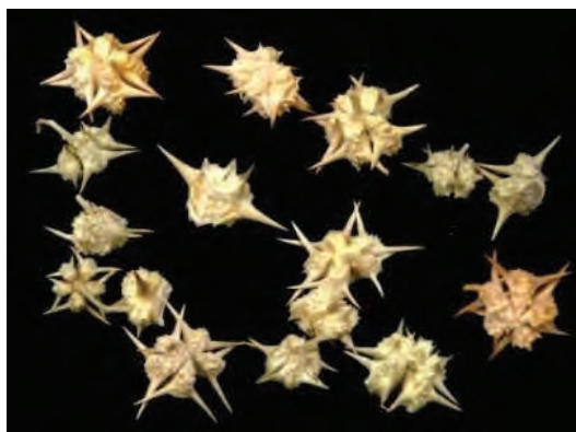
بذر خارخسک با زوائد خارمانند