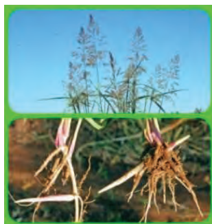
قیاق (تکثیر با ریزوم)