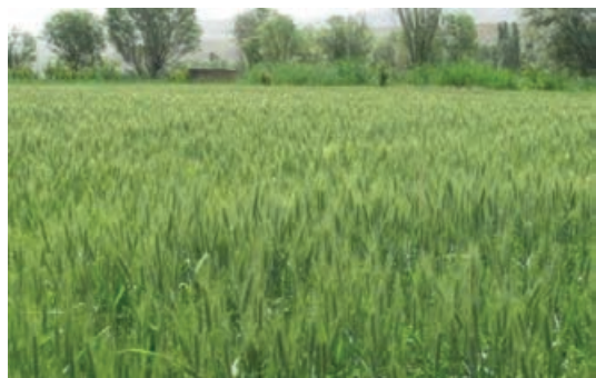
شکل ۵۰- گندم با رشد سریع خود علف‌های هرز را کنترل می‌کند.

برای هر گیاه زراعی و علف هرز، محدوده زمانی مشخصی برای جوانه زنی بهینه و رشد مطلوب وجود دارد. تنظیم زمان کاشت (زودتر یا دیرتر) در این محدوده می‌تواند در مقابله با عوامل زیان آور از جمله علف‌های هرز بسیار مؤثر باشد. این ساز و کار در زراعت پنبه، چغندر قند و ... کاملاً رایج است (شکل ۵۲).