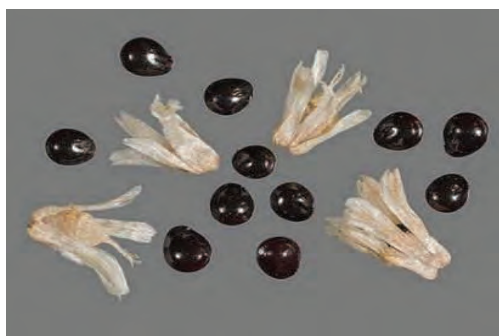
شکل ۲۴- گیاه و بذر تاج خروس

تولید بذر زیاد چه نقش و اهمیتی در پایداری و گسترش علف هرز دارد؟