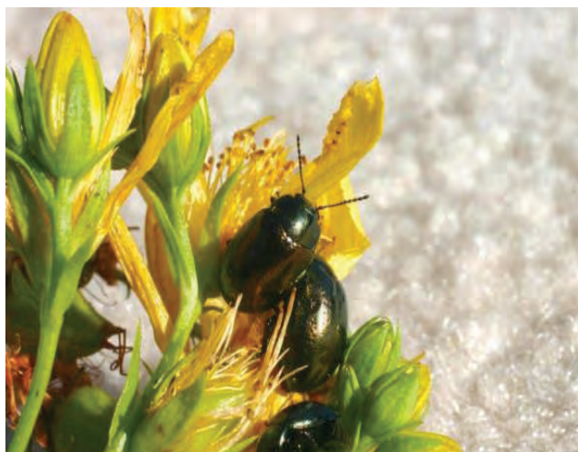
شکل ۵۴- کنترل بیولوژیک گل راعی توسط نوعی سوسک

طی سال‌های اخیر بیش از ۴۰ گونه علف هرز با استفاده از عوامل بیولوژیکی، کنترل شده‌اند. اما نقش قارچ‌ها بیش از سایر عوامل کنترل کننده بوده است (شکل ۵۴).