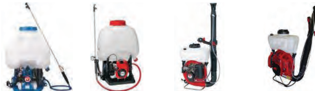
سمپاش موتوری پشتی لانس‌دار