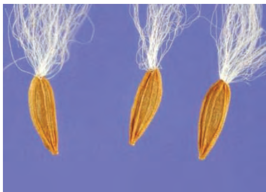
بذر شیرتیغک با زوائد چترمانند

بذرها و میوه‌های برخی از علف‌های هرز با پیدا کردن زوائد یا ساختار خاصی، برای انتشار سازگاری یافته‌اند. خار، چتر، بال، دنباله‌مته‌ای شکل و ... نمونه‌هایی از این سازگاری است (شکل ۴۲).