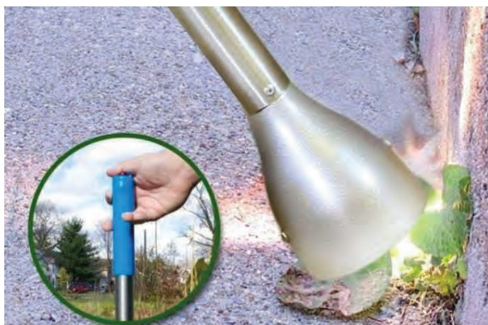
شکل ۵۹- کنترل علف‌های هرز با استفاده از شعله افکن پشت تراکتوری