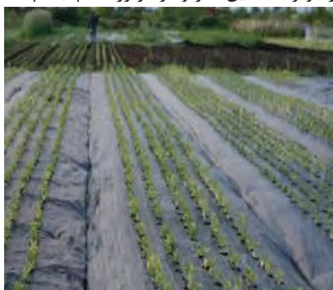
شکل ۵۱- استفاده از مالچ پلاستیکی جهت کنترل علف‌های هرز