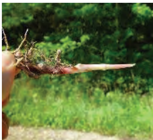
شکل ۲۸- ریزوم در علف هرز قیاق (نمونه‌ای از اندام رویشی تکثیرشونده)