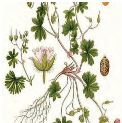
شکل ۴۱- شمعدانی وحشی

-پیاز: بعضی از علف‌های هرز نظیر پیاز وحشی از طریق پیاز تکثیر پیدا می‌کنند (شکل ۴۰). -غده: تعدادی از علف‌های هرز با استفاده از غده ازدیاد می‌یابند که از آن جمله می‌توان به شمعدانی وحشی اشاره نمود (شکل ۴۱).