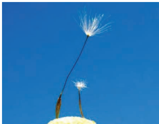
بذر گل قاصدک

۱- از طریق جریان هوا: باد عامل مهم و مؤثری برای انتشار بذر علف‌های هرز دارای زوائد بال‌مانند، (مانند ترشک) یا دارای چتر (مانند گل قاصد) می‌باشد (شکل ۴۳).