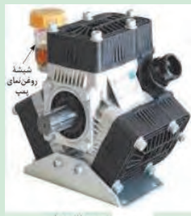
پمپ سه پاش بوم دار