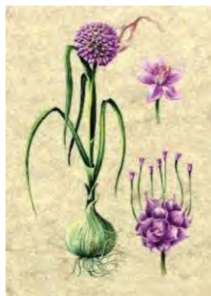
شکل ۴۰- پیاز وحشی