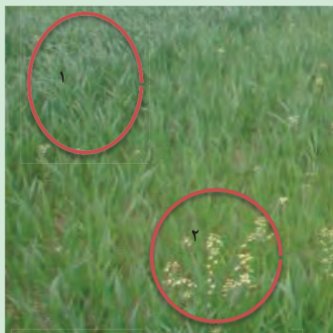
شکل ۳۴- مزرعه گندم بدون علف هرز (۱) و با علف هرز (۲)

۲- قسمتهایی از مزرعه را که فاقد علف هرز بوده یا علف‌های هرز آن ناچیز است؛ مشخص کنید (شکل ۳۴ بخش ۱). ۳- قسمتهایی از مزرعه که دارای بیشترین تراکم علف هرز هستند را هم مشخص کنید (شکل ۳۴ بخش ۲). ۴- از هر قسمت، مساحتی حدود یک مترمربع را انتخاب کنید. ۵- وضعیت رویش گیاه اصلی را در دو قسمت (بدون علف هرز و دارای علف هرز) مقایسه نمایید. دقت کنید: برای مقایسه می‌توانید از شاخص‌هایی مانند: تعداد بوته اصلی در متر مربع، ارتفاع بوته، تعداد برگ‌ها و... استفاده کنید.