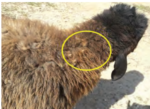
شکل ۴۵- بذر علف‌های هرز چسبیده به پشم گوسفند

۳- از طریق حیوانات: بسیاری از جانوران (اعم از وحشی و اهلی) از جمله گوسفندان از عوامل انتقال و انتشار علف‌های هرز محسوب می‌شوند. بعضی از بذرها به دلیل داشتن قلاب، کرک، خار یا دارا بودن سطحی خشن و ناهموار به بدن جانوران به ویژه آنهایی که دارای کرک و پشم هستند، می‌چسبند و از محلی به محل دیگر منتقل می‌شوند. بذرهاى جو وحشى، توك و دم روباهى نمونه‌هایی هستند که به این طریق پراکنده می‌شوند. (شکل ۴۵)