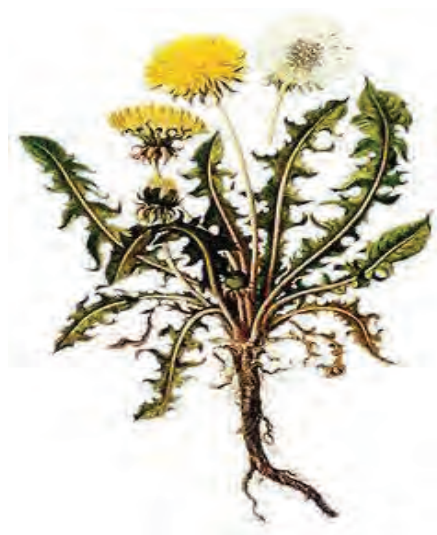
شکل ۳۶- علف هرز گل قاصد

ب) تکثیر غیر جنسی یا رویشی: در تولیدمثل غیر جنسی، اندام‌های رویشی گیاه نقش دارند. اغلب علف‌های هرز چندساله به روش غیر جنسی و تعداد کمی از آنها از طریق بذر تکثیر می‌شوند.