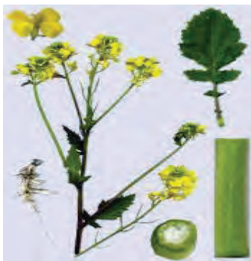
شکل ۱۸- نمونه خشک شده علف‌های هرز