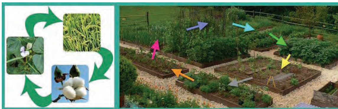
شکل ۴۹- چرخه یا تناوب زراعی

با اجرای تناوب یا چرخه زراعی، علف‌های هرزی که در زراعت‌های خاصی مثلاً چغندر قند رویش می‌نمایند، مهار خواهند شد (شکل ۴۹).