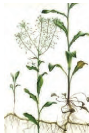
شکل ۳۹- آزمک