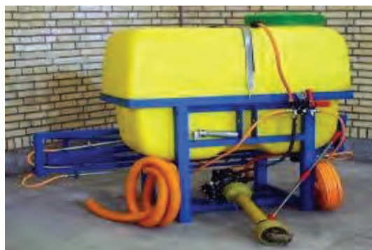
شکل ۶۴- سمپاش پشت تراکتوری بوم دار در نمای پشت(چپ) و جلو(راست)