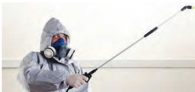
شکل ۶۱- وسایل و امکانات ایمنی جهت سمپاشی