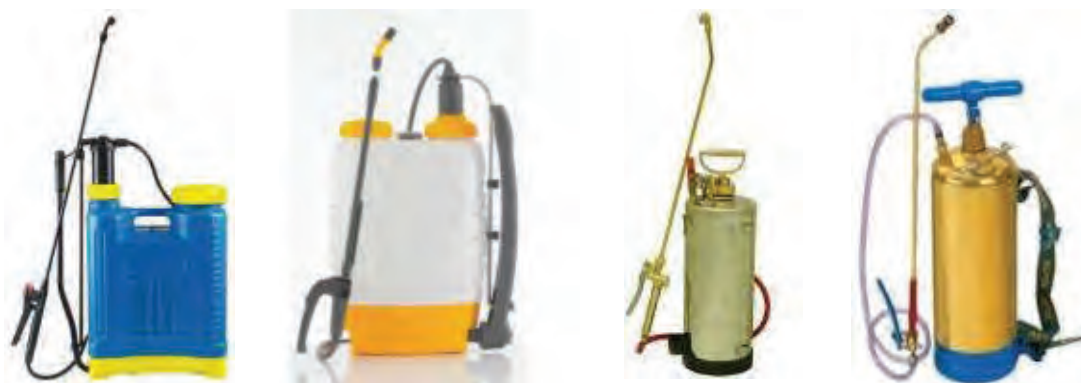
سمپاش کتابی پشتی اهرمی