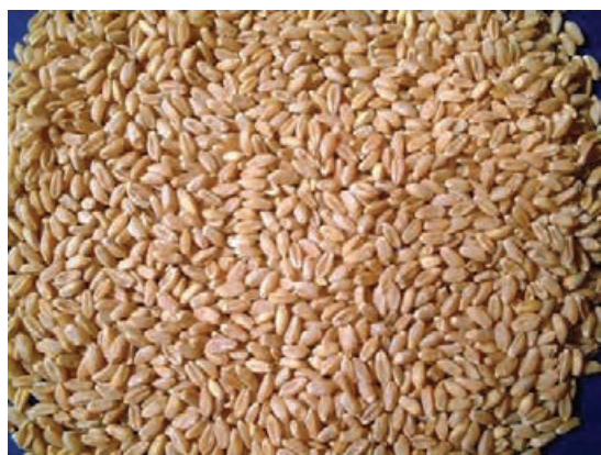
شکل ۴۸- بذر عاری از علف هرز

پیشگیری از ورود علف‌های هرز به مزرعه پیشگیری بدین معنی است که از آلوده شدن یک یا چند ناحیه جغرافیایی توسط یک علف هرز و یا افزایش جمعیت آن در یک مزرعه جلوگیری به عمل آید. در اجرای یک برنامه پیشگیری به نکات زیر باید توجه داشت: