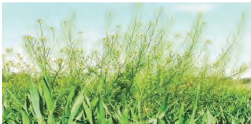
شکل ۳۰- علف هرز خاکشیر تلخ که با رشد سریع خود روی گندم سایه افکنی کرده است.

- سایه افکنی: اگر رشد علف‌های هرز مه‌نگردد، به سرعت قد کشیده و مانع از رسیدن نور مناسب به گیاه اصلی می‌گردد (شکل ۳۰).