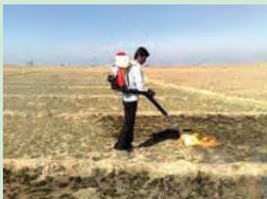
شکل ۶۰- استفاده از شعله افکن پشتی موتوری (اتومایزر) جهت شعله افکنی در کنترل فیزیکی علف‌های هرز

۱۱- مشاهدات، یافته‌ها و عملکرد خود را در دفتر گزارش کار، ثبت و ضبط کرده و برای ارایه آماده نمایید.