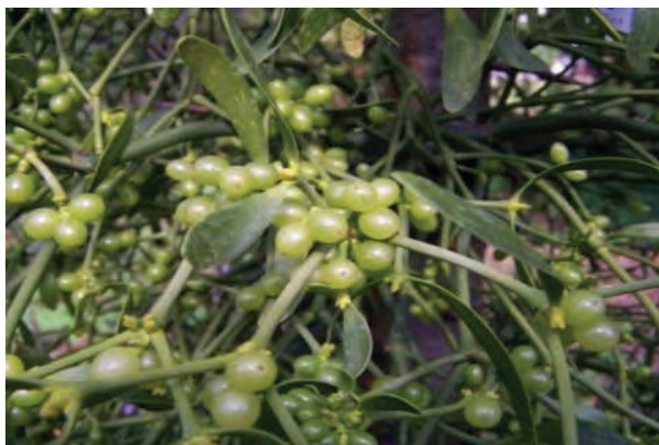
شکل ۸- علف‌های هرز نیمه انگل داروآش

گیاهانی هستند که مقداری از غذای موردنیاز خود را به طور مستقیم، تأمین نموده (به دلیل وجود مقداری سبزینه یا کلروفیل در برخی از اندام‌ها) و مقداری را از میزبان خود می‌گیرند؛ مانند داروآش که بر روی تنه درختان بزرگ، مستقر می‌شود. این گونه گیاهان آب و املاح را از میزبان گرفته و با کلروفیل خود، عمل غذاسازی را انجام می‌دهند (شکل ۸).