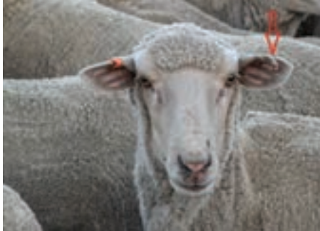
ایجاد شکاف در گوش