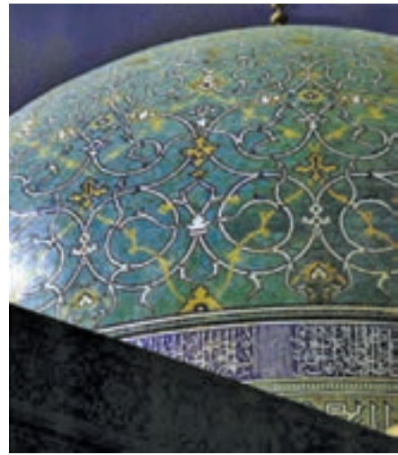
▲ شکل ۱۸-۱۲-الف - کاشی کاری هفت رنگ مسجد امام، اصفهان

هنر فلزکاری نیز دوران تحول و رشد خود را گذراند به طوری که در اواخر سده دهم ترصیع کاری با فلزات گرانبها و کتیبه‌هایی به خط نستعلیق، نوعی زیبایی چشمگیر را در این هنر پدید آورد. دوباره هنر فلزکاری احیا شد و تزیینات گل و گیاهی و اسلیمی و ختایی اهمیت ویژه‌ای در این هنر یافت (شکل ۱۹-۱۲).