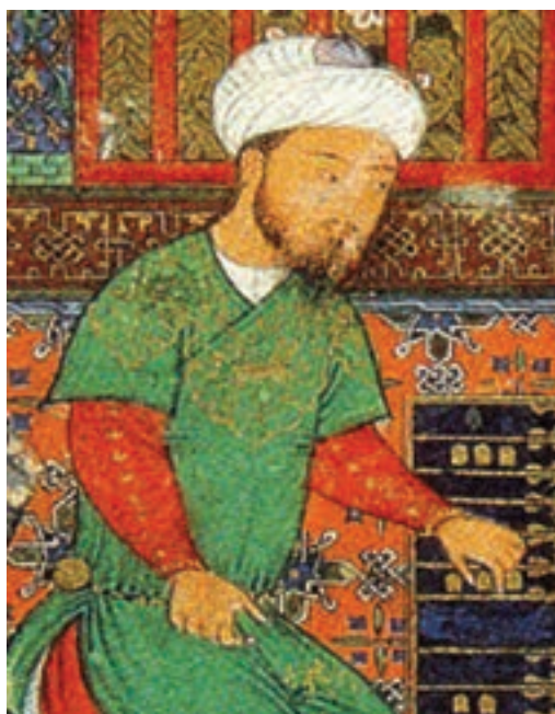
▲ شکل ۱۱-۱۳- طرح پارچه و لباس دوره تیموری (برگرفته از نگارگری)