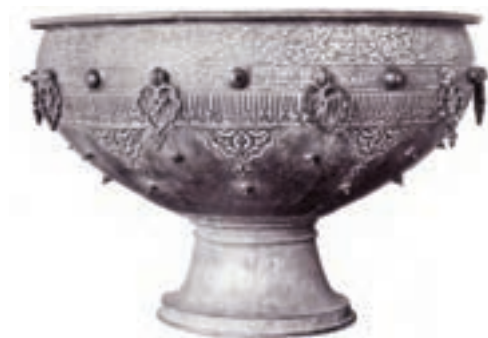
▲ شکل ۹-۱۱- ظرف فلزی