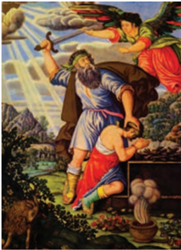
▲ شکل ۱۰-۱۲- نقاشی اثر محمد زمان