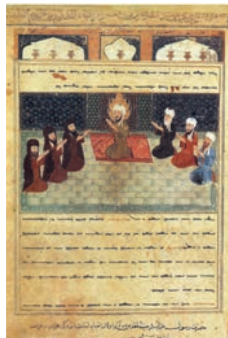
▲ شکل ۴-۱۱- برگی از کتاب معراج نامه

همانگونه که اشاره شد هنر کتابت و نگارگری در این دوره به اوج و شکوفایی می‌رسد و باعث پدید آمدن مکتب‌های کمال یافته شیراز و هرات می‌شود. مهم‌ترین تحول نگارگری در ادامه با تسلط رنگ قرمز در مکتب شیراز است. تداوم سنت هنری دوران جلایری نیز با تسلط رنگ آبی در مکتب هرات به کار می‌رود. آثار مهم تولید شده مکتب هرات در سه دوره شاه‌رخ، بایسنقر میرزا و کمال‌الدین بهزاد شامل معراج نامه (شکل ۴-۱۱) شاهنامه بایسنقری (شکل ۵-۱۱) و بوستان سعدی با نقاشی کمال‌الدین بهزاد (شکل ۶-۱۱) می‌شود. همچنین از مهم‌ترین تحولات نقاشی بعد از سده نهم هجری، رواج روزافزون تک چهره‌پردازی می‌باشد (شکل ۷-۱۱) که زمینه‌ساز نوعی مجلد به صورت مجموعه‌های نقاشی و خطاطی موسوم به مرقات ۱ است. هنر کتاب‌آرایی با به‌کارگیری جلدهای سوخت و زرکوب در این زمان، مراحل تکامل خود را می‌پیماید که آثار به‌جامانده مایه افتخار و مباهات است. ویژگی بارز نقاشی و نگارگری در این دوره ایجاد کمال تعادل در اندازه‌ها، ترکیب‌بندی و رنگ‌آمیزی فاخر است. در این نقاشی پیکره انسان در برابر معماری با منظره طبیعی به درستی جای داده شده و به آن وحدت بخشیده است. در این جا نگارگر از توان خود برای تجسم جهانی تازه بهره برده که اوج آن‌را در شاهنامه بایسنقری می‌توان دید. تداوم نگرش هنری مکتب هرات را به گونه‌ای دیگر در مکتب ترکمانان و مکتب تبریز در دوره صفوی به دلیل حضور بهزاد و همچنین مکتب بخارا به دلیل حضور شاگردان بهزاد به خوبی می‌توان دید.