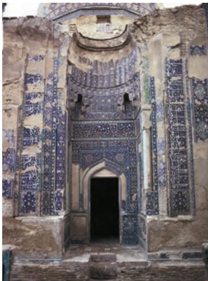
▲ شکل ۱۱-۱۱- کاشی‌کاری، مسجد کبود، تبریز

پارچه‌های ظریف و با کیفیت بسیار بالا را تنها می‌توان در دیگر آثار هنری از جمله نگارگری یافت. با این حال براساس این نمونه‌های غیر مستقیم از فن پارچه‌بافی دلیلی بر وجود کیفیت بالای پارچه در این دوره است. هر چند که ممکن است نقاش و نگارگر براساس سلیقه خود یا هماهنگی در تصویر در رنگ‌آمیزی آنها دخل و تصرف انجام داده باشد (شکل ۱۱-۱۳).