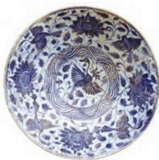
▲ شکل ۱۱-۱۲- ظرف آبی و سفید، سده ۹ هجری، شرق ایران