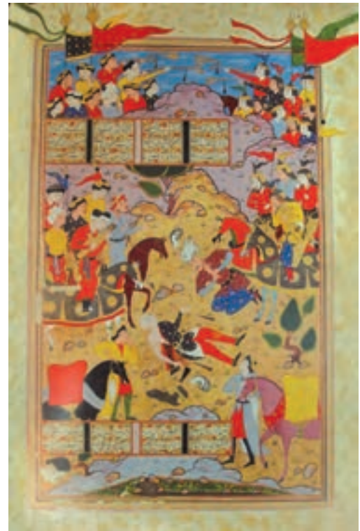
▲ شکل ۷-۱۲- برگی از شاهنامه قوام

در میانه سده یازدهم هجری با انتخاب اصفهان به عنوان پایتخت صفوی تحولی نیز در عرصه نگارگری ایجاد شد. شیوه مستقل رضاعباسی ۱ (مکتب اصفهان) با گرایش واقع‌نگاری و تأکید بر قلم‌گیری شکل گرفت. رویکرد تجارت جهانی و حضور هنرمندان هلندی و اروپایی، تأثیر به‌سزایی بر هنرهای بصری این دوره داشت. هرچند که هنر ایرانی در دوره صفویه توانست سهم بسزایی را در هنر گورکانی (مغولان هند)، کشمیر (هند) و عثمانی (ترکیه) بگذارد اما خود نیز تحت تأثیر هنر اروپایی قرار گرفت و نوعی هنر به‌عنوان فرنگی‌سازی در ایران رایج شد (شکل ۹-۱۲).