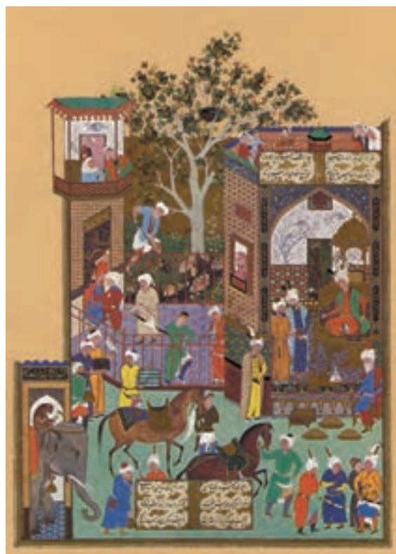
▲ شکل ۵-۱۲- برگه از شاهنامه شاه طهماسبی

در اواخر سده دهم (۹۴۷ هـ.) با حضور مکتب هنری قزوین، هنرمندان درباری، بیشتر به دیوارنگاری گماشته شدند. از این رو برخی از هنرمندان به دلیل رویکرد تجاری و سفارش‌دهندگان معمولی رو به تولید مرقعات آوردند. به همین دلیل سنت کتاب‌آرایی به میزان اندکی رو به ضعف گذاشت. در مکتب قزوین با تغییر و تحول سبک مشهد روبه‌رو هستیم. در این دوره هنری، کاهش تنوع رنگ و پیکره‌ها در نگارگری پدید می‌آید. با این وجود همچنان سنت شاهنامه‌نگاری (شکل ۷-۱۲) وجود دارد. دیوارنگاری در دیگر اماکن نیز تحولی در دوره‌های بعد پدید می‌آورد (شکل ۸-۱۲). تا این دوره معمولاً خوشنویسان آثار خود را رقم (امضا) می‌زدند اما به دلیل ارزش یافتن مقام نقاش تحولی در برابری میان صاحبان قلم (نویسندگان و خوشنویسان) و قلم‌مو (نقاشان) ایجاد شده و نگارگران نیز آثار خود را رقم می‌زدند. این سنت از جُنید در دوره جلایری به بعد مرسوم شده بود.