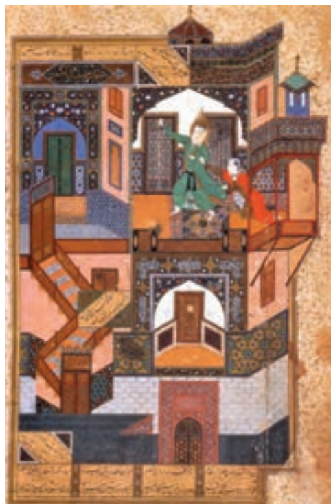
▲ شکل ۶-۱۱- برگی از کتاب بوستان سعدی، اثر بهزاد