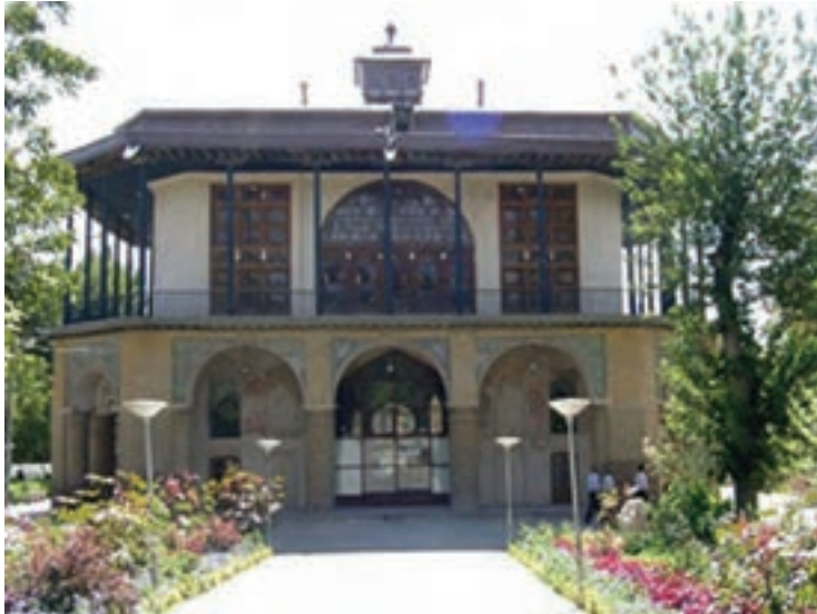
▲ شکل ۸-۱۲- عمارت چهلستون، قزوین