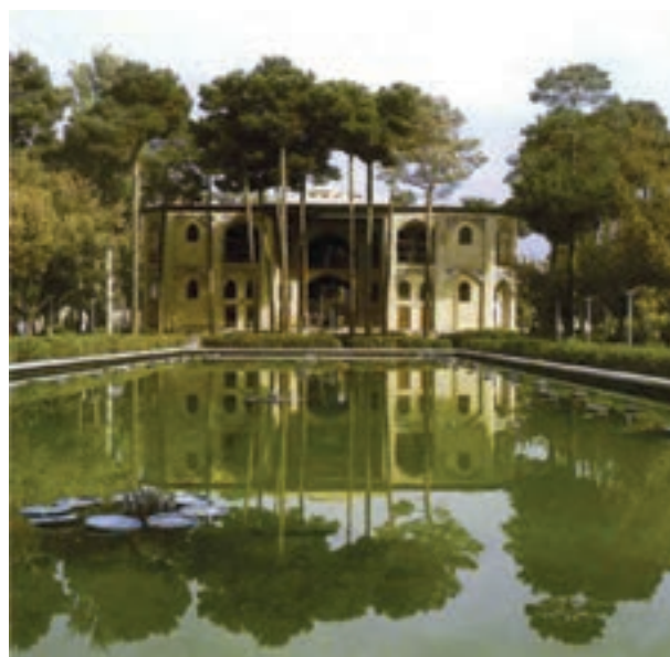
▲ شکل ۴-۱۲- کاخ هشت بهشت، اصفهان

دوره صفویه ابتدا با حضور کمال‌الدین بهزاد (از استادان برجسته مکتب هرات) که به سرپرستی کتابخانه سلطنتی در تبریز منسوب شده بود توانست موقعیت هنری خود را تثبیت کند. پس از بهزاد، شاگردان وی این مسئله مهم را پی‌گرفتند. این دوره هنری، تلفیق سنت‌های مکتب هرات و ویژگی محلی تبریز بود که توسط سلطان محمد انجام گرفت. رنگ طلایی در آن بیش از حد استفاده می‌شد و بیشتر موضوعات نقاشی را موضوعات درباری و گاهی موضوعات عادی دربر می‌گرفت.