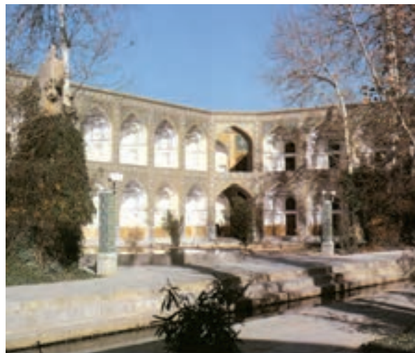
▲ شکل ۲-۱۲- مدرسه چهار باغ، اصفهان

بناهای دینی در این دوران با کاشی‌های زیبا و نقش گل و بوته به شکلی چشم‌نوازترین می‌شد که دلالت بر خوش ذوقی و عشق به هنر است. سبک معماری این دوره که بیشتر در اصفهان خودنمایی می‌کرد به شیوه‌های متفاوت در تجربیات هنری گوناگون از جمله کاخ‌سازی، راهسازی، شهرسازی و مکان‌های عمومی، توجه داشت. آثار منحصر به فردی از بناهای غیردینی نظیر کاخ چهل ستون، هشت بهشت (شکل ۴-۱۲)، بازارها و کاروانسراها در شهرهای بزرگ و راه‌های اصلی بازرگانی و تجارت، ایجاد شد.