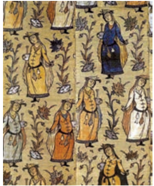
▲ شکل ۱۵-۱۲- پارچه بانقش نگارگری، دوره صفویه