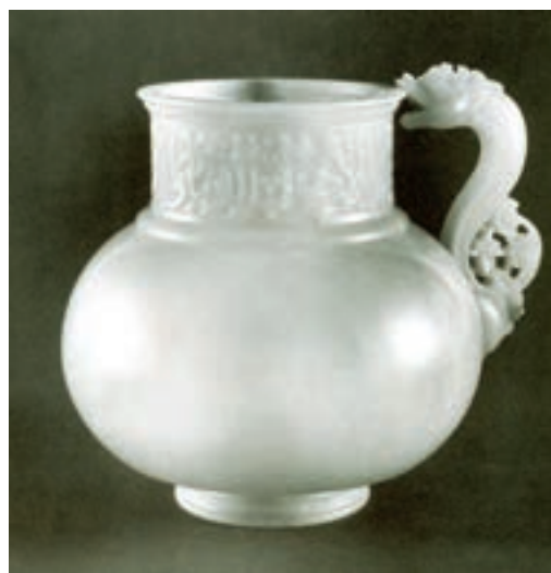
▲ شکل ۱۰-۱۱- ظرف سنگی