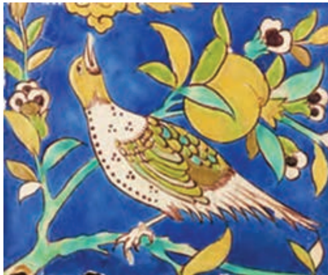
▲ شکل ۱۷-۱۲- نقش کاشی هفت رنگ، دوره صفویه

در دوره صفوی علاوه بر کاشی معرق، از نوعی کاشی هفت رنگ ۱ برای سرعت بخشیدن در تکمیل تزئین دیوار بناها استفاده می‌شد (شکل ۱۸-۱۲ الف و ب). نقوش به کار رفته در این کاشی‌ها غالباً نقوش اسلیمی و ختایی با رنگ‌های متنوع لاجوردی، آبی، سفید، زرد اُکر، سیاه، قهوه‌ای و سبز بودند.