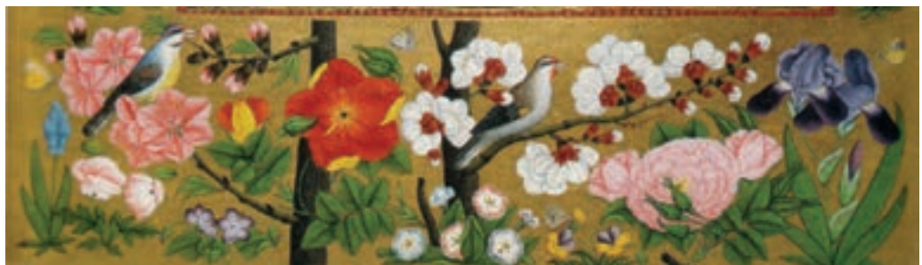
▲ شکل ۱۱-۱۲- گل و مرغ

منسوجات با وجود پیشینه بسیار غنی در این دوره به نیمه اول سده دهم هجری باز می‌گردد که زمینه‌ساز تولید فرش‌هایی مانند فرش‌های اردبیل (شکل ۱۲-۱۲) و فرش‌های اصفهان شد. غنای فرش‌های تولید شده به دلیل کاربرد طرح‌های اسلیمی، ختایی، شمشه‌ها و ... با الیاف ابریشم است (شکل ۱۲-۱۳). همچنین وجود ابریشم فراوان در این دوره، زمینه‌ساز تولید پارچه‌های نفیس از جمله زربفت بود (بسیار مورد توجه دربار بوده). این پارچه‌ها با زمینه رنگی و از تار و پود طلا بافته می‌شد. نقش گل‌ها از ابریشم براق با رنگی نزدیک به متن بود و در آن از طرح‌های نگارگری نیز بهره می‌بردند (شکل ۱۲-۱۴). فن بافت نیز با بافت پارچه‌های مخمل همراه با طرح گل و بوته برجسته و تافته براق با نخ‌های چند تایی (چند نخ تابیده در هم) تحول اساسی یافت. ایجاد طرح‌های نگارگری در