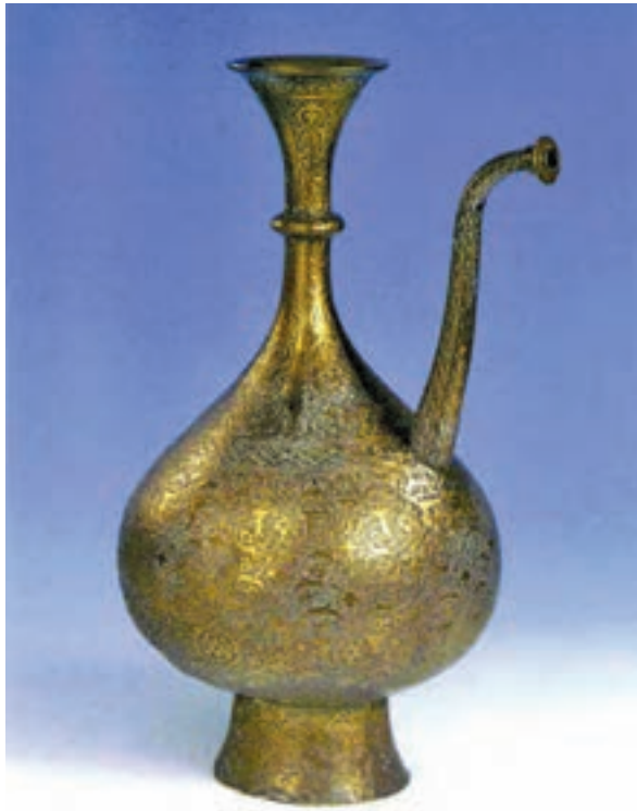
▲ شکل ۱۹-۱۲ - ظرف فلزی

هنر فلزکاری نیز دوران تحول و رشد خود را گذراند به طوری که در اواخر سده دهم ترصیع کاری با فلزات گرانبها و کتیبه‌هایی به خط نستعلیق، نوعی زیبایی چشمگیر را در این هنر پدید آورد. دوباره هنر فلزکاری احیا شد و تزیینات گل و گیاهی و اسلیمی و ختایی اهمیت ویژه‌ای در این هنر یافت (شکل ۱۹-۱۲).