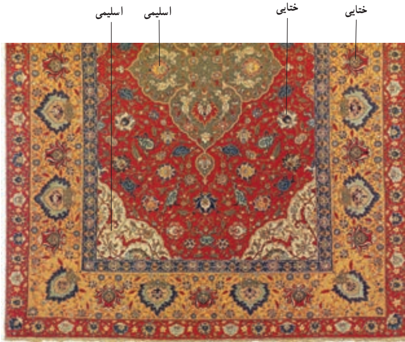
▲ شکل ۱۳-۱۲- بخشی از قالی با نقش‌های اسلیمی و ختایی