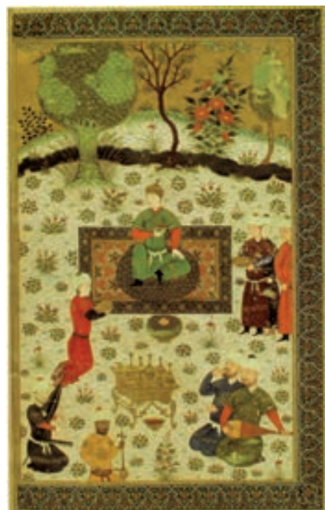
▲ شکل ۵-۱۱- برگی از شاهنامه بایسنقری