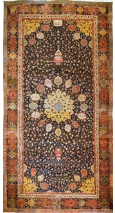
▲ شکل ۱۲-۱۲- فرش اردبیل

بافت پارچه، کاری بسیار دشوار بود ولی هنرمندان یزدی و کاشانی در این زمینه ابداعات و نوآوری‌های زیبایی پدید آوردند (شکل ۱۵-۱۲).