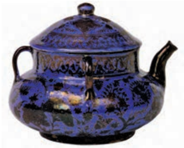
▲ شکل ۱۶-۱۲- ظرف کوباجه‌ای (بدل چینی)