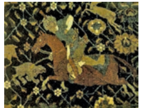
▲ شکل ۱۴-۱۲- نقش پارچه، دوره صفویه

زیرا ظروف چینی تولید شده در ایران دارای جداره‌ای نازک، ظریف و نیمه شفاف بود که تا پایان سده سیزدهم هجری نیز رواج داشت. در این دوره تمامی روش‌های شکل‌دهی و تزئین مانند روش‌های زیررنگی، رورنگی (ظروف مینایی)، زرین فام و روش تزئین هفت رنگ رایج بود (شکل ۱۷-۱۲).