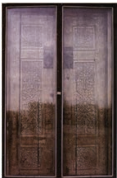
▲ شکل ۸-۱۱- در چوبی، بقعه احمد یَسوی

با گسترش روابط میان ایران و چین و نیاز روزافزون به آثار سفالین، ساخت محصولات از قبیل چینی‌های آبی و سفید و تک‌رنگ در برخی از کارگاه‌های سفالگری ایران آغاز می‌شود. آثار مورد توجه در این دوره بیشتر شامل نمونه‌هایی با قلم‌گیری تیره در زیر لعاب شفاف فیروزه‌ای و سبز یا به صورت نقاشی با رنگ‌های مختلف در زیر لعاب شفاف بی‌رنگ بود. برخی نیز به صورت نقاشی زرین فام ۱ بودند که در قالب اشیاء تزئینی و کاربردی، و کاشی به کار می‌رفتند (شکل ۱۰-۱۱).