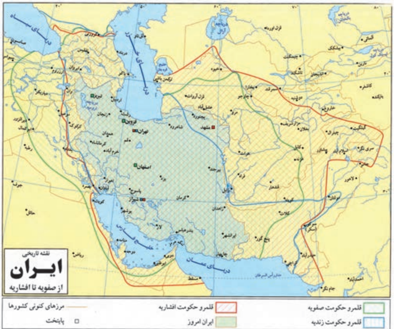
▲ نقشه سده دهم تا دوازدهم هجری