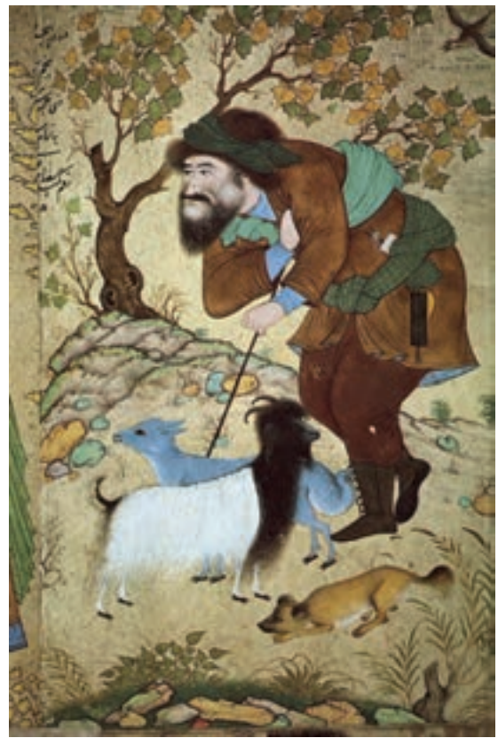
▲ شکل ۹-۱۲- نقاشی اثر رضا عباسی