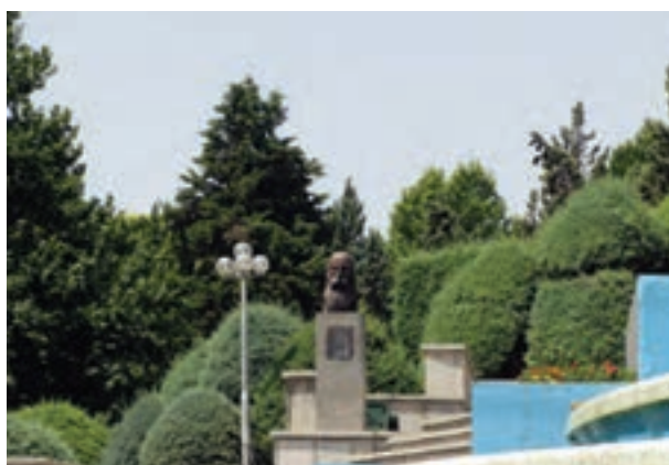
تصویر ۴-۶- لنز نرمال