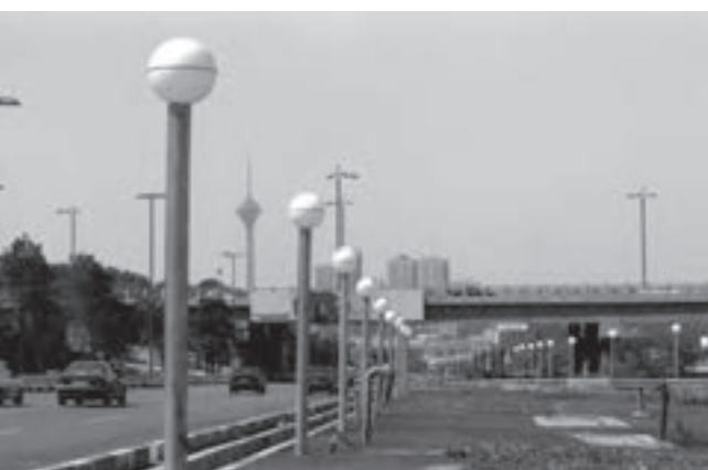
تصویر ۶-۲۲- لنز نرمال

تصاویر ۶-۲۱، ۶-۲۲ و ۶-۲۳ تنها لنزهای نرمال هستند که تصویری بسیار شبیه به آنچه که با چشم می‌بینیم در اختیار ما می‌گذارند و لنزهای واید تصاویری خلق می‌کنند که به دلیل پرسپکتیو ویژه آن‌ها پیرانرژی‌تر به نظر می‌رسند. و بر عکس لنزهای تله به دلیل زاویه بسته شان معمولاً عناصر کمتری را در عکس جای داده و تصاویرشان به نوعی آرام‌تر به نظر می‌رسد. تصاویر صفحه بعد این ویژگی را نشان می‌دهند (تصاویر ۶-۲۴ تا ۶-۲۶).