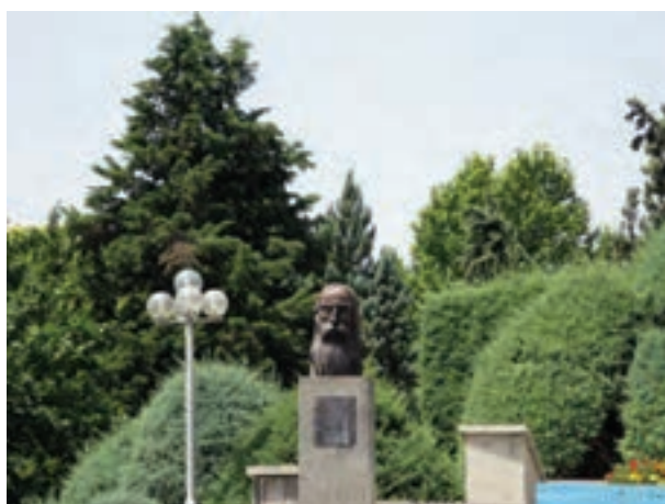
تصویر ۵-۶- لنز تله