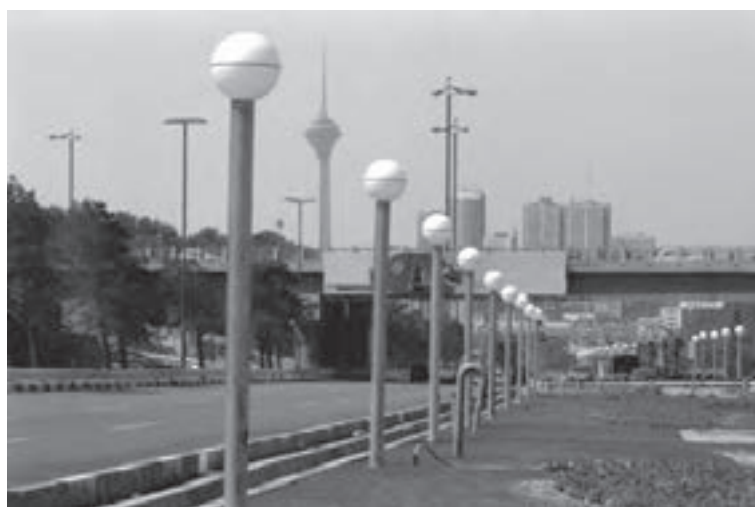
تصویر ۶-۲۳- لنز تله