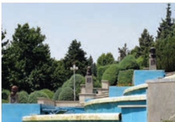
تصویر ۳-۶- لنز واید