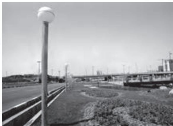
تصویر ۶-۲۱- لنز واید