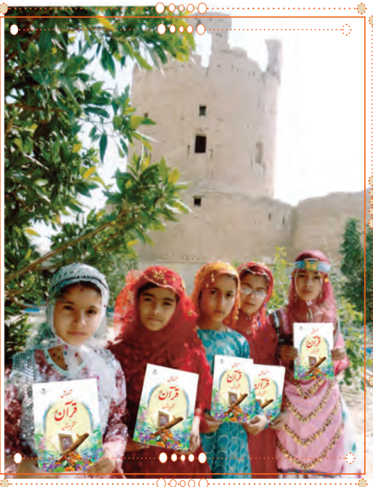
انسان با قرآن کریم در استان هرمزگان