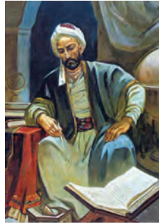
خواجه نصیرالدین طوسی (ریاضی‌دان، منجم، اندیشمند و سیاستمدار برجسته)