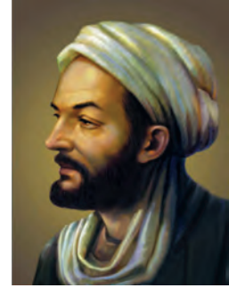
ابوعلی سینا (فیلسوف و پزشک بزرگ مشرق زمین)