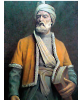
حکیم ابوالقاسم فردوسی (شاعر نامدار)

فعالیت: این پیام قرآنی را در قرآن کریم پیدا کنید و آن را یک بار دیگر بخوانید.