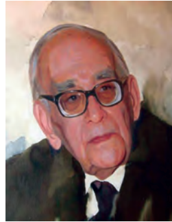
پرفسور سید محمود حسایی (پدر علم فیزیک ایران)