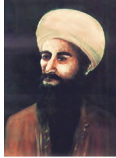
جابرین حیّان (پدر علم شیمی)