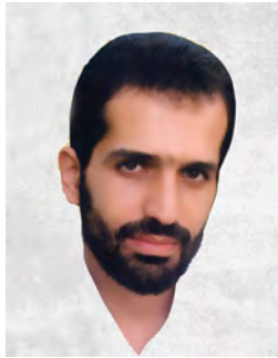
شهید مصطفی احمدی روشن (دانشمند انرژی هسته‌ای)