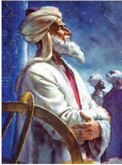
ابوریحان بیرونی (ریاضی‌دان و منجم)

به کمک تصویر با دوستان خود درباره‌ی این پیام قرآنی گفت‌وگو کنید.