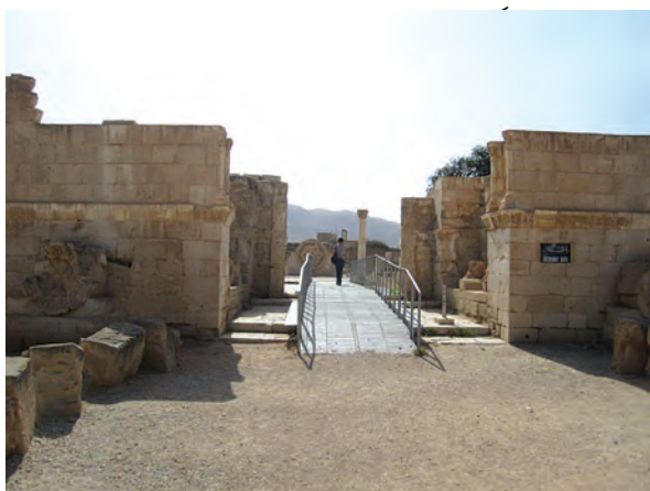
بقایای کاخ هشام بن عبدالملک در اربعا

درباره ارتباط مشروعیت و مقبولیت نداشتن حکومت‌ها با توسل آنها به زور و خشونت گفت‌وگو نمایید.