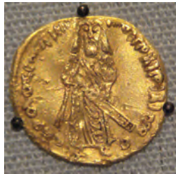
نمونه‌ای از سکه‌های دوره امویان