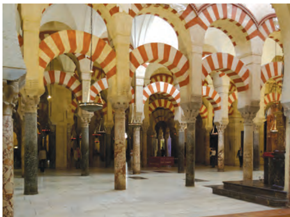
مسجد جامع قرطبه

شکوفایی معماری: اندلس اسلامی در عرصه معماری نیز می‌لایون‌ها گردشگر را از اقصی نقاط جهان جلب می‌کنند. بسیار شکوفا بود. مسجد جامع قرطبه و کاخ الحمراء غرناطه، نمونه‌های شگفت‌انگیز دیگری نیز از معماری شکوهمند دو شاهکار معماری جهان اسلام به شمار می‌روند که سالانه مسلمانان اندلسی بر جای مانده است.