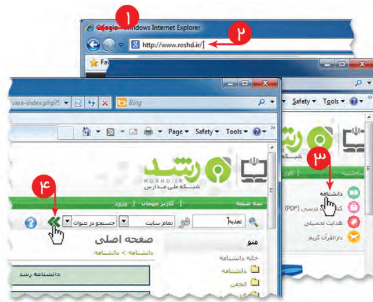
شکل ۷-۲- جست و جو مطلب در وبگاه شبکه رشد

برای درک اهمیت تغذیه در دوران نوجوانی می‌توانید مطالب مفیدی از وبگاه شبکه رشد جمع‌آوری کنید. برای انجام این کار فیلم «جست و جو در وبگاه رشد» را مشاهده کنید.