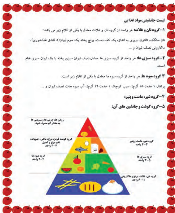
شکل ۶-۲- لیست جانشینی مواد غذایی

پس از مشاهده فیلم «نوشتن متن در رایانه» و «درج تصویر»، شکل ۶-۲ را در برنامه واژه‌پرداز (Word) ایجاد کنید.