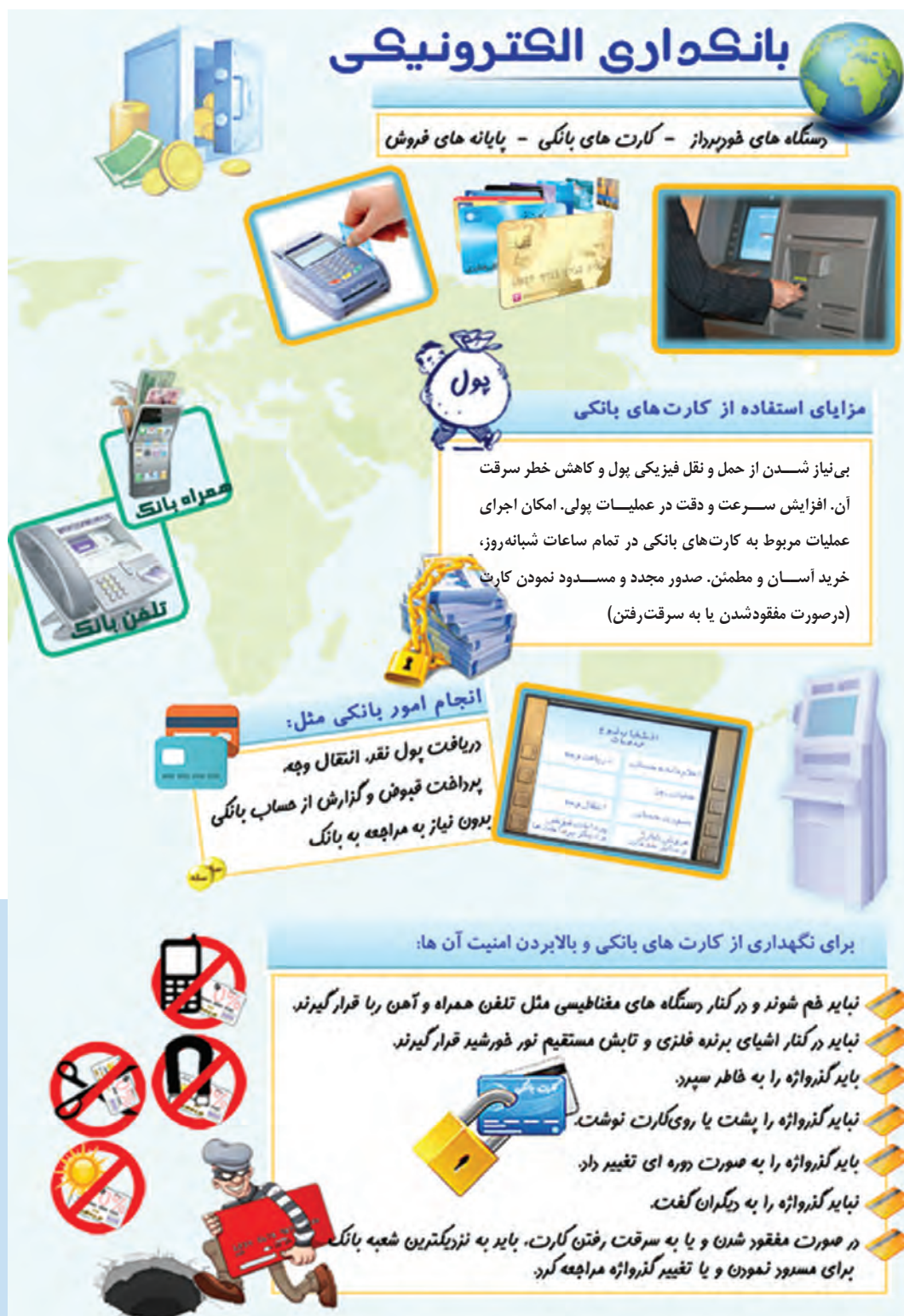
شکل ۱-۲- بانکداری الکترونیکی