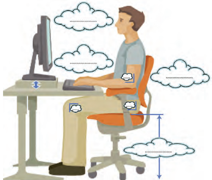
شکل ۵-۲- چگونه بنشینن درست هنگام کار با رایانه

در شکل ۵-۲ جاهای خالی را با عبارات مناسب پر کنید.