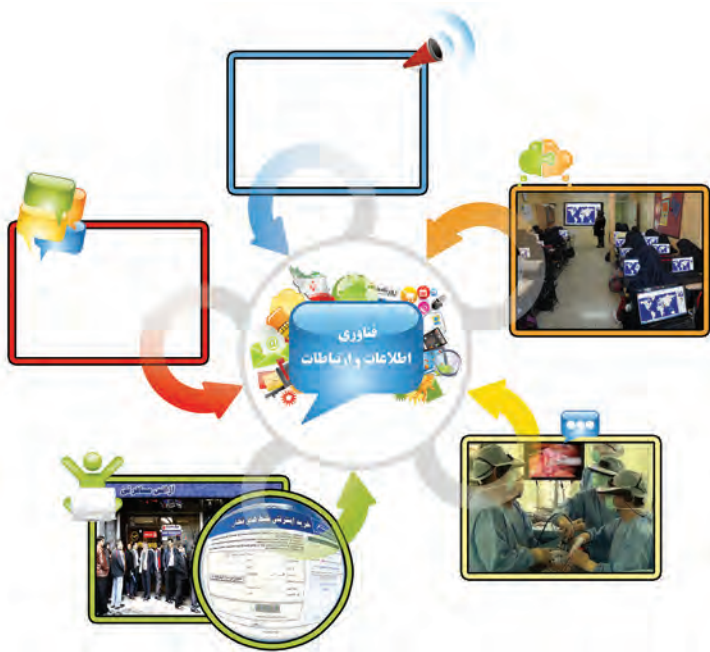
شکل ۲-۳- تأثیرات فناوری اطلاعات و ارتباطات

فناوری اطلاعات و ارتباطات در زندگی امروزی ما نقش بسیار مهمی دارد. برخی از این تأثیرات را در شکل ۲-۳ می‌بینید.