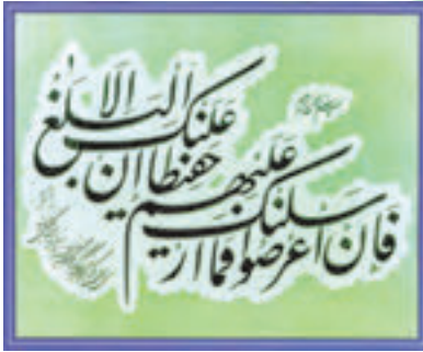
سوره شوری آیه ۴۸

پس از پیروزی انقلاب اسلامی، به دلیل درخواست‌های مکرر قرآن دوستان و قرآن پژوهان، رسانه‌های متنوع قرآنی در کشور ایجاد شده و رشد خوبی داشته است. برای آشنایی و استفاده شما دانش‌آموزان عزیز برخی از این رسانه‌ها معرفی می‌شود.