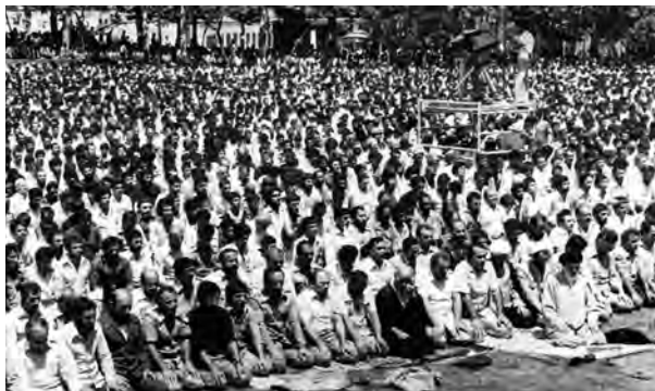
اقامة نخستین نماز جمعه تهران به امامت آیت‌الله طالقانی در دانشگاه تهران

کمی بعد از آن، جوانان شجاع و مبارز ایرانی سپاه پاسداران انقلاب اسلامی را به وجود آوردند تا از آرمان‌ها و دستاوردهای انقلاب پاسداری کند. جهاد سازندگی نیز برای عمران، آبادانی و رفع فقر و محرومیت از روستاها شکل گرفت. همچنین، کمیته امداد امام خمینی برای حمایت از محرومان و مستضعفان و نهضت سوادآموزی با هدف ترویج فرهنگ سوادآموزی و کاهش و رفع