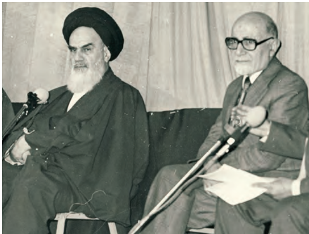
مهندس مهدی بازرگان، رئیس دولت موقت انقلاب، در کنار امام خمینی علیه السلام

این همه‌پرسی روزهای ۱۰ و ۱۱ فروردین ۱۳۵۸ برگزار شد و نتیجه آن که در ۱۲ فروردین اعلام شد، نشان داد که بیش از ۹۸ درصد شرکت‌کنندگان به جمهوری اسلامی رأی مثبت داده‌اند. به همین دلیل، ۱۲ فروردین در تقویم به عنوان روز جمهوری اسلامی نام‌گذاری شده است.