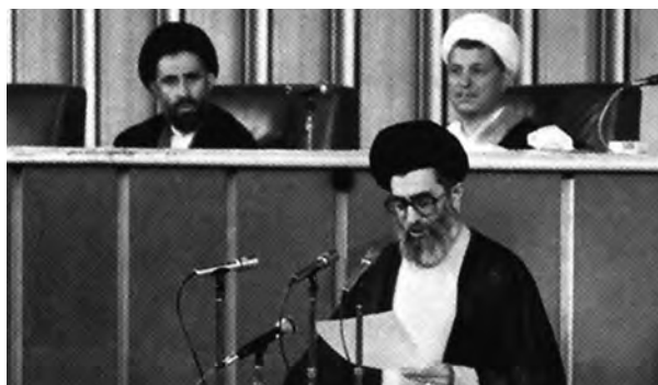
حضرت آیت‌الله خامنه‌ای هنگام خواندن وصیت‌نامه حضرت امام در مجلس خبرگان - ۱۴ خرداد ۱۳۶۸

حضرت آیت‌الله خامنه‌ای از ابتدای نهضت تا زمان پیروزی انقلاب اسلامی به عنوان شاگرد و پیرو حضرت امام خمینی علیه‌السلام حضور و نقش فعالی در مبارزه با رژیم پهلوی داشتند؛ از این رو، بارها دستگیر، زندانی و تبعید شدند. ایشان در دوران جمهوری اسلامی و در شرایطی که کشور گرفتار توطئه‌های پیچیده دشمنان خارجی و ضد انقلاب داخلی و نیز جنگ تحمیلی بود، همچون یابوری بصیر و ثابت قدم در خدمت انقلاب و حضرت امام بودند و مسئولیت‌های خطیری را عهده‌دار شدند که از جمله آنها دو دوره ریاست جمهوری است. معظم‌له در تیر