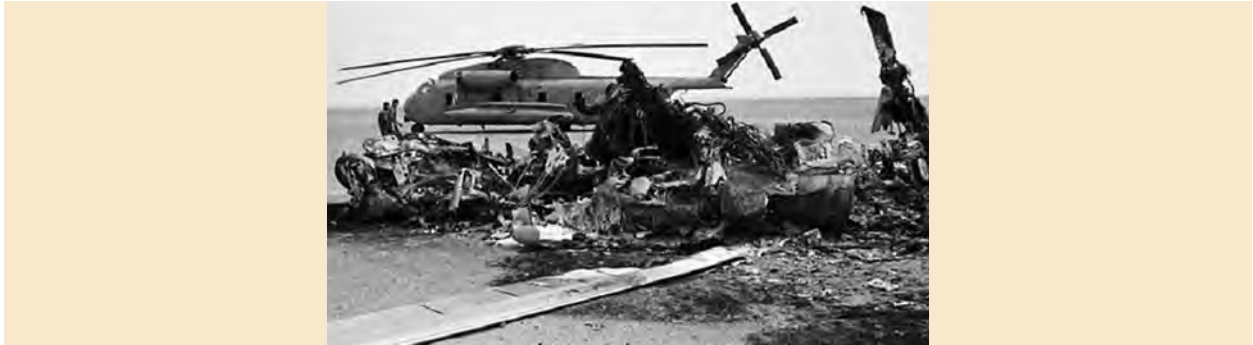
بقایای لاشه هواپیماها و بالگردهای آمریکایی در طبرس

پس از اینکه دانشجویان پیرو خط امام سفارت آمریکا در تهران را تسخیر و اعضای سفارت را بازداشت کردند، دولتمردان آمریکایی در شرایط دشواری قرار گرفتند. از این رو، آمریکا با طراحی یک عملیات پیچیده نظامی، اقدام به پیاده کردن نیروهای ویژه خود در صحرای طبرس کرد (۵ اردیبهشت ۱۳۵۹). مأموریت این گروه زبده نظامی، تسخیر چند مرکز در تهران و خارج کردن آمریکاییان بازداشتی از ایران بود اما با عنایت خداوند، وقوع توفان شن و کاهش دید خلبانان آمریکایی باعث سقوط چند فروند بالگرد نظامی و کشته شدن تعدادی از نیروهای مهاجم شد. بقیه نیز با به جا گذاشتن بخشی از تجهیزات، اسناد و مدارک مجبور به فرار شدند. ۱