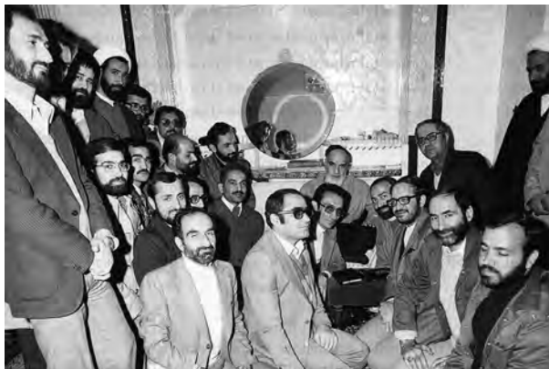
اعضای هیئت دولت شهید محمدعلی رجایی در دیدار با حضرت امام (ره)

با تدوین و تصویب قانون اساسی، زمینه برای برگزاری انتخابات ریاست جمهوری و مجلس شورای اسلامی و تشکیل دولت دائم فراهم آمد. ابتدا انتخابات ریاست جمهوری (بهمن ۱۳۵۸) انجام شد و ابوالحسن بنی‌صدر به عنوان نخستین رئیس جمهوری اسلامی ایران انتخاب گردید. با فاصله کوتاهی انتخابات مجلس شورای اسلامی نیز برگزار شد (اسفند ۱۳۵۸).