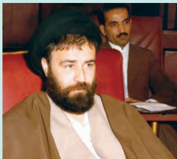
حاج سید احمد آقا خمینی

۱۳۶۰، هدف حملهٔ تروریستی مجاهدین خلق قرار گرفتند که به شدت جراحت برداشتند و به شرف جانبازی انقلاب اسلامی نایل آمدند. خبرنگاران ملت بر اساس چنین ویژگی‌ها و سوابقی، ایشان را برای رهبری انقلاب اسلامی، صالح، شایسته و لایق تشخیص دادند.