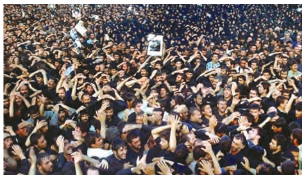
نمایی از تشییع جنازه میلیونی امام خمینی علیه‌السلام

امام خمینی در شامگاه ۱۳ خرداد ۱۳۶۸ بعد از یک دوره بیماری در ۸۷ سالگی از دنیا رفتند. خبر ارتحال حضرت امام را یادگار گرامی ایشان حجت‌الاسلام سید احمد خمینی صبح روز بعد به اطلاع مردم ایران و جهان رساند. دو روز بعد، پیکر مطهر امام شهیدان در میان حزن و اندوه میلیون‌ها نفر از تشییع‌کنندگان در بهشت زهراي تهران به خاک سپرده شد. بلافاصله پس از رحلت بنیان‌گذار جمهوری اسلامی ایران، مجلس خبرگان رهبری تشکیل جلسه داد و با اکثریت قریب به اتفاق آرا، حضرت آیت‌الله سید علی خامنه‌ای را به دلیل داشتن شرایط و ویژگی‌های مندرج در اصل یکمصد و نهم قانون اساسی ۱ به مقام رهبری برگزید (۱۴ خرداد ۱۳۶۸).