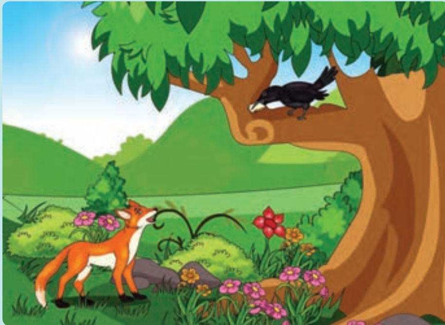
شکل ۳- قصه زاغک و روباه

فعالیت ۵: همه قصهٔ پند آموز ۱ زاغک و روباه را شنیده یا خوانده‌اید. جملات روباه تحسین بود یا تشویق؟ در این مورد گفت‌وگو کنید.