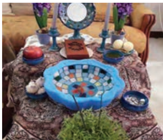
شکل ۱- آداب و رسوم

فعالیت ۱: با توجه به تصاویر بالا راجع به سؤالات زیر در گروه‌های خود گفت‌وگو کنید و نتیجه را در کلاس ارائه دهید.