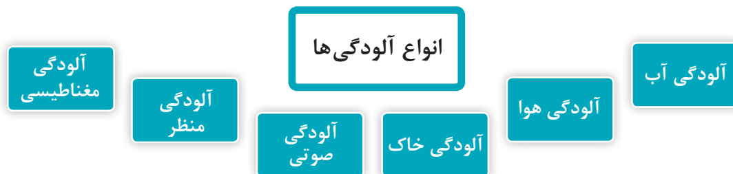
نمودار ۵- انواع آلودگی های محیط زیست

انواع آلودگی های محیط زیست در نمودار ۵ نشان داده شده است.