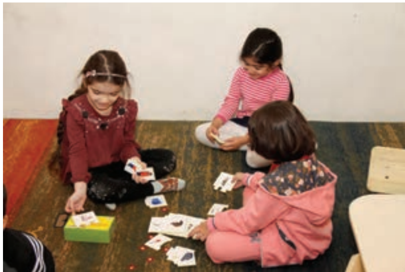
شکل ۳- بازی های گروهی

فعالیت ۷: با هم گروه های خود فهرستی از بازی های مشارکتی کودکان تهیه و یکی از آنها را در کلاس اجرا کنید. برای مثال، با درست کردن کاردستی به کمک کودک می توان، انواع آداب اجتماعی را به او آموزش داد؛ یا با مقوا یک چراغ راهنمایی و چند تابلوی راهنمایی رانندگی، درست کرد. با استفاده از چند ماشین کوچک، بازی رعایت قانون و مقررات و رعایت حق دیگران را نیز می توان به او یاد داد. این فعالیت را می توانید با کودکان انجام دهید.