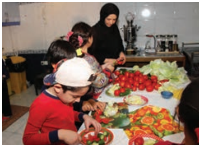
شکل ۴- همکاری و مشارکت کودک در انجام فعالیت‌های روزمره

کودک ممکن است در رفتارهای اجتماعی خود اشتباهاتی داشته باشد، مثلاً اسباب‌بازی‌ها را فقط برای خود بخواهد، زور بگوید، دعوا کند یا حرف‌های نامناسب بزند. در این‌گونه موارد، رفتار اصلاحی والدین و مربیان بسیار اهمیت دارد. رفتارهای همراه با عصبانیت، پرخاش، تحقیر و تنبیه نمی‌تواند در بهبود وضعیت تأثیر چندانی داشته باشد ۱ . بنابراین، خطاهای کودکان در رفتارهای اجتماعی و اخلاقی را با حوصله، ملایمت و صمیمانه تذکر دهید و از روش‌های تغییر رفتار استفاده کنید.