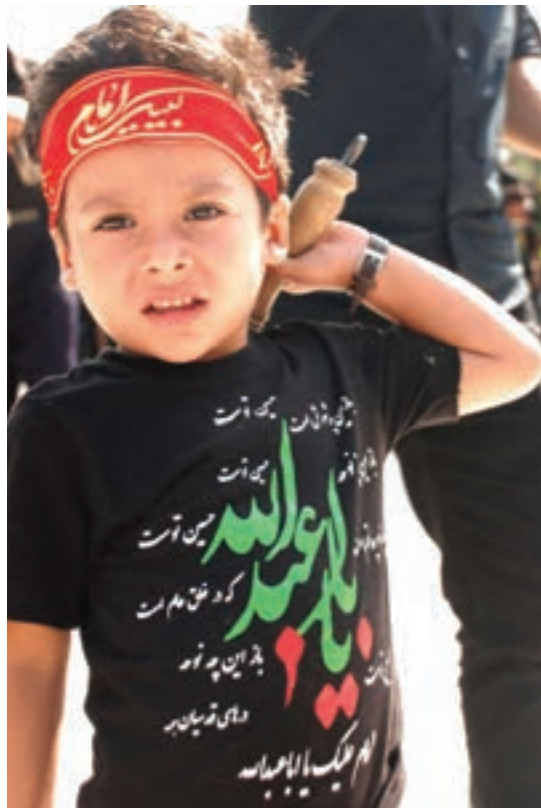
شکل ۵- حضور کودک در مناسبت‌های دینی و ملی