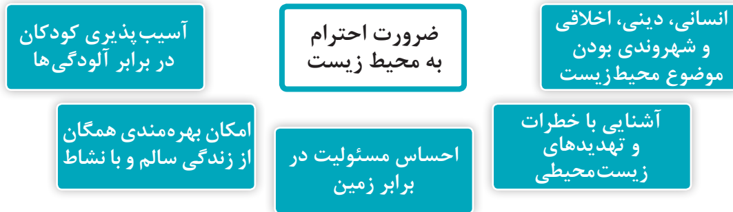
نمودار ۴- ضرورت های احترام به محیط زیست

بیشتر صاحب نظران اعتقاد دارند که در مورد اهمیت و ضرورت احترام به محیط زیست باید به نقش کودکان بیشتر توجه کرد و آگاهی آنها را با مسائل محیط زیست افزایش داد. ضرورت های احترام به محیط زیست در نمودار ۴ نشان داده می شود: