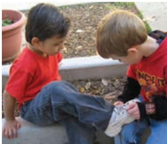
شکل ۵ - یاری یک‌سویه