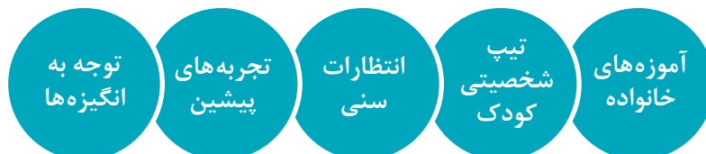
نمودار ۱- عوامل مؤثر در مشارکت کودکان

مهم‌ترین عوامل بازدارنده یا تقویت‌کننده مشارکت کودکان در نمودار زیر نشان داده شده است: