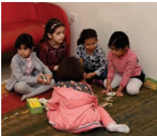
شکل ۱- بازی مشارکتی

فعالیت ۱: با توجه با تصاویر بالا، با هم گروه‌های خود گفت‌وگو کنید و نتیجه را ارائه دهید.