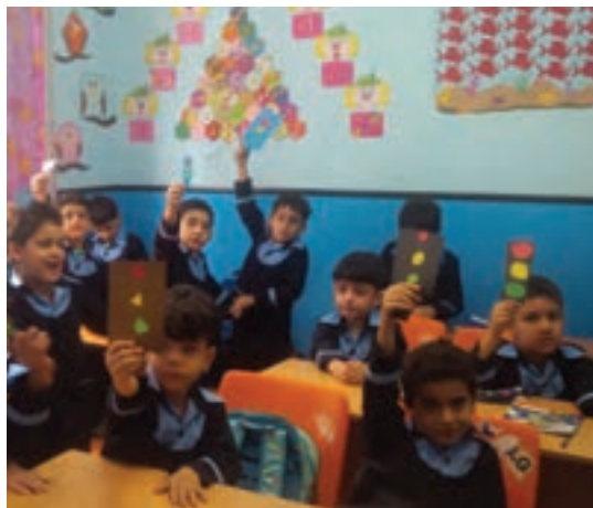
شکل ۱۱ - کودک و بزرگسال

فعالیت ۲۷: در گروه‌های کلاسی، با توجه به تصاویر بالا، در مورد شباهت‌های این دو گروه اجتماعی و نقش مربی در این دو گروه گفت و گو کنید و نتیجه را در کلاس ارائه دهید.