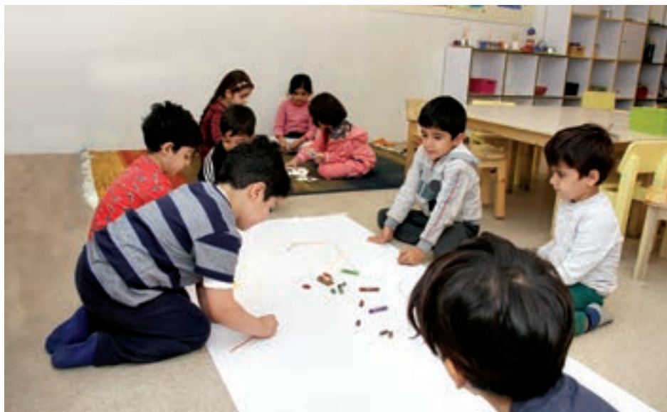
شکل ۱۲ - فعالیت گروهی کودکان

وقتی کودک در گروه حضور دارد و رویدادهایی از قبیل شریک شدن در استفاده از وسایل، همکاری با دوستان در اجرای فعالیت‌های آموزشی، رعایت نوبت، کمک به همدیگر و یادگیری از یکدیگر را تجربه می‌کند، شخصیت او در ابعاد فردی و اجتماعی پرورش می‌یابد و لذت در کنار هم بودن را در اجتماع تجربه می‌کند (شکل ۱۲).