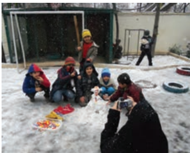
شکل ۲ - کار گروهی