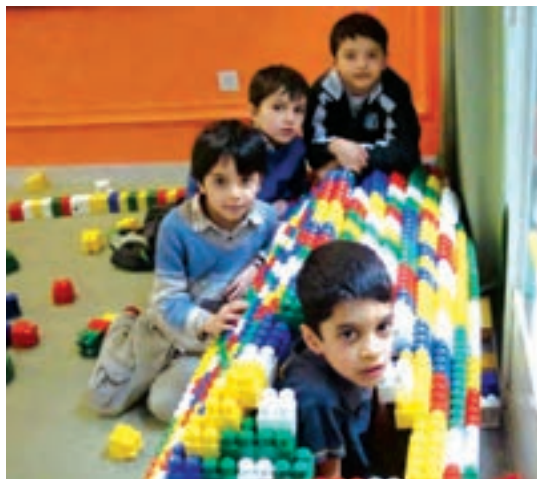
شکل ۱۰- کودک و بازی

فعالیت ۲۶: به تصاویر بالا نگاه کنید. هر تصویر، یکی از چهار گروه سنی کودکان پیش از دبستان را نشان می‌دهد. بررسی کنید کودک در هر مرحله چه نوع ارتباطی با همسالان دارد؟