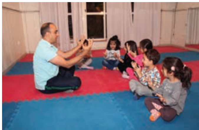
شکل ۳- ورزش کودکان