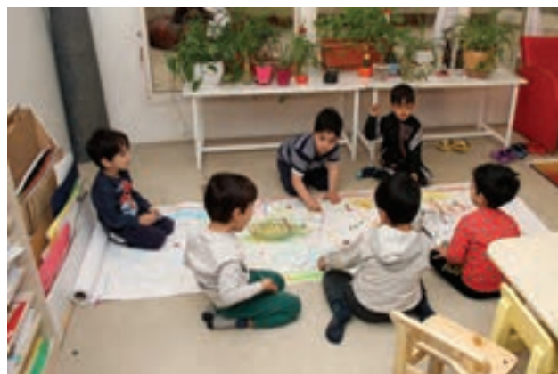
شکل ۴- نقاشی گروهی

۳ انتظارات سنی: سن کودک هم بر مشارکت او تأثیر دارد. اگر توقعات و انتظارات والدین و مربیان متناسب با سن کودک باشد، زمینه برای مشارکت تسهیل خواهد شد. کودک سه ساله‌ای که به یک اسباب‌بازی علاقه خاصی دارد، شاید به راحتی نپذیرد که برای بازی با آن با کودک دیگری شریک شود، اما یک کودک پنج ساله با این موضوع راحت‌تر کنار می‌آید. در کنار ویژگی‌های سنی، گاهی لازم است به تأثیر جنسیت هم توجه کرد. به‌طور معمول باورهای رایج باعث می‌شود که از دخترها انتظار مشارکت بیشتری داشته باشند اما