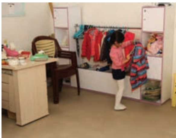
شکل ۹- مسئولیت‌پذیری کودکان

فعالیت ۲۲: با توجه به تصاویر بالا، کدام یک از رفتارهای کودکان را نشانه‌ی مسئولیت‌پذیری آنان می‌دانید؟ هر کدام پنج نمونه از رفتارهای مسئولیت‌پذیر بنویسید. و آنها را در کلاس مطرح کنید، سپس از مجموع آنها ده رفتار را، که فراوانی بیشتری دارند، مشخص نمایید.