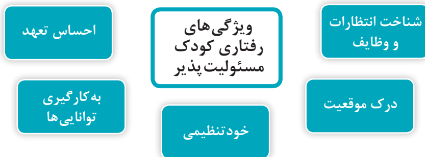
نمودار ۳- ویژگی‌های رفتاری کودک مسئولیت‌پذیر

ویژگی‌های رفتاری کودک مسئولیت‌پذیر در نمودار ۳ نشان داده شده است: