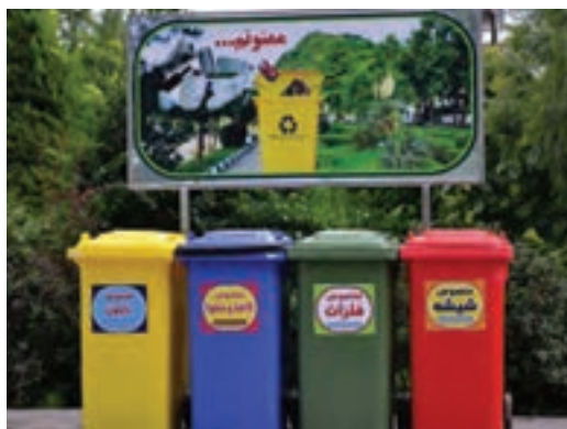
شکل ۶ - ارائه الگوی درست به کودکان