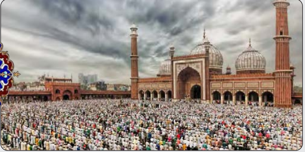
الْمَسْجِدُ الْجَامِعُ فِي مَدِينَةِ دِلْهِي فِي الْهِنْدِ.

﴿...أَقِمَّ وَجْهَكَ لِلدِّينِ حَنِيفًا﴾