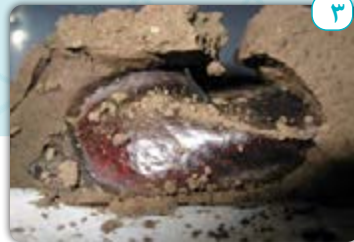
٣- الْجَفَافُ : خشك