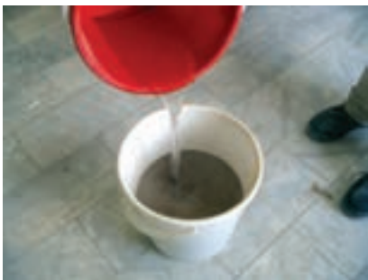
شکل ۱۵ - ۱۰

— سرند کردن خاک رس و ساخت گل : برای جداسازی کلوخه و ناخالصی و جمع‌آوری خار و خاشاک بهتر است خاک را سرند کنیم. برای این کار مقداری خاک رس را به کمک هم‌گروهی خود با سرند ۱ تا ۳ میلی‌متری، الک کنید. برای مخلوط کردن خاک رس با آب، ابتدا خاک رس را در ظرف مناسبی بریزید و به آرامی آب را به آن اضافه کنید تا گرد و غبار ایجاد نشود. برای این کار، حدود ۲۵ تا ۳۰ درصد آب کافی است (شکل ۱۵-۱۰).