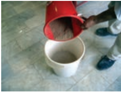
شکل ۱۴ - ۱۰

بایستی معمولاً خاک کاملاً مخلوط و یکدست خریداری شود و تلاش کنید آن را در کارگاه فقط در داخل سطل زیر رو کنید. خاک رس دارای ساختمان سستی است و هرگونه مواد اضافی در حین هوازدهی در سطح آن پراکنده می‌شود. در صنعت برای به دست آوردن یک توده یکنواخت اگر میزان ذخیره بالا باشد، آن را به کمک لودر و ماشین‌آلات مکانیکی زیر و رو می‌کنند. این مخلوط کردن خاک در عمل ورز دادن یا عمل آوری گل بسیار مؤثر است (شکل ۱۴-۱۰).