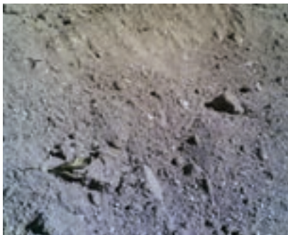
شکل ۱۳ - ۱۰

— هوادهی به خاک رس و مخلوط کردن آن: خاک رسی را که یک هفته تا سه ماه در معرض هوای آزاد قرار گرفته باشد برای این کار مناسب‌تر می‌دانیم. در این صورت اتصالات بین دانه‌های رسی سست‌تر می‌شوند و کلوخه‌های آن به سهولت به پودر تبدیل می‌گردند. لازم به یادآوری است در مناطقی که بادهای موسمی دارند، قبل از شروع وزش این بادهای خاک را از معدن استخراج و در محلی پهن می‌کنند تا در معرض باد قرار گیرند. در کارگاه نیز خاک رسی را بردارید که قدیمی‌تر باشد (شکل ۱۳-۱۰).