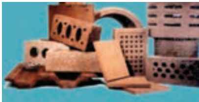
شکل ۱۲ - ۱۰

مدتی صبر کنید تا مطمئن شوید که صورتک آماده جدا شدن از قالب است. بعد قالب گچی را بردارید و صورتک را پرداخت کنید (شکل ۱۱-۱۰).