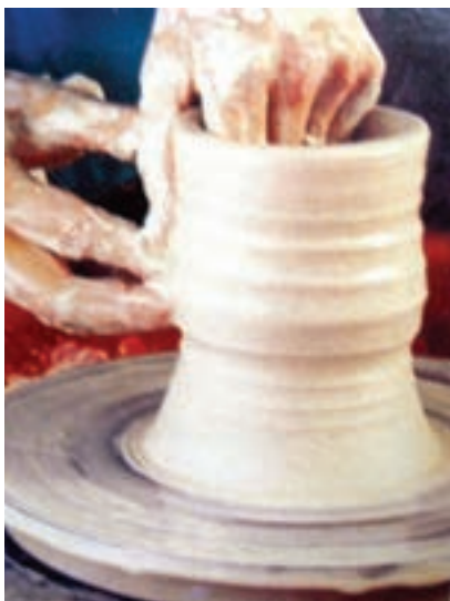
شکل ۱-۹- ب

دست یا با کمک شابلون استوانه را باریک کنید و گلویی مناسب پارچ را بسازید. برای این کار لازم است، به طور مداوم استفاده از آب شکل‌دهی را تسهیل کنید (شکل‌های ۱-۹- الف و ب).