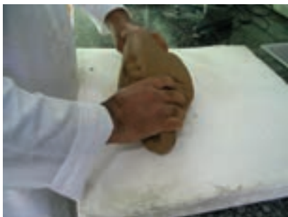
شکل ۱۶ - ۱۰

بعد به کمک تکه چوب یا همزن دستی خاک رس را با آب کاملاً مخلوط کنید و آن را روی لوح گچی ریخته تا آب اضافی آن جذب و تبدیل به گل شود. سپس آن را ورز دهید تا گل، یکدست و یک‌نواختی شود (شکل ۱۶-۱۰).