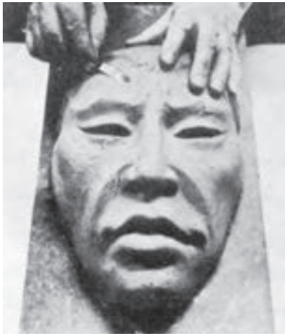
شکل ۱۱ - ۱۰

یک صفحه یا لوح گچی را آماده کنید و قالب به همراه صورتک را بر روی سطح صاف آن برگردانید. در صورتی که گل پرس شده زیاد نرم باشد می‌توانید ابتدا صفحه‌ی گلی را روی قالب گچی قرار دهید و بعد قالب گچی را به همراه لوح به آرامی برگردانید.