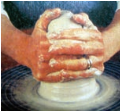
شکل ۱-۹- الف