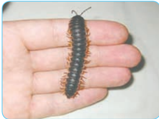
دو نوع هزارپا