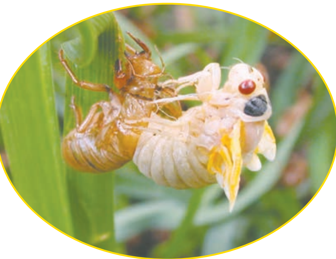
حشره در حال پوست اندازی

درباره‌ی انواع هزارپاها و غذای آنها، اطلاعات جمع آوری کنید و به کلاس گزارش دهید.