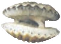
صدف دو کفه‌ای

جانوران بی مهره‌ی دیگری نیز وجود دارند که در آب و خشکی زندگی می‌کنند.