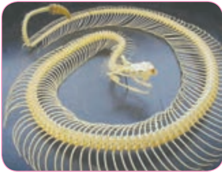
ستون مهره‌های مار

بدن کرم خاکی و بدن مار، چه شباهت‌ها و چه تفاوت‌هایی دارند؟ مار ستون مهره دارد و جانوری مهره‌دار است درحالی که کرم خاکی ستون مهره ندارد. به جانورانی که ستون مهره ندارند، جانوران بی‌مهره می‌گویند. مورچه، کفشدوزک، شته، عنکبوت و بسیاری از جانوران دیگر بی‌مهره‌اند.