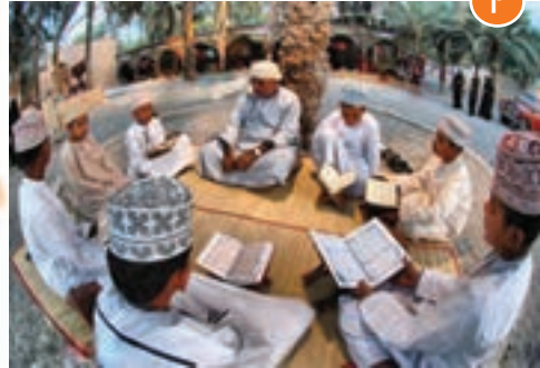
انس با قرآن کریم در کشورهای یمن ①، عمان ② و امارات ③